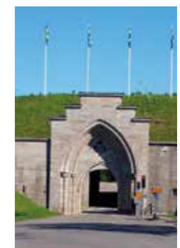
ENTRÉN. Tja, har man väl passerat den här porten, så är man faktiskt inne i fästningen, något som många turister missar...