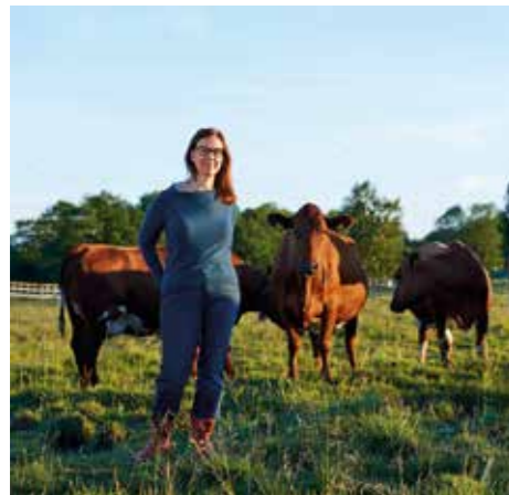
TA TILLVARA. Lär dig mer om goda styckningsdetaljer i Köttskolan.