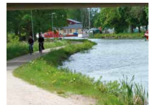
KANALCYKLING. Att cykla utmed Göta Kanal är avkopplande och nyttigt på samma gång.