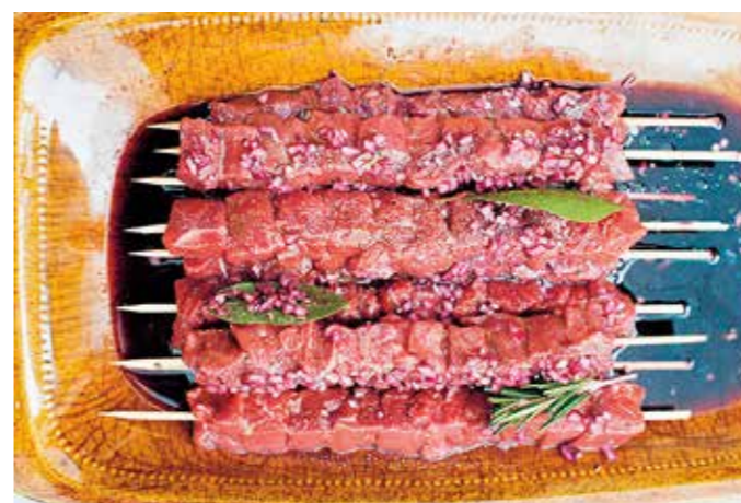
TÄNK PÅ. – Det är viktigt att råvarorna är jämnstora när du gör grillspett.