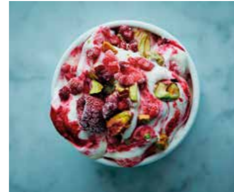
LJUVLIG SMAK. Len glass, syrliga hallon och knapriga pistagenötter.