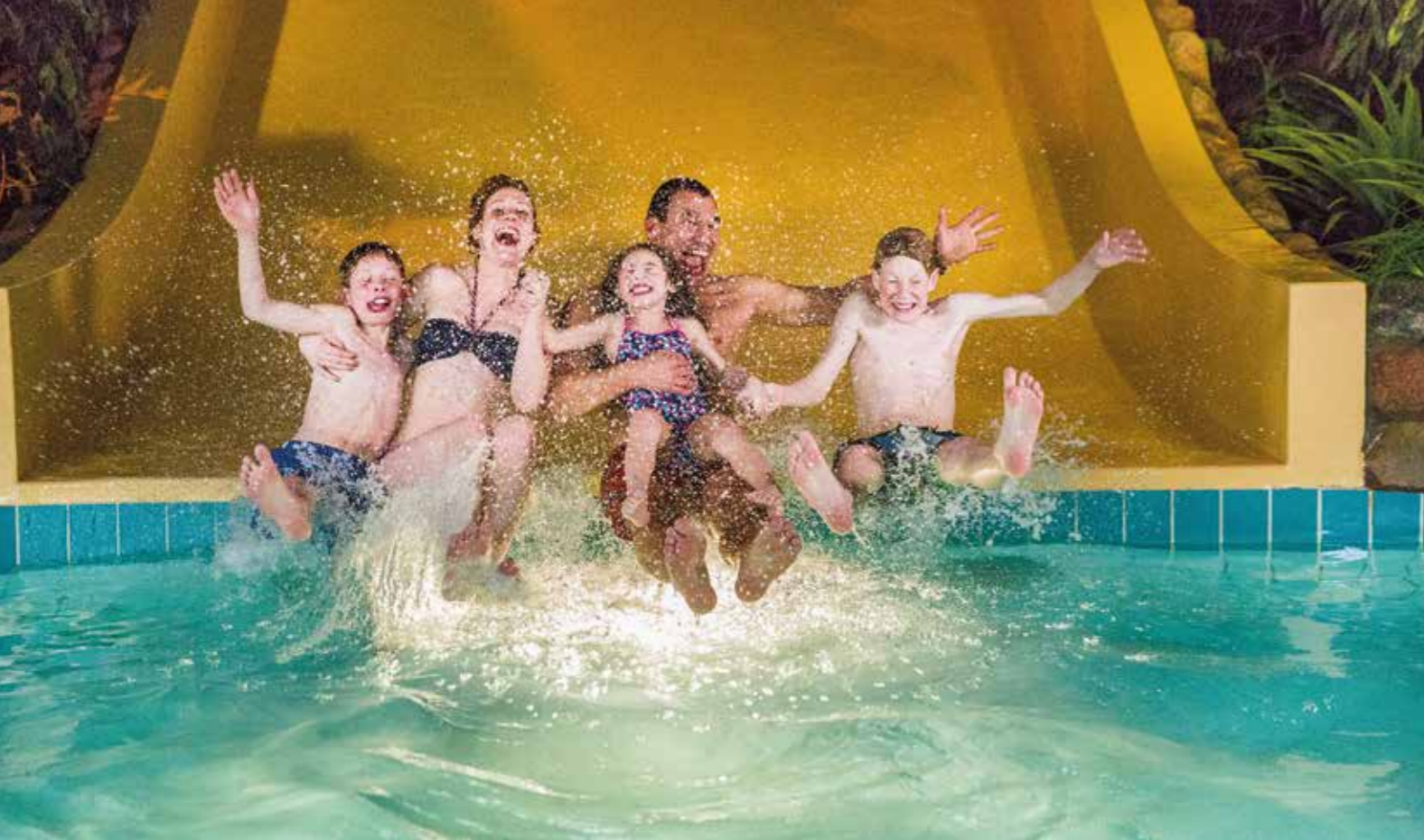
FÖR BARNFAMILJER. Turistsatsningen Västgötaturen tar i år ett rejält kliv framåt med sin rabattsatsning. I satsningen ingår badbart såväl på Äventyrsbadet i Skövde som på Skara sommarland.