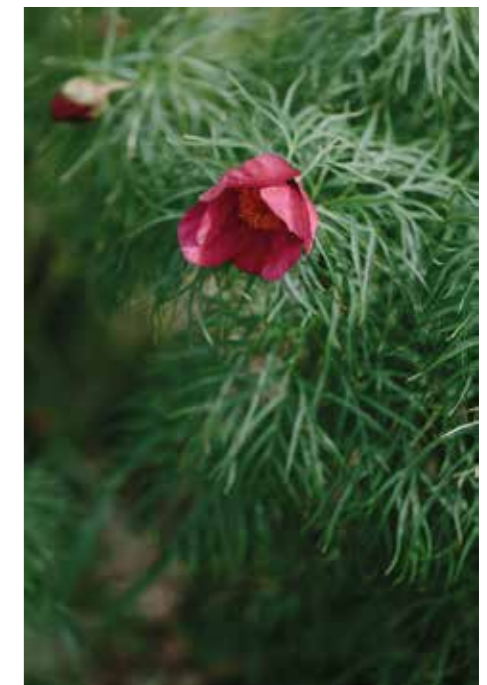
HERRGÅRDSPION. – I trädgården finns pioner som blommar vid olika tidpunkter.