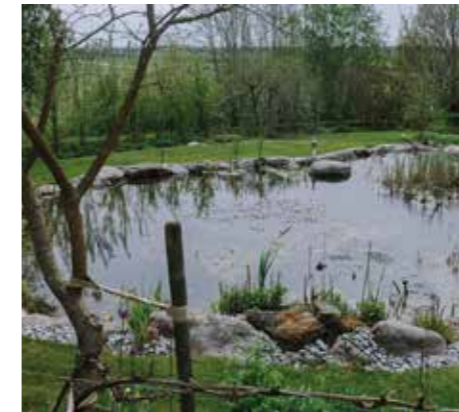
KÄLLVATTEN. Den vackra dammen leder mjukt vidare in till trädgårdens övriga rum. – Här badar barnbarnen gärna mitt på sommaren. Fast vattnet är svalt.

”växer inget ogräs växer inget annat heller”