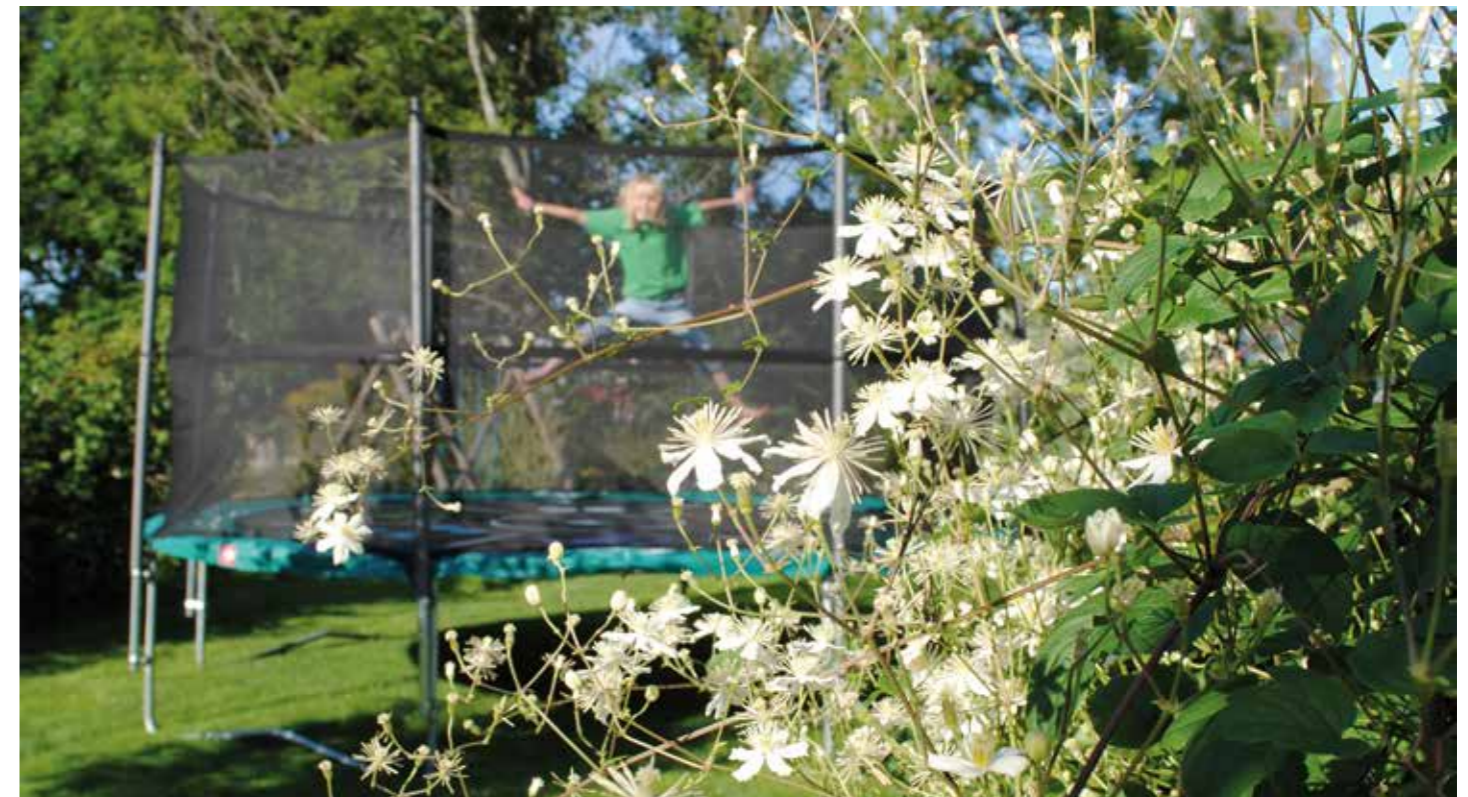
EN HÖJDARE. Att hoppa studsmatta hör sommaren till och är så himla roligt.