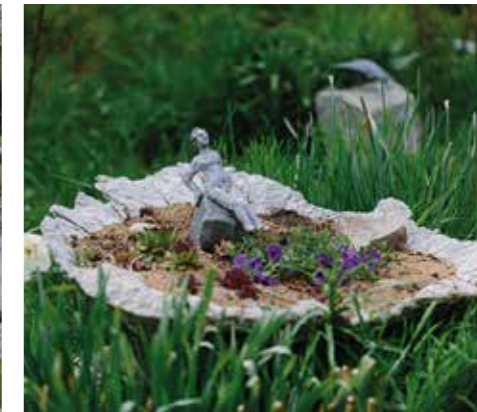
KONST. Inga-Lill är maskiningenjör men också konstnär och dockmakare. – Skulpturen är raku-bränt stengods. Fatet gjöt jag i betong ovanpå rabarberblad.