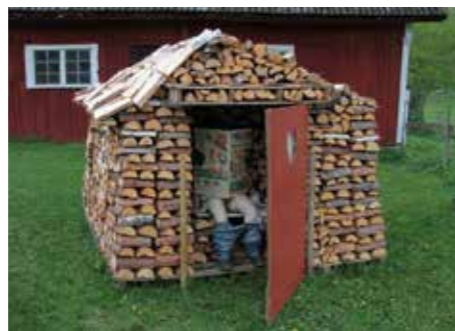
HEMLIGHUSET. Varje år skapas nya vedhus. Som så här dags på året är rivna och återfinns i vedboden.

– Det började när en norsk jänta gick förbi och tyckte att vår stapel såg ut som en stavkyrka och då satte vi på ett torn och ställde dit ett par skidor.