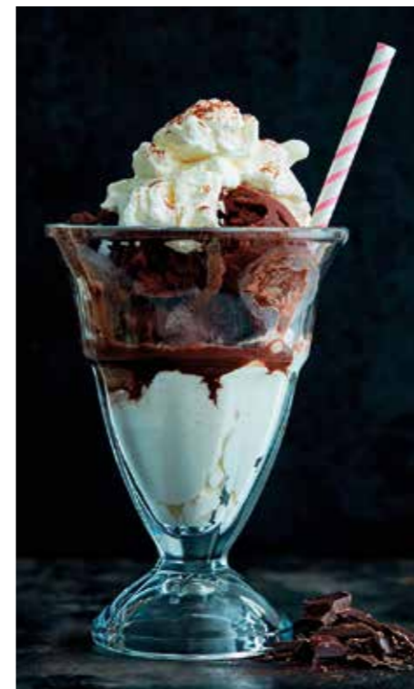
CHOKLADSMÅK. Tydlig och lite bitter. Öka på sockermängden för mer sötna.

Stavmixa 1 ½ dl hallon med citronsaft (lägg resten av hallonen och sidan). Grovhacka pistagenötterna. Blanda glassbasen (den ska inte vara fryst) med hallonsåsen, de hela hallonen och pistagenötterna. Gör det ”slarvig” och rör om bara lite så att det blir kvar ränder av hallonsås. Fördela glassen i serverings-skålar/form som klarar frysgader. Frys i 3 timmar eller tills den är helt fryst.