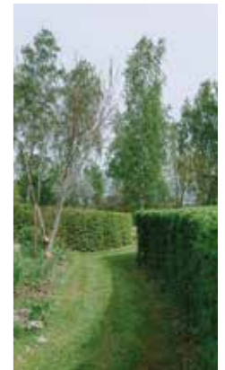
PÅ VÄG. De mjuka gräs-gångarna omges av fint formklippt lärkträdshäck.