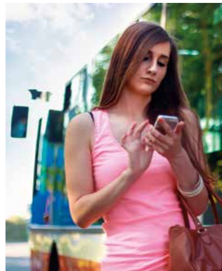
FÖR SENT. Enligt lag har du rätt till ersättning vid reseförseningar.

För längre busslinjer, över 15 mil, är det 120 minuters försening, inställd eller överbokad buss som utlöser följande valmöjligheter. Du kan då välja att resa med den försenade bussen, bli ombokad utan extra kostnader eller avstå från att resa och få pengarna tillbaka. Källa: Konsumentverket.