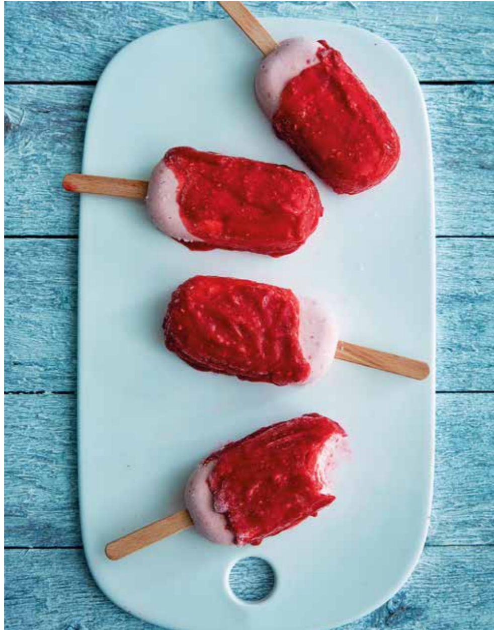
IL GELATO. Gör egen äkta italiensk glass hemma i ditt eget kök. Dessa recept ger dig lika ljuvliga smakupplevelser som glassen i Roms bästa gelateria.

Ställ en metallskål i frysen. Mixa 1 l hallon. Sila eventuellt. Blanda socker, dextros, mjölkpulver, glasspulver. Tillsätt mjölk och grädde. Värm under omrörning. Stäng av när det börjar bubbla, 80–85 grader. Häll upp i den kalla bunken. Tillsätt hallonkrämen och vanilj. Täck med plastfolie. Låt svalna i kylen. Kör i glassmaskin till krämig konsistens. Cirka 15–25 min. Lägg i glassformar. Frys i ca 2 tim. Mixa hallonen till höljet med florsocker. Sila eventuellt. Doppa hela eller halva glassarna i krämen. Frys i 15 min.