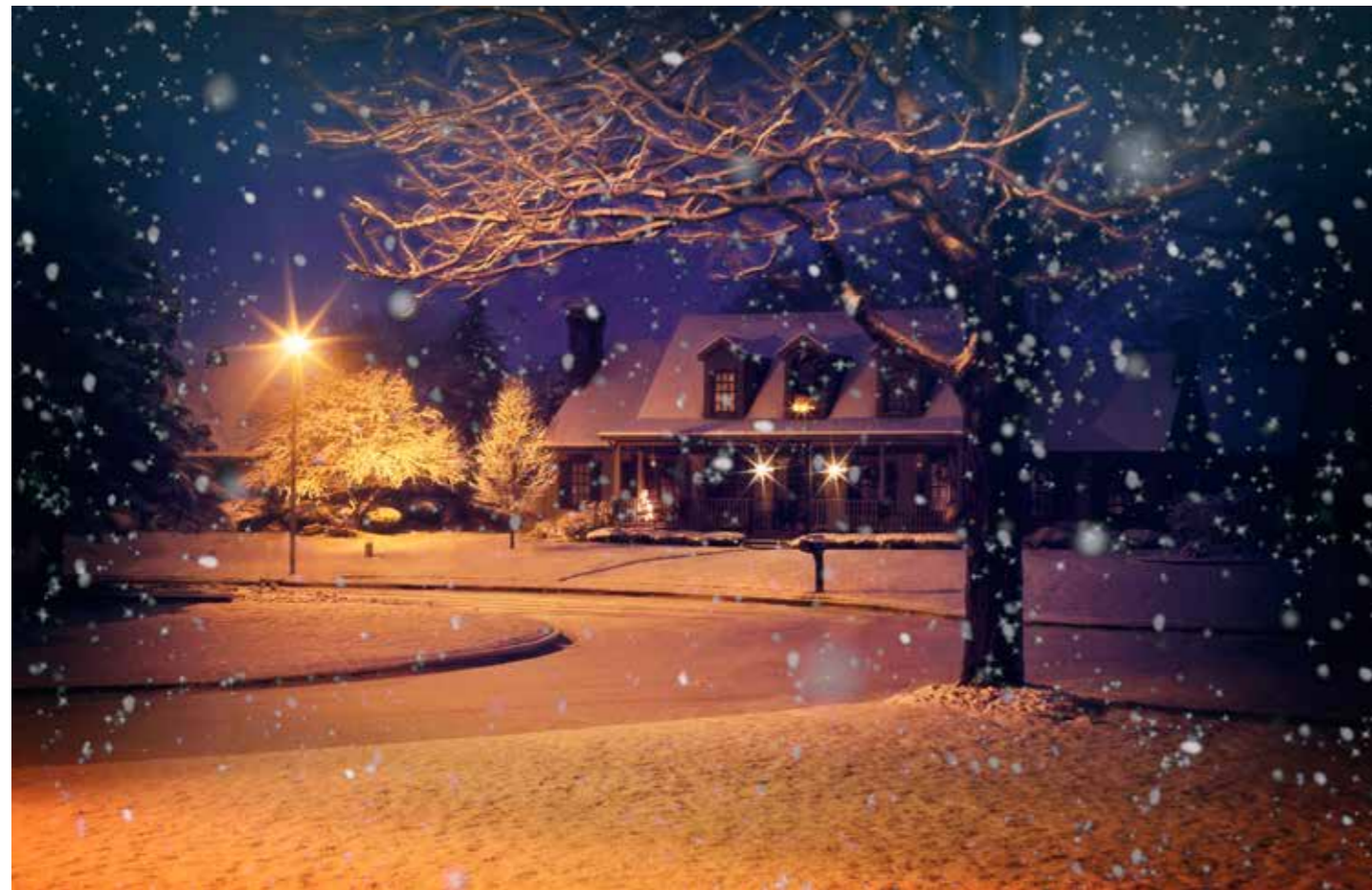
VARMT I VINTER. Snart är det dags igen, men för att riktigt njuta av vintern vill man förstås ha varmt inomhus. Många värmeeffektiva värmekällor finns på marknaden och den tekniska utvecklingen har gått fort.

Andelen av varvtalsstyrda bergvärmepumpar som säljs ökar hela tiden och låg förra året på 62 procent. Dessa ökar värmeproduktionen vid behov, medan kompressorn går ner i varv när behovet minskar och sparar därmed energi. Det är helt enkelt bäst driftsekonomi med en sådan lösning. Årsvärmefaktorn, SCOOP-värdet, är det