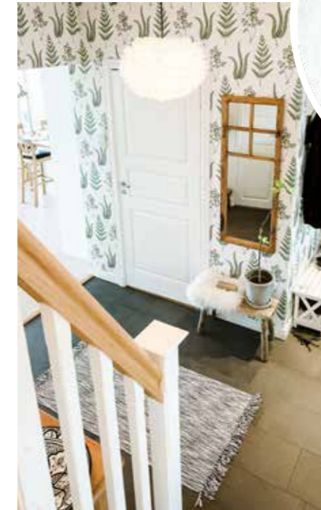
SKOGENS FAUNA. Hallen med inspiration från skogen. På väggarna sitter tapeten ”Herba”, ur kollektionen Falsterbo II från Boråstapeter.