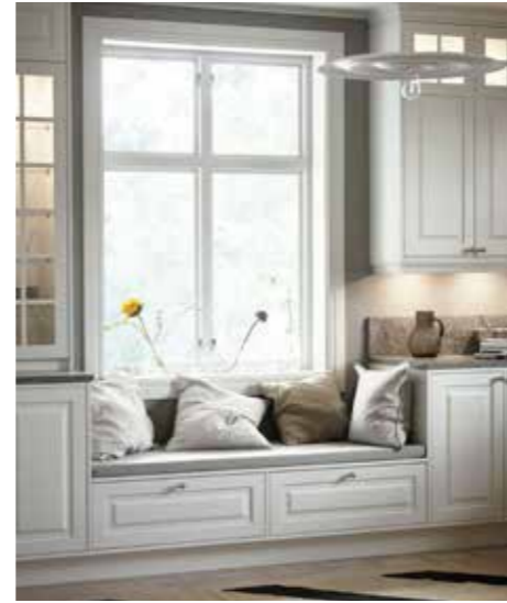
SITTBÄNK. Outnyttjade ytor, som under köksfönstret eller ett tomt hörn, kan lätt ändras till en mysplats med smart förvaring.