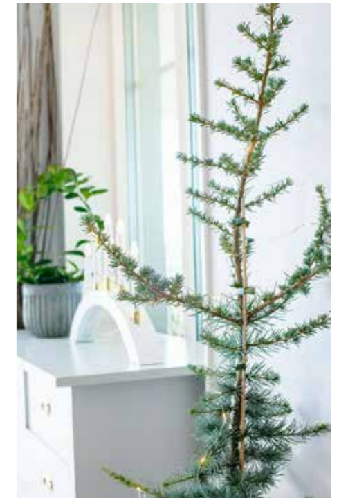
ADVENTSTRÅD. Som ett grönt dekorativt smycke och med vacker skir ljusslinga sätter cederträdet tonen för adventskänslan.