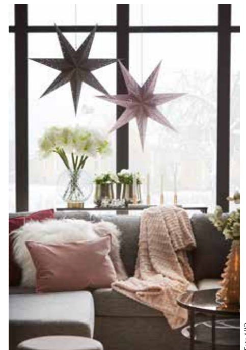
MODERN. Mio låter de mjukt rosa nyanserna kombineras med grått och vintervitt till en skandinavisk sober jul med inslag av mässingsdetaljer och fluff.