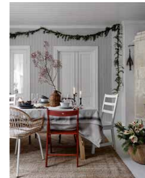
TIDLÖS. Julen på Ikea är en stämningsfull högtid i år som går i rött och vitt med naturinslag.