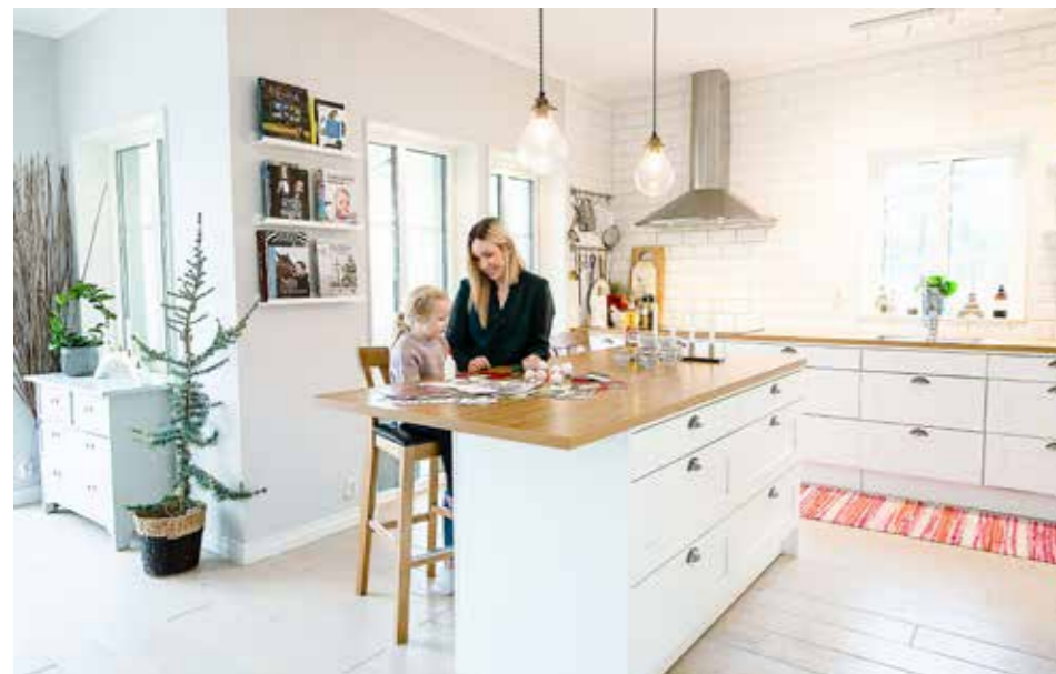
ADVENTSPYSSEL. Vid den generösa köksön är det perfekt att samlas för pyssel och glöggmys.