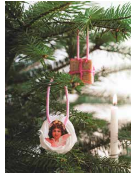
KRISTYRHÄNGEN. Få pysselidéer genom att fråga den äldre generationen vad de pyntade med som barn. Var det med egengjorda halmstjärnor, pappershjärtan, guldstjärnor, vaxljus eller kristyrpynt männe?

Idéer finns självklart på internet. Att hitta dem ingår i det engagemang som resulterar i julstämning. – Julkänsla upplever vi med sinnet och vad känns mer stämningsfullt än det vi gjort med egna händer?