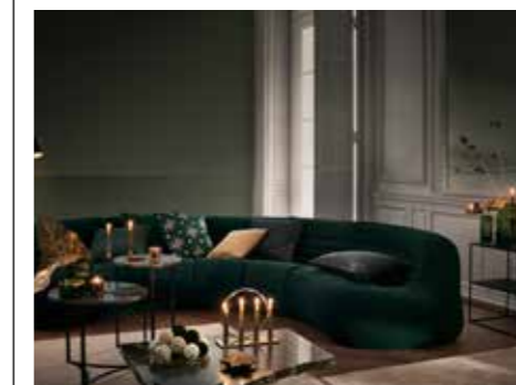
BLÄNKANDE SOBERT. Hos HM Home är julen glamourös med blanka metaller, mörkgrön sammet och mjuk fuskpäls som tillsammans ger en lyxkänsla att boa i sig i.

Också på Ikea är julen mer traditionellt skandinavisk med vita och ljusa tränyanser kombinerat med rött och med inslag av rotting. En fullt hållbar färgskala att trivas i också efter julhelgen. Bland julnyheterna finns också nya textilier vars mönster och tryck för tankarna till klassiskt hantverk och skandinavisk designtradition.