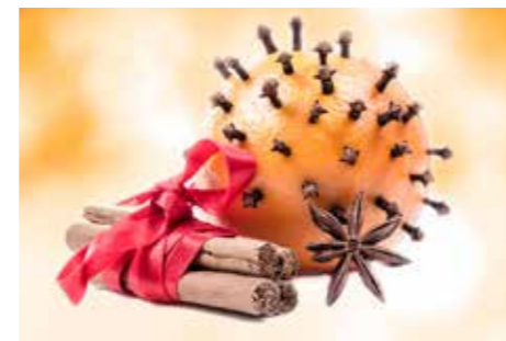
MED JULDOFT. Pynt från förr som är enkla att göra. Tillsammans.

fantastiskt pynt. Och tänk vilka dofter en apelsin med nejlikor sprider. Ett kul sätt att jula in sig är att bjuda in till knytpyssel. Ett pyssel där alla anstränger sig och bidrar med var sin pysselidé inklusive material som alla sedan skapar utifrån. – Pysselpartyn med material som nästan inte får kosta något är en kreativ utmaning. Inspiration finns i det ätbara och i naturen. Ett fat med nötter, mandariner, pepparkakor, kottar och granris är ett läckert pynt, liksom ett mini- vinterlandskap av naturmaterial.