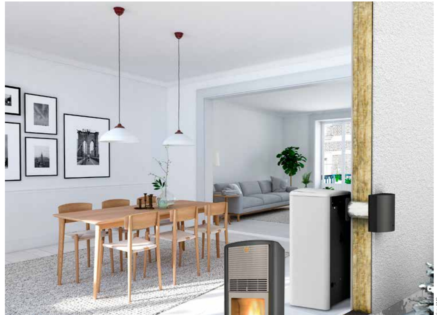
SKORSTENSFRI. Svenska KMP AB presenterade för drygt tio år sedan sin första finessen är att det går att ha full kontroll på förbränningen och styra effekten till