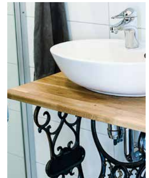
ANNORLUNDA. En gammal symaskin har fått bilda underrede till tvättstället i den lilla toaletten.