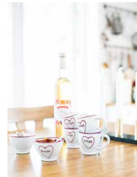
GLÖGGTIDER. På den stora köksön dukas det upp för trevligt glöggfika.