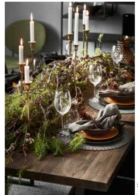
NATURLIGT. Mios träbord dukas med det naturen har att ge av kvistar, kottar och barrväxter kombinerat med rustik keramik och lite mässingsblänk.

MORE IS MORE. HM Home låter det överdådiga få ta plats på bordet, stämningsfullt och med guldkant. Temat är klassiskt och känns väldigt mycket fest.