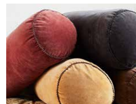
MUSTIGT. Varma färger bidrar till att göra hemmet till en stilblandad scen.