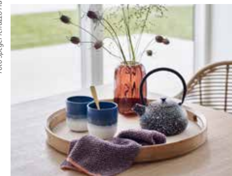
TREND. Var återhållsam när du väljer.