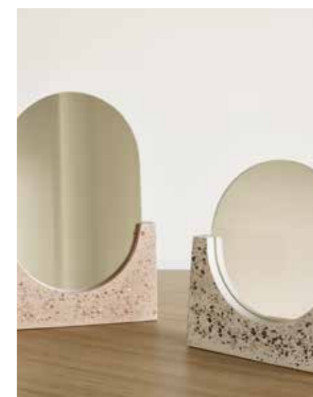
TRENDMÖNSTER. Terrazzo blandas t ex av cement, kvarts, granit, glasbitar.