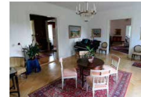
STILMÖBELINTRESSE. Roberts auktionsfynd börjar nu fylla upp den tidigare mycket glest möblerade Domprostgården i Skara.

– Efter att jag lämnat byggbranschen blev jag teaterproducent för en dansteater och så småningom ländanskonsulent. Jag har alltid haft ett intresse för teatern. Men när jag blev uppmuntrad att söka tjänsten dansproducent vid Malmöoperan eller som marknadschef för Cullbergbaletten tackade jag nej och sade istället upp mig. På frågan om vad han skulle göra istället