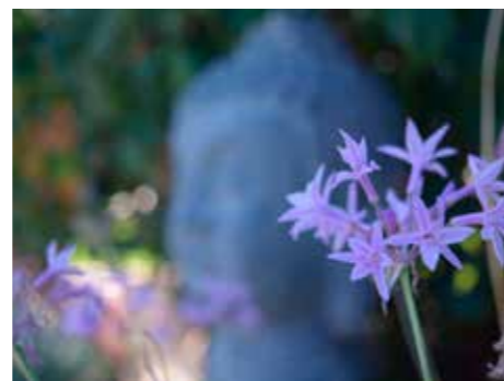
HÅLLBART. Dags att meditera kring HUR ska vi inreda och inte med vad.

Cliv in över tröskeln. Dra in doften du kopplar ihop med platsen. Gå vidare till det rum du vill besöka. Kan du minnas ljuden? Hur lät det när man gick över golven? Hur kändes det mot fötterna? Stanna upp, se dig ordentligt omkring. Ta in alla detaljer. Tillåt dig att pausa blicken om något fångar din uppmärksamhet. Stryk med handen över möblerna. Hur känns de? Hur ser de ut? Ser du färgerna i rummet? Hur spelar ljuset över väggarna? Och vad mer lägger du märke till som bidrar till den varma känslan i din kropp?