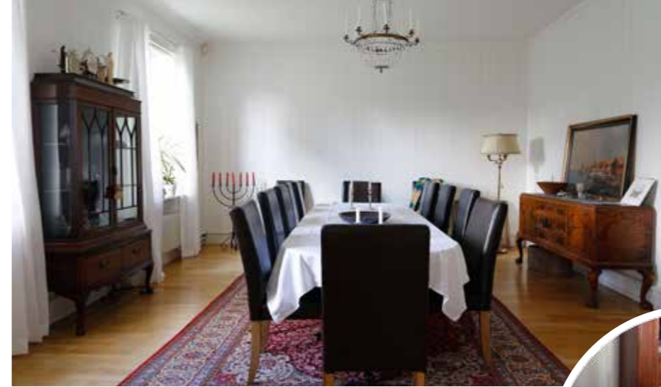
MIDDAGSBORD. Matsalen har utrymme för större bjudningar och sådana är inplanerade. Sådan ingår ju så att säga i tjänsten.

En avgörande skillnad mellan biskopsgård och domprostgård är att den senare inte per automatik är färdigmöblerad. Och den nya bostaden är betydligt större än deras gamla.