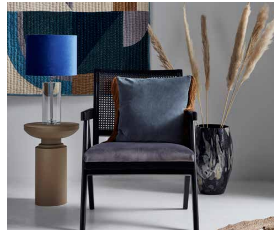
IT MATTERS. Grå och beige färger, lavanyanser och blått i höstens mer avskalade inredning. Lampor och stolar funkis utropstecken. Rottingen gör comeback.