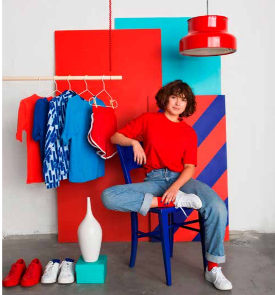
DRIVER PÅ. Med nya tjänster får Myrorna fler över secondhandtröskeln.