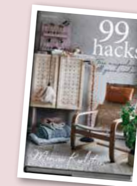
99 HACKS. Idéerna är hämtade från boken.

Eller klä fronterna med frontdekor. Rengör först med fuktig trasa och låt torka. Ta bort frontdekoren från skyddspapperet och sätt fast det på lådfrontens övre del. Stryk försiktigt med handen nedåt så att dekoren fastnar och eventuella luftbubblor pressas ut. Gör likadant på alla lådfronter.