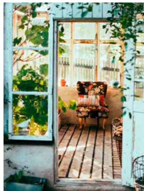
DISPLAYA EJ. En hållbar inredning är inte en markör som bara uttrycker en identitet. En hållbar inredning är det du uppfattar vara hemtrevlig, helt enkelt en plats där just du trivs och mår bra i.