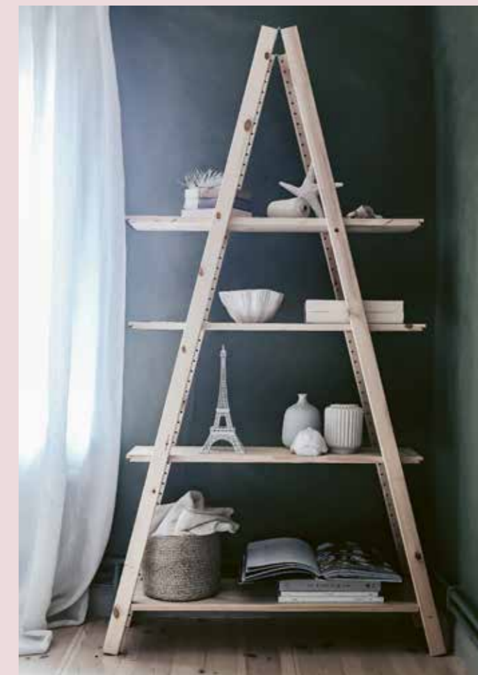
GÄRNA FÄRG. Hyllan blir snygg om du betsar eller målar den.