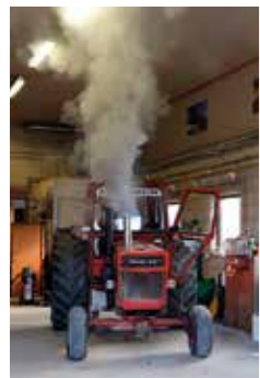
MEST UTE. Den här maskinen är inget man direkt önskar ha som garagegranne. Det blir snabbt rökfullt när motorn morrar igenå.

- Det är kul att se vad man kan åstadkomma.