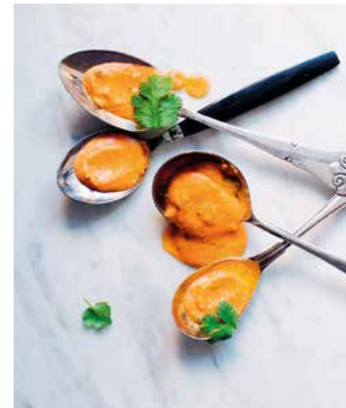
VARSAMT. Tomater innehåller antioxidanten lykopen, den enda antioxidanten som mår bra av att värmas.

1 gul lök 2 vitlöksklyftor 1 liter lantbuljong 200 g färsk grönkål 2 cm ingefära ½ citron 1 msk kallpressad kokosolja salt nymalen svartpeppar