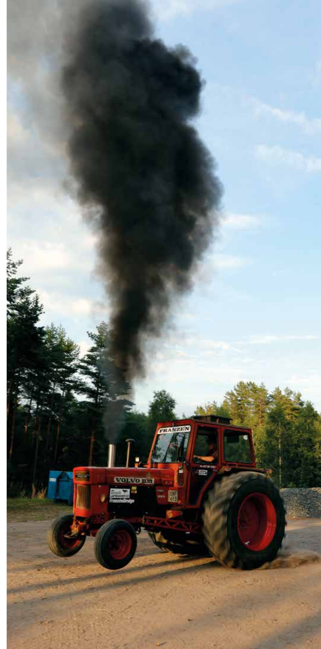
LJUDKRAFT. Med ett vrål släpps hästkrafterna lösa. Och vad gäller utsläppen finns inget fusk med värdena.