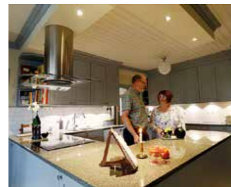
RENOVERAT. Köket hör till det som sist renoverades. Då fick det en total makeover och försågs bland annat med bänkskivor av Bohus-granit från Eriks gamla hemtrakter.

Stommarna i köket är från IKEA, men all köksinredning har en snickare gjort på plats. Huset är ju med ålderns rätt tämligen skevt, så det funkar inte med standardlösningar.