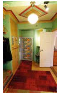
VARLIGT. Det mesta av det genuina är varsam renoverat. Bara linoljefärg med naturliga pigment används - och i tyget på köksdörren finns hela färgskalan som använts samlad.