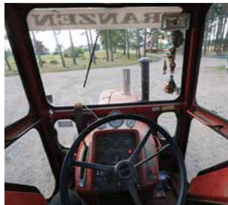
HETT. Inredningen är spartansk. Det viktigaste att hålla koll på är turbotrycket och motortemperaturen. Efter ett drag är motorn på smältgränsen.