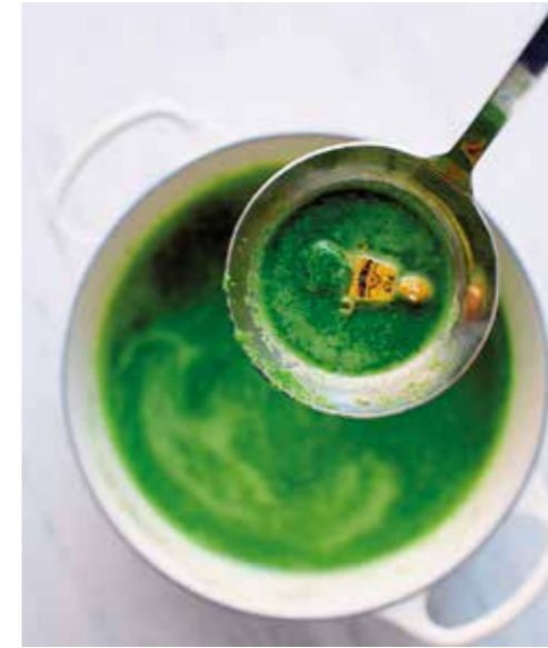
TARMFLORAPARTY. Frossa i goda grönsaker fulla av fibrer och antioxidanter.