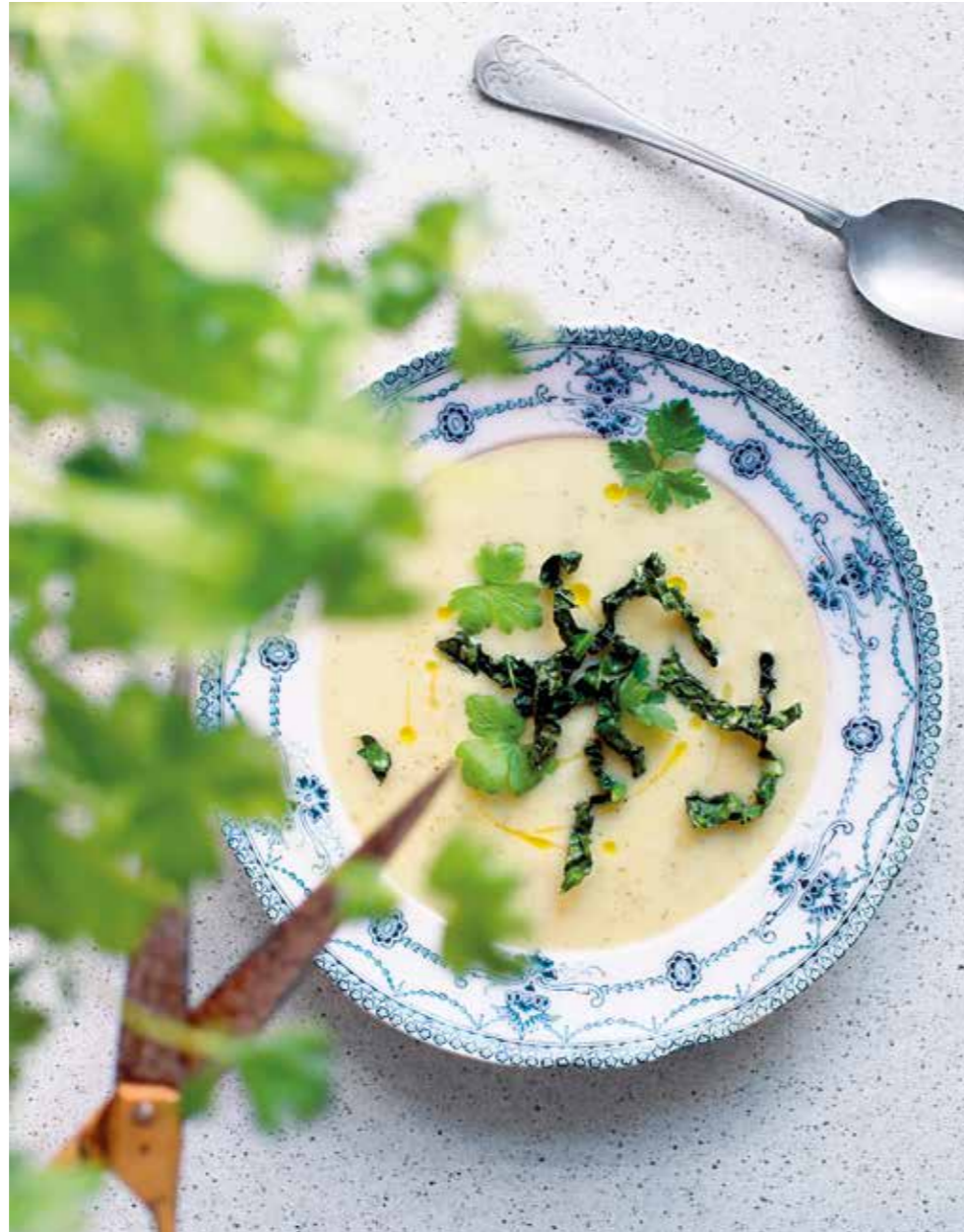
PSYKOSOPPA. Mat för hälsa. Forskning visar att goda bakterier och fibrer inte bara får vår tarmflora i balans utan även får oss att må bra mentalt.

80 g svartkål ½ msk olivolja 1 krm salt valfri färsk ört t ex bladpersilja