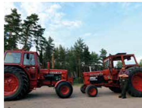
TVENNE. Båda gårdens traktorer är av samma märke och modell. Pålitliga dragare, men den Claes köpte och byggde om hade gått många år i snövänggen. Den gör skäl för devisen "In rust we trust".