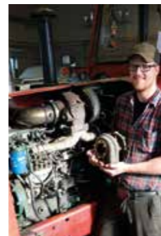
UPPSVING. Med den lilla originalturbon levererade 5,4-litersmotorn 147 originalhästar. Nu är de bortåt 800.