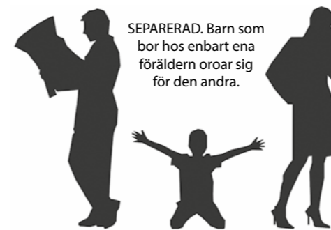
SEPARERAD. Barn som bor hos enbart ena föräldern oroar sig för den andra.

Det är större risk att barn som bor enbart hos den ena föräldern upplever hög stress, jämfört med de barn som bor växelvis hos båda föräldrarna efter en separation. Detta oavsett om föräldrarna bråkar, eller om barnet kommer dåligt överens med någon av föräldrarna. Det visar en studie från Stockholms universitet. – Förklaringen kan ligga i att barn som är borta större delen av tiden från den ena föräldern förlorar resurser i form av släkt,