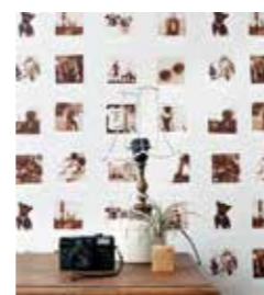
CHICA MOTIV. Retrokameror, spetsmönster och polaroidbilder på #FAB.

olika fototapeter. Tapeterna är Sätt Lätt-använd non woven lim och limma väggen. Kollektionen finns nu ute i butikerna.