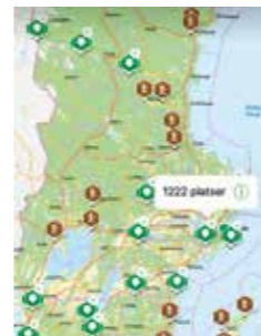
NATURKARTAN. Appen är en guide till Sveriges natur och friluftsliv.

Ambitionen är nu att få medytterligare fler intressenter för att skapa en heltäckande guide till Sveriges friluftsliv.