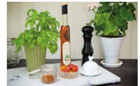
MATINTRESSE. – Jag är uppvuxen på en gård som producerar kött. Är mycket intresserad av mat. Experimenterar också gärna med alternativa sätt att laga mat eftersom vi har flera allergier i familjen.