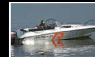
Nordkapp 605 Ranger