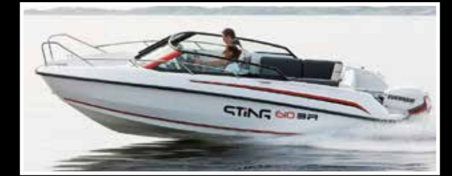
Sting 610 BR