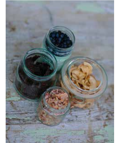
KAN SJÄLV. Den egna skörden räcker långt. Ibland ända till nästa säsong.