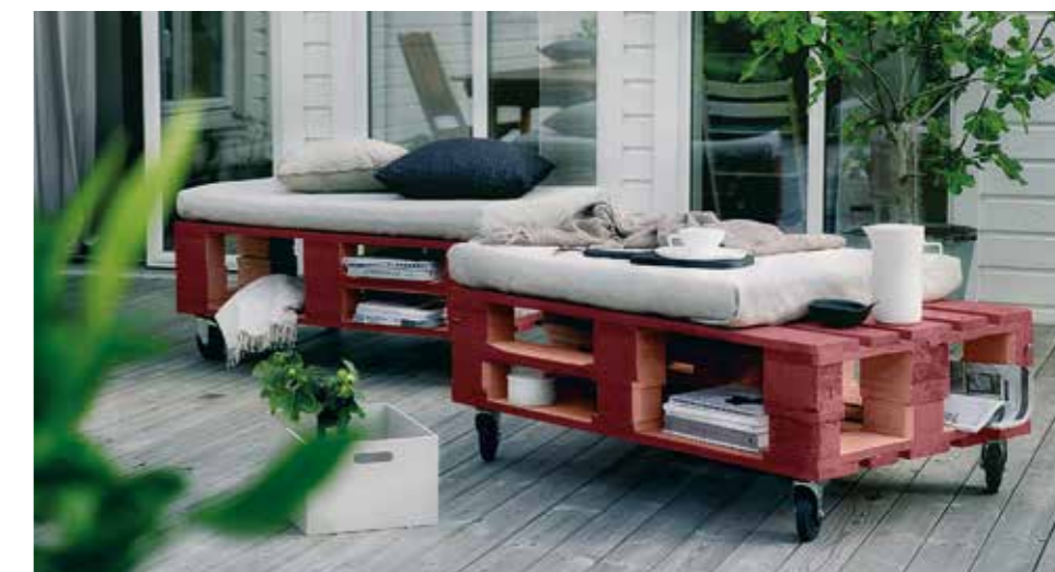
VÄRJOB. Dags att olja in altan och utemöbler.