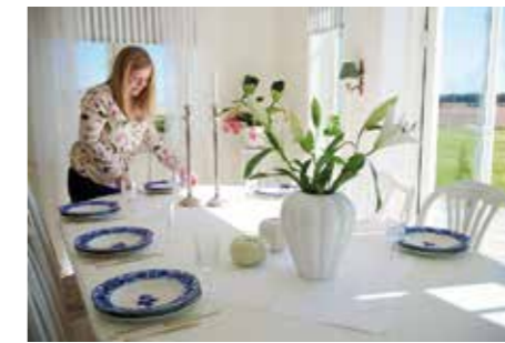
ALLTID HEMMA. – Vi trivs så otroligt bra med vårt liv och våra projekt här hemma. Vi hittar hela tiden på nya saker att göra här. Det är ett fantastiskt sätt att leva och det är livskvalitet för oss.

"Stora ytor, högt i tak och mycket ljus"