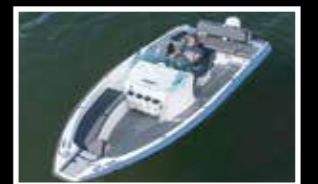
Sting 530 S

Båtar motorer tillbehör, Auktoriserad verkstad