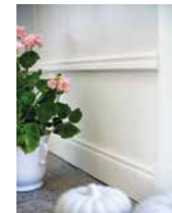
MÅLAD STIL. Väggarna i den stora hallen är målade med en matt nyans. De vita något blankare snickerierna bildar fin kontrast. Inte minst den vackra 30 cm höga golvlisten i sekelskiftesstil.