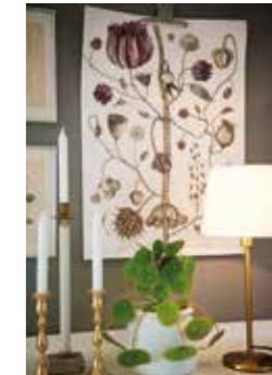
FORM. – Jag älskar form och har en förkärlek för organiska former, särskilt frökapslar. Gillar också mässing. Från att som tonåring ha avskytt metallen.