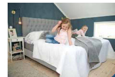
FÖNSTERLJUS. – De små fönstren under tak gör att alla rum på övervåningen har ljusinsläpp från två håll. På nedre plan valde vi till lite större jugendfönster för att få rejält ljus i varje rum.

Det viktigaste i husbyggarprocessen är att