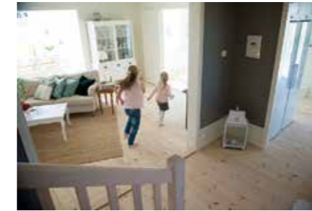
VÄXAHUS. Det är mycket eget arbete nedlagt i huset. – De pengar vi sparat på att bygga själva har vi lagt på en större bostadsyta. Vi har stora släkter och många vänner som vi vill kunna umgås med hemma.