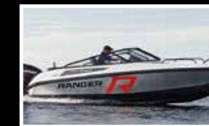
Nordkapp 605 Avant Ranger