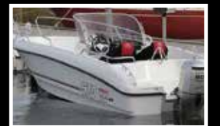
Micore 570 CC