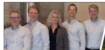
Skövdes starkaste köksteam

Modellen Sense är tillverkad av MDF och ytbehandlad med slitstark lack som är enkel att rengöra. De stilrena spåren i luckorna ger en modern och samtidigt klassisk känsla. Med Sense skapar du en avslappnad och trevlig stämning i ditt kök.