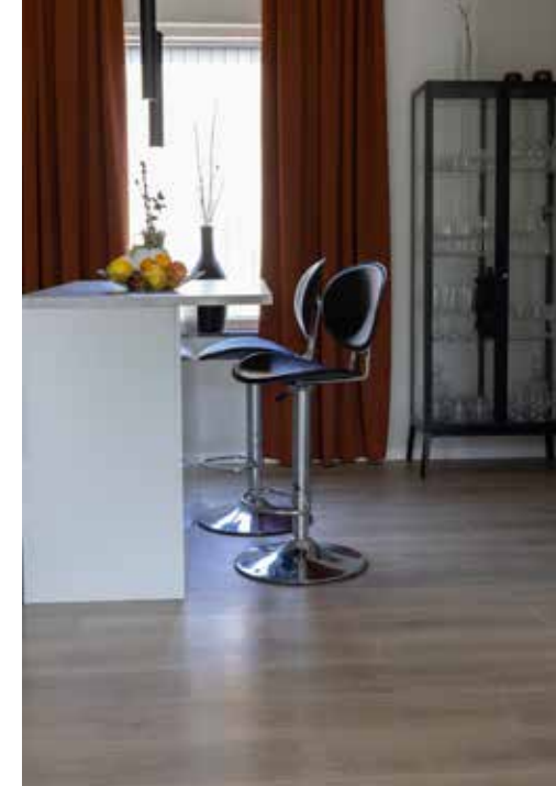
KÖKET. Istället för sedvanlig matplats valde Camilla och Tomas att placera en köksö. Här kan man hänga med goda vänner under matlagningen.