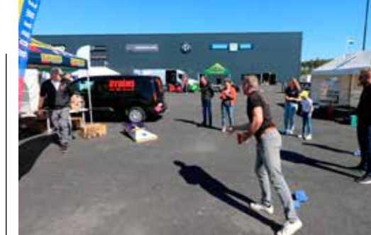
TÄVLING. Vid Blåkläders monter kunde man tävla om fina priser. Det gällde bara att pricka målet med alla ärtpåsarna först.