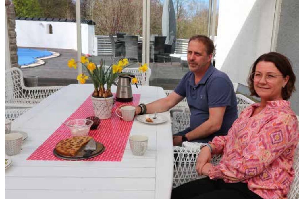
FIKASTÄLLE. Uteplatsen under glastaket är en favorit när det drar ihop sig till fikastund. Sommartid är den stora altanen med pool uppskattad.