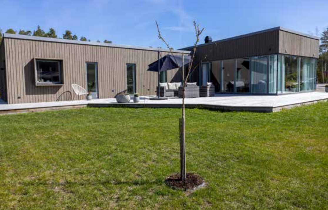
SOLSIDAN. Den generösa terrassen är placerad i söderläge. Här kan man njuta av många soltimmar med utsikt över sjön.