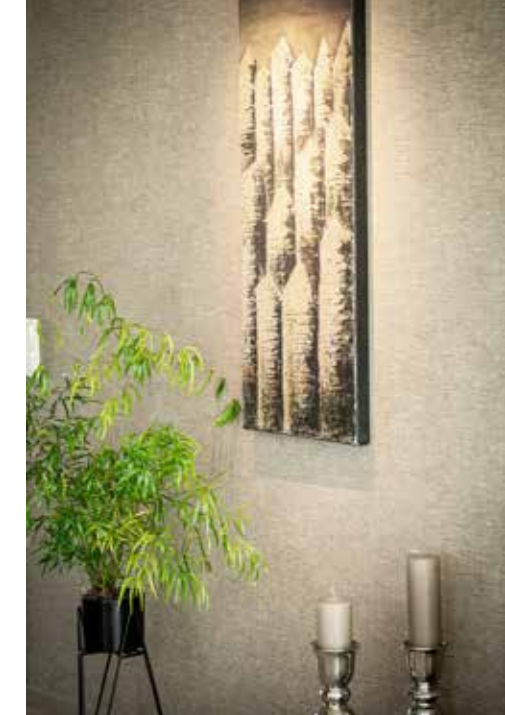
TAVELBELYSNING. Den vackra tavlan har Camilla och Tomas köpt av en god vän. I taket sitter en spotlight med syfte att belysa tavlan, vilket får den att ta plats under den mörka årstiden.