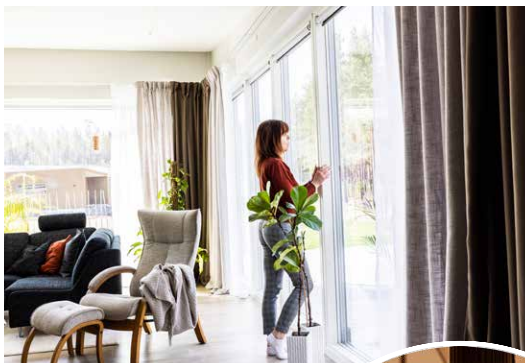
UTSIKT. Det stora och öppna vardagsrummet med panoramafönster suddar ut gränsen mellan ute och inne.

- En annan viktig del för mig har varit designen av belysningen i huset. I och med att jag arbetar med ljussättning, så vet jag hur mycket det påverkar känslan och atmosfären i ett rum.