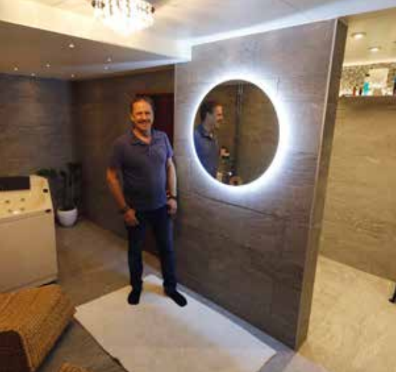
INOMHUSSPA. När det var dags att renovera badrummet togs ett rejält grepp och resultatet blev rena spakänslan med bastu, bubbelbad och dusch snyggt inramat av sten.