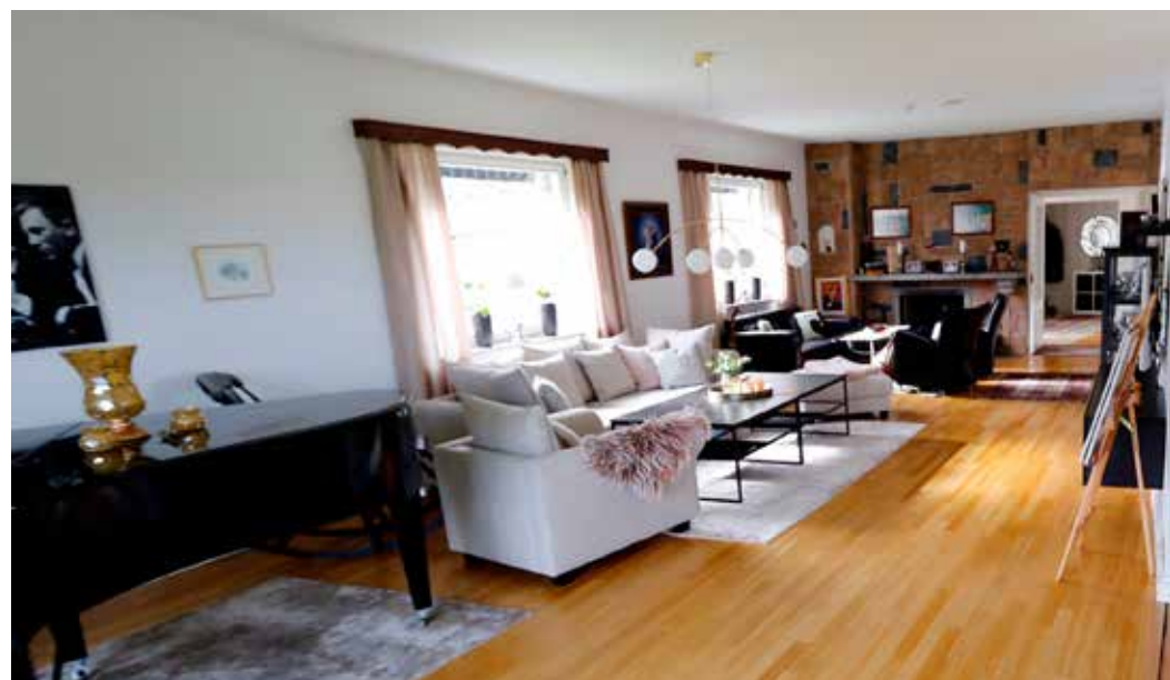
RYMLIGT. Det är gott om svängrum i husets vardagsrum - bortåt 80 kvadratmeter och högt i tak, med många ljusinsläpp som bidrar till känslan av rymd.