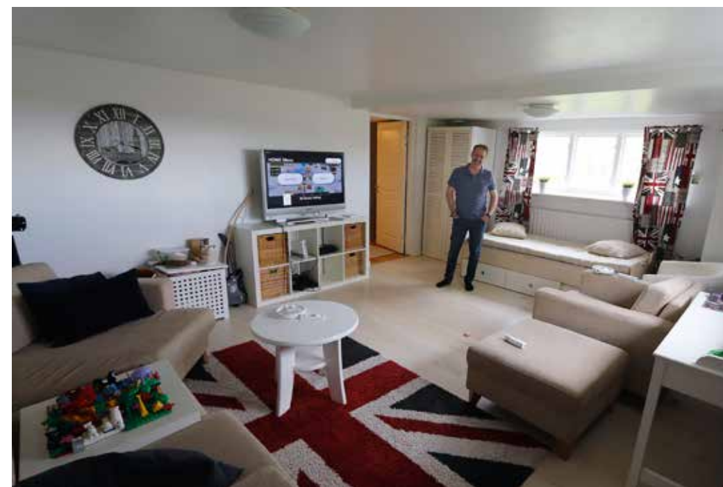
ALLRUMMET. Det stora rummet i källaren har förvandlats till ett allrum för fritidsaktiviteter. Vid behov fungerar det också som gästrum.