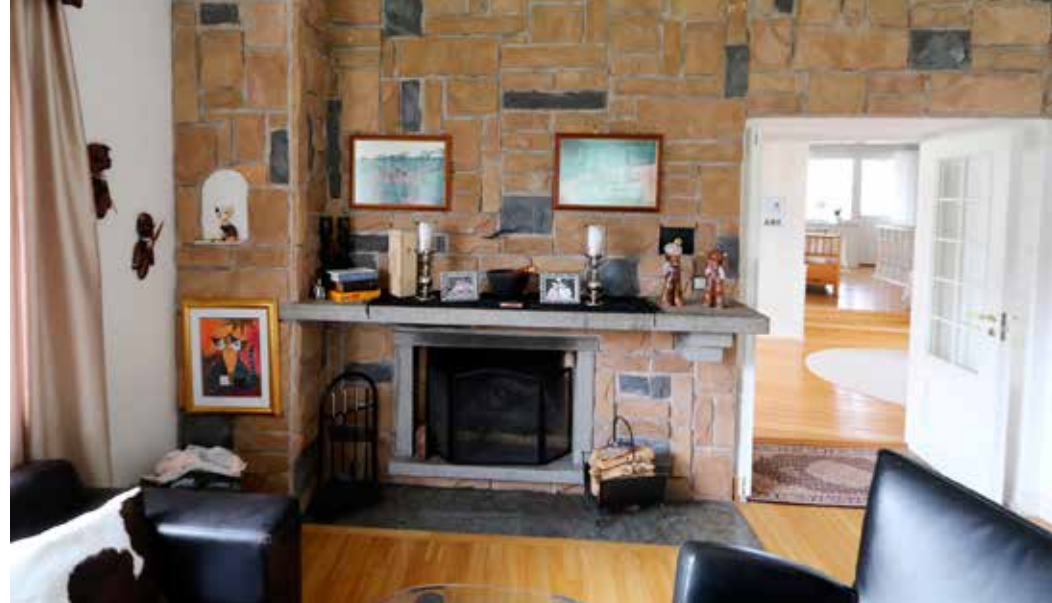
HUSANS VÄRMEKÄLLA. Den öppna spisen i vardagsrummet var en integrerad del av uppvärmningssystemet. Bland annat levererade den värme till "husans rum", som det hette på ritningarna.

helt ny skepnad. Det vändes "inåt" istället och så togs stora ljusinsläpp upp i ytterväggen, vilket gav ett helt nytt intryck utan att påverka husets stil. Det ser ut som det varit tänkt så redan från början.