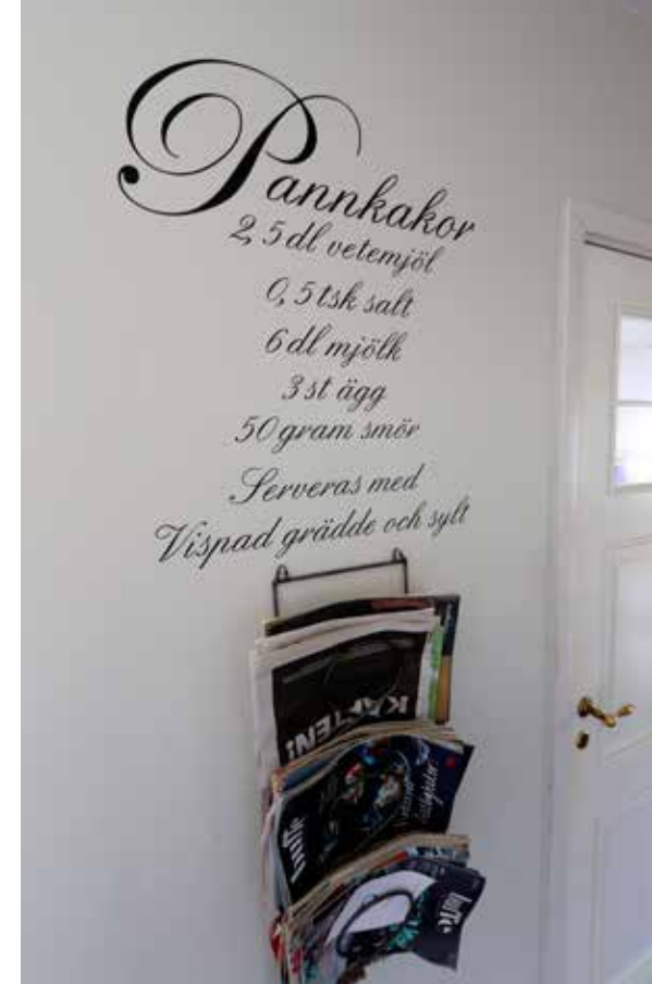
INREDNINGSDETALJ. – Vår äldsta dotter ringer då och då och ber mig fota receptet och messa över det, så det har kommit till mycket användning, berättar Carola.

den kontaktade arkitekten om att det var en dålig idé så skrotades tankarna på detta. Annars var det typ läge för detta när det visade sig att luftspalten mot yttertaket varit för snålt tilltagen så att mögel börjat växa där. Det resulterade i att i stort sett hela taket fick rivs upp och ersättas med ett nytt som dessutom försågs med fläktstyrd ventilation för att få bort all eventuell fukt i framtiden.