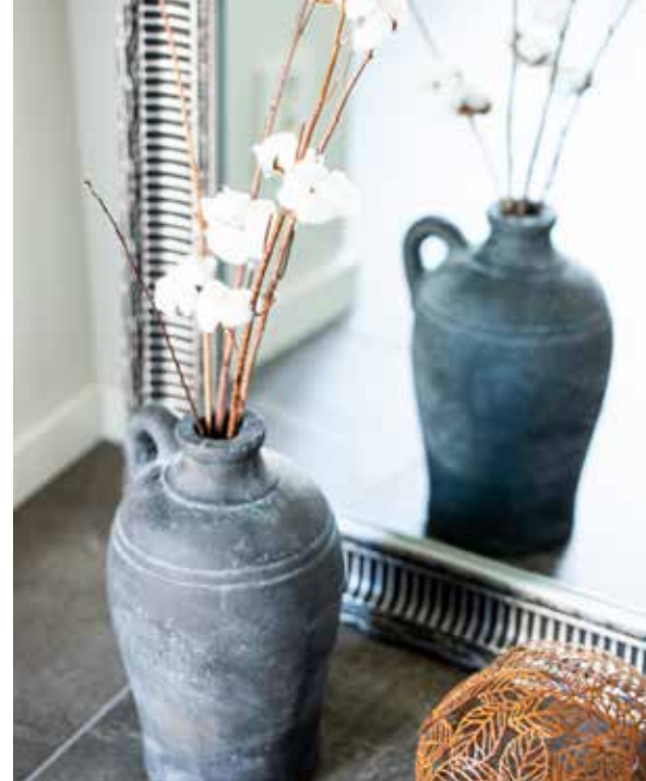
SPARSMAKAT. I hallen möts man av en härlig spegel och ett stilfullt stilleben. I det enkla bor det vackra.