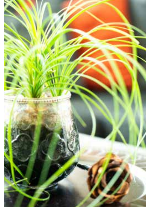
EFFEKTFULLT. På flera ställen i huset finner man blommor som harmonierar med husets stil.