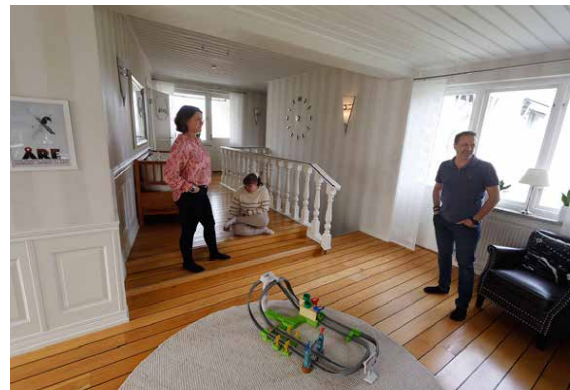
SAMLINGSPUNKT. Entréhallen har blivit något av ett samlingsställe.