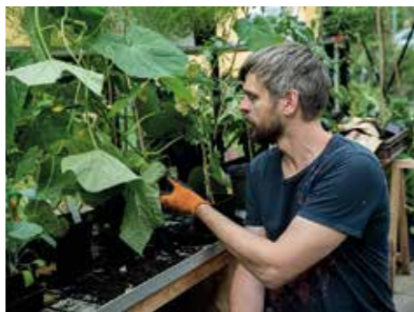
TIPS. Börja med att använda den jord som finns där du tänker odla. Med ogrärensning, näring och organiskt material kan det bli en bra odlingsjord.