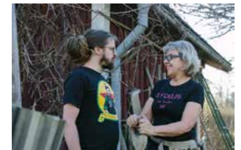
MOD. – Många är rädda för att be om hjälp eller be om saker. Men kommer man över det och börjar samarbeta så blir tillvaron både enklare och roligare.