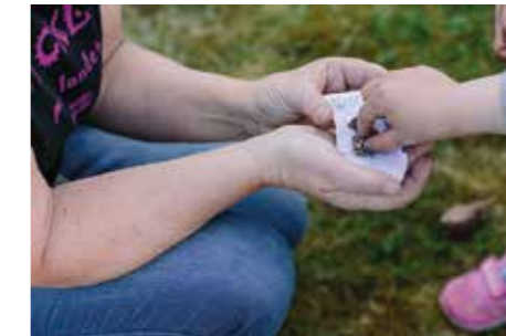
SOM FÖRR. Odlar och så egna frön.

”Det är viktigt att ha roligt när det är oroligt”