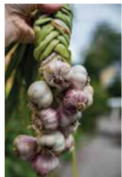
SJÄLVFÖRSÖRJANDE. – Bästa vitlökskördan får vi i Tillsammansodlingen.