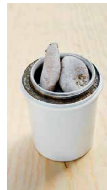
ETT DYGN. Låt betongen torka. Häll sen hett vatten utanpå hinken så lossnar betongen lättare.