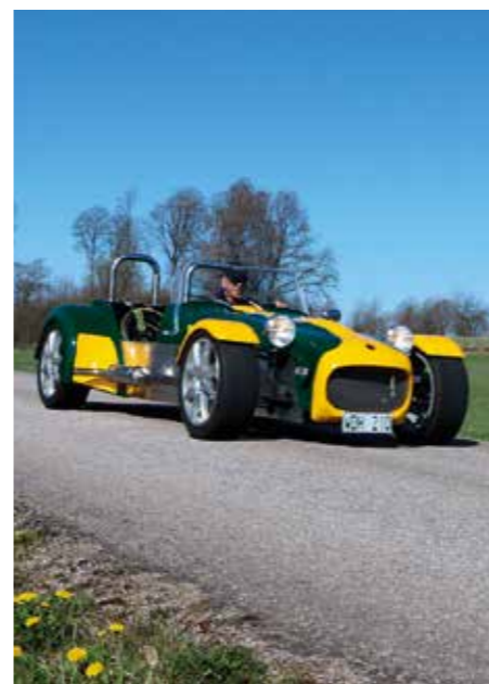
UPPLEVELSE. Det är på soliga småvägar som Tigern är i sitt rätta element. Då handlar det om körglädje för hela slanten.