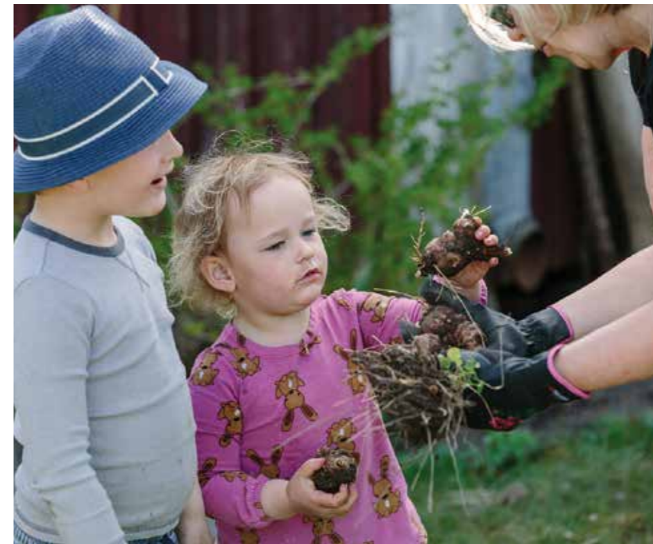
FUNGERAR. – Härmar gärna naturen. Odlar varannan rad lök varannan morot för att slippa morotsflugor. Det ska visst inte fungera enligt vetenskapen.