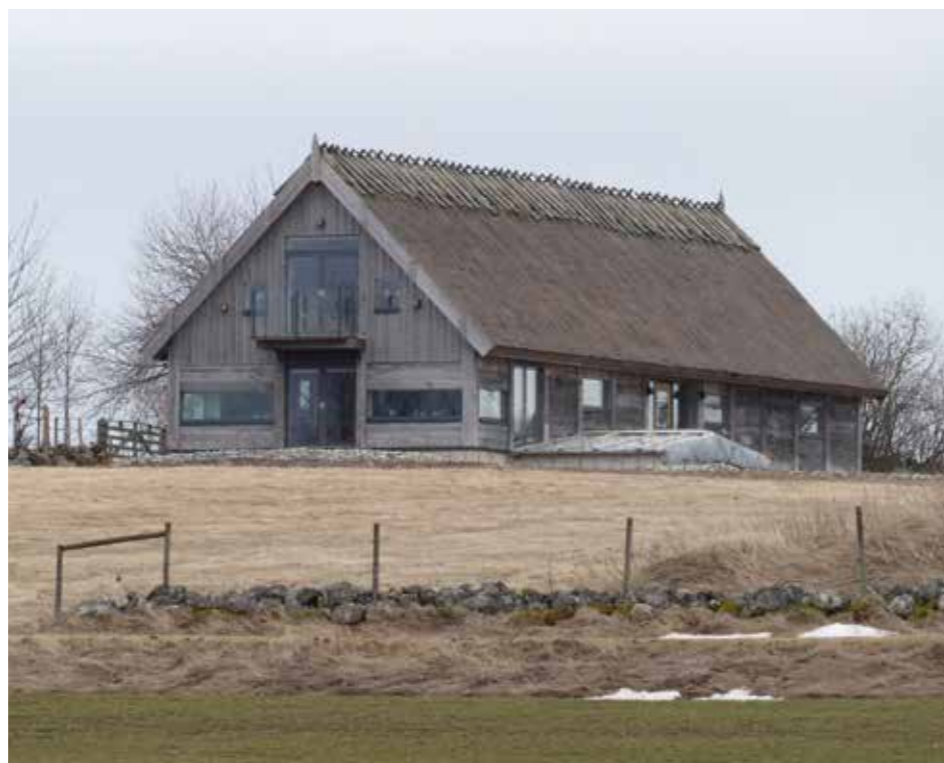
FÅRHUSET. Vindskivor och plankfasader består av obehandlad ek från Visingsö. Vasstaket är av traditionell typ och fanns förr på vart och vartannat hus i de här trakterna.

stämde oss för att slå till på direkten om vi hittade något.