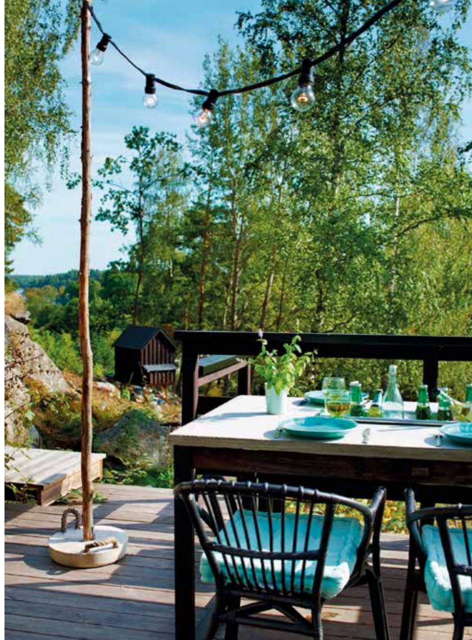
TILL UTESLINGAN. Handla hem en säck betong och börja gjuta. Inredningen utomhus blir extra fin med detaljer av betong i kombination med naturmaterial.