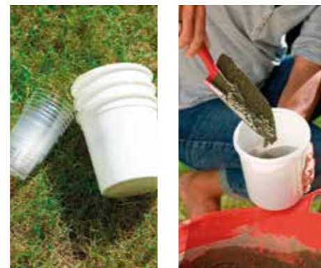
MATERIAL. Använd material som redan finns när du gjuter krukorna. Här yoghurtburkar och plastglas.