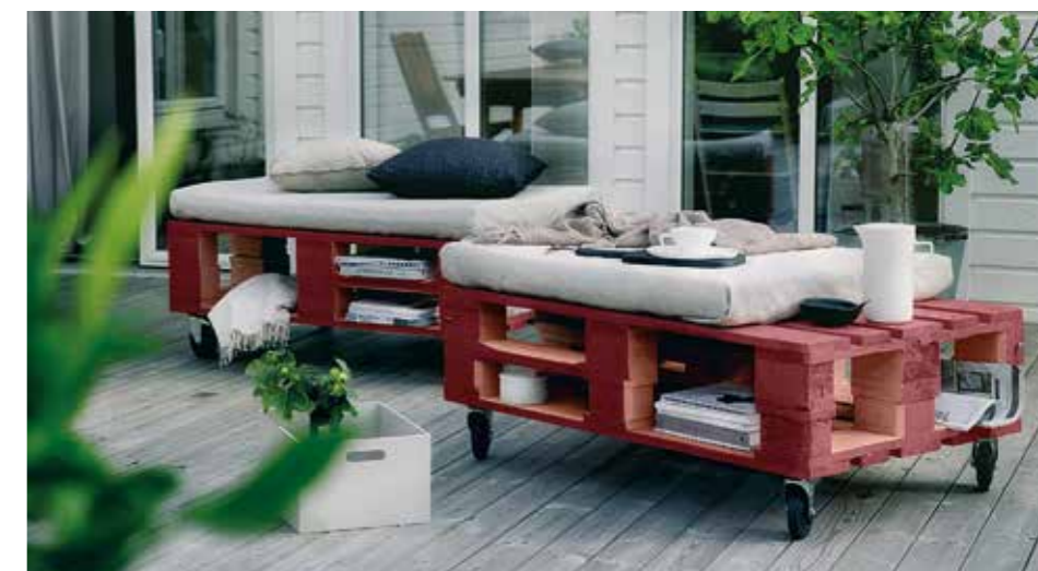
VÅRJOB. Dags att olja in altan och utemöbler.