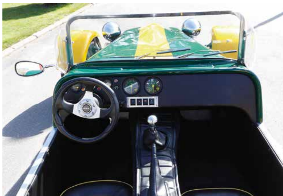
SPARMAKAD. Inredningen är mycket spartansk och det behövs nästan skohorn för att komma på plats. Enkelheten är en del av den här bilens speciella charm.