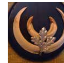
VILDSVINSMARKER. Bland jakttroféerna finns dessa vildsvinsbetar.