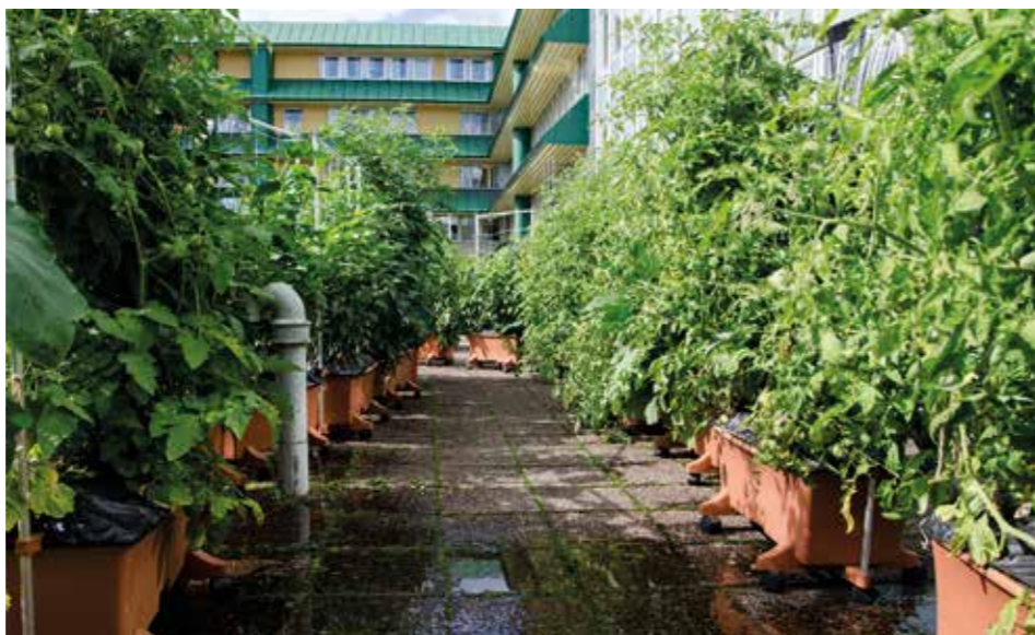
ODLINGSBART ÖVERALLT. Gräv där du står om du vill stadsodla på marken. Och använd odlingslådor om du får möjlighet att odla på tak eller terrass.

– Odla för smakerna. Kanske potatis till 2-3 kok eller för ett speciellt tillfälle. I en pallkrage. Eller gör ett kryddland. Men undvik tanken att odling utan närvaro funkar.