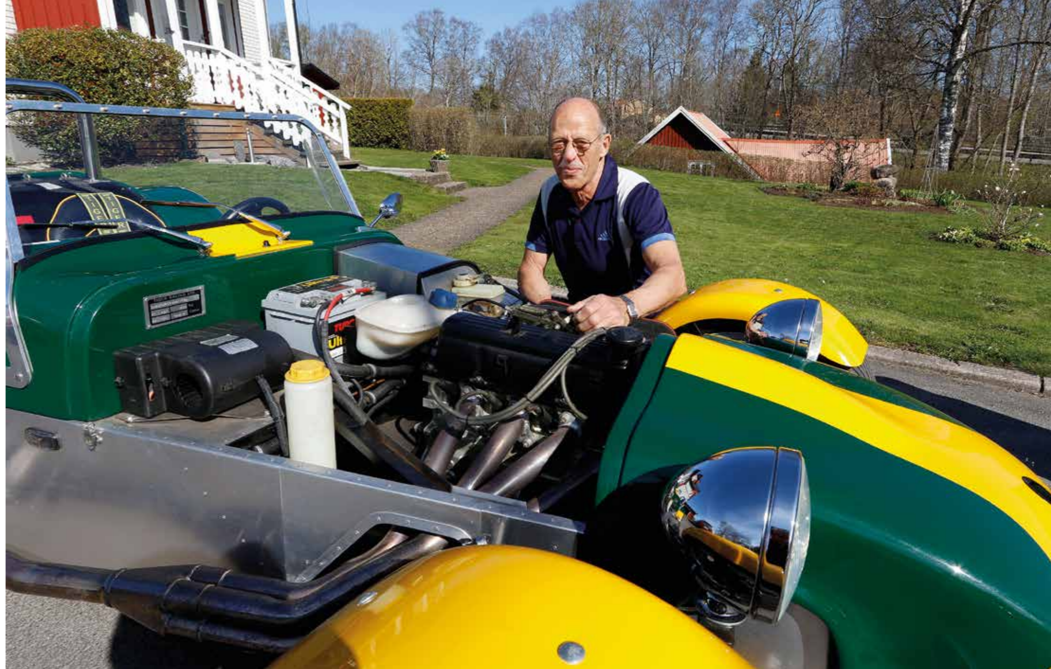
VASS. Tvålitersmotorn med dubbla Weberförgasare och