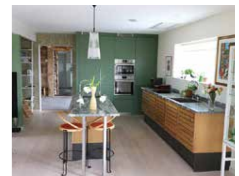
MED VÄRME. Köket toppmodern inrett med ombonat känsla. Bänkskivorna i granit är från Dala Sten.

■ Bostadsytan är 172 kvadratmeter och dessutom finns 50 kvadratmeter till som komplementyta.