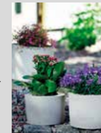
STILRENT. Med yoghurtburkar, plasthinkar och plastglas skapar du finaste utekrukorna.