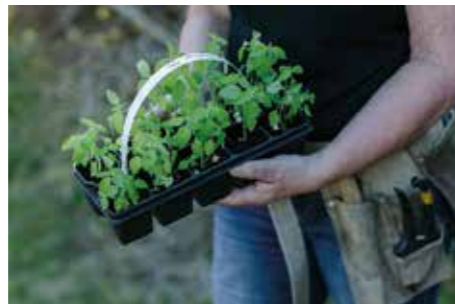
FRÖ. Några ettåringar får alltid gå upp i blom för att bli nästa års sådd.

TEXT Marie Pallhed | FOTO Maria Eberfors