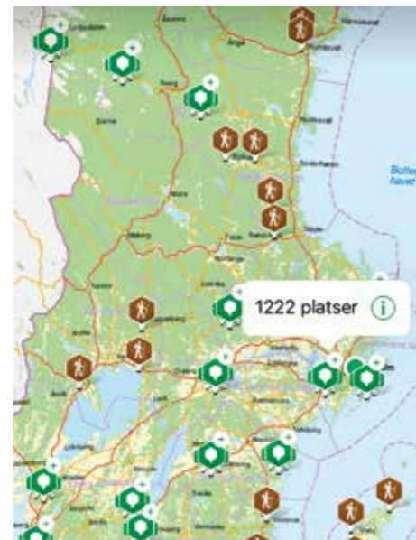
NATURKARTAN. Appen är en guide till Sveriges natur och friluftsliv.