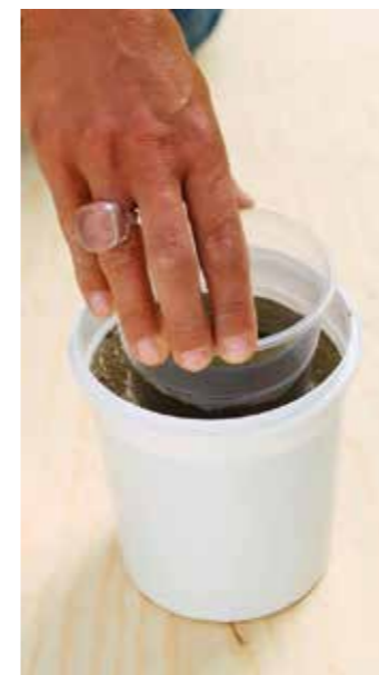
PLASTPLATS. Tryck ner glaset i betongen. Lägg i några tyngder så att det inte flyter upp.