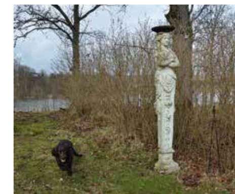
DET SPÖKAR. Vita frun står i trädgården, som sluttar ner mot sjön Mjörn. Hon är en kvarleva från gamla slottet, och var en av kolonnerna på utsidan. Det sägs att hon spökar och gäster kan höra henne gå runt på nätterna...