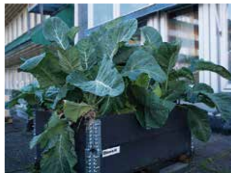
PÅ TAKET. Takterrassen är ett spännande stadsodlingsprojekt. – Förutsättningarna för odling här blir andra. Klimatet i detta skyddade läge är varmare.