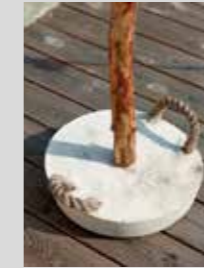
HÅLLARE. För att enkelt kunna lyfta ställningen lätt så gjuter man in rephandtag.