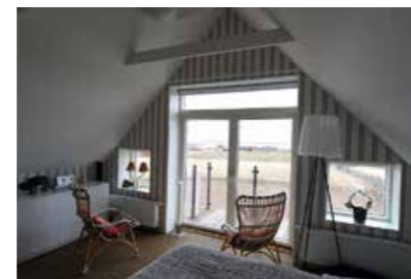
FRI SIKT. Utsikten från sovrummet är minst sagt magnifik. Glasricken på balkongen utanför maxar luftigheten.