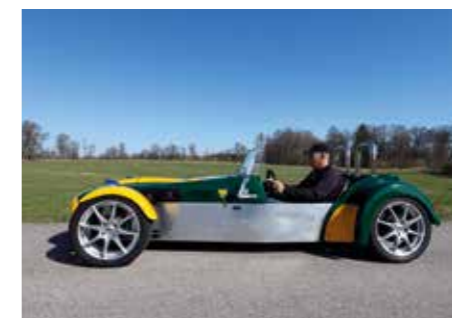
OTÅT. Denna vardag fanns det inget behov av tak i någon form och det är sådant här som bilen är byggd för. – Jag har funderat på att sy ett kapell till den, men den skulle nog bli ganska ful med ett sådant.