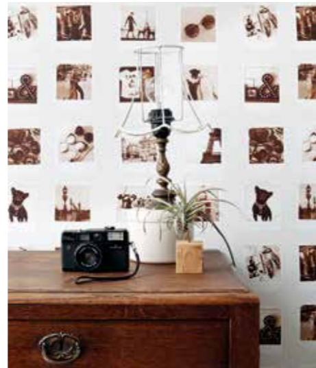
CHICA MOTIV. Retrokameror, spetsmönster och polaroidbilder på #FAB.

■ Tapetkollektionen #FAB fabulous är Midbeccs nya trendiga ungdomskollektion. Mönstren är inspirerade av modehuvudstaden Paris flärd och glamour. Chica motiv som retrokameror, spetsmönster, söta parfymflaskor och trendiga polaroidbilder med vintage-look syns på några av kollektionens tapetmönster. Färgpaletten är en mix av ljusa pasteller, färgstark cerise nyans, svart-vitt och skimrande koppar och guld detaljer. #FAB består av 15 olika mönster i flera olika färgställningar och 11 olika fototapeter. Tapeterna är Sätt Lätt-använd non woven lim och limma väggen. Kollektionen finns nu ute i butikerna.