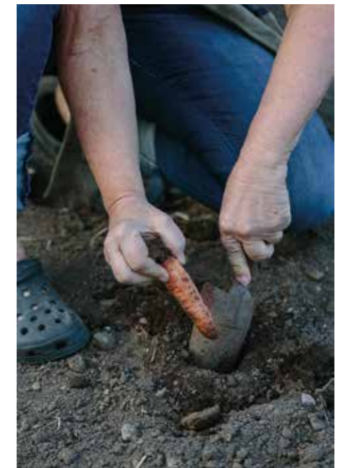
TESTAR GÄRNA. – Det borde gå att sätta ner en ekologisk köpe-morot i jorden för att få frön att så nästa år. Men den här har jag kvar sen förra året.