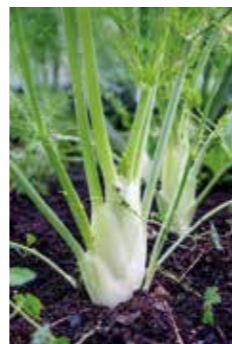
VARMT KLIMAT. – Chili, tomat och fänkål trivs extra bra på takfarmen.