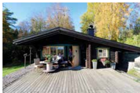
RYMLIGT. Huset smälter fint in i omgivningarna och att det är betydligt större under än ovan jord kan man inte ana utifrån.

Just det soliga läget var avgörande för flytten hit. Tidigare hade de en stor villa i Ulveket, Skövde. Men där kommer kvällarna tidigt när solen går ned bakom Billingens.