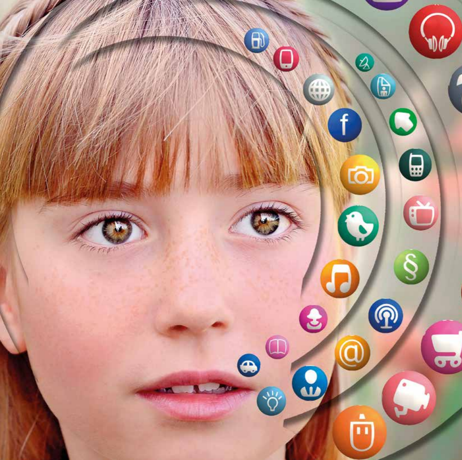
VUXENPLIKT. Skapa trygghet för ditt barns liv på nätet genom att bli medveten om vad de gör online.