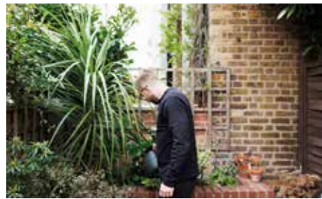
GRÖNT I STAN. Stadsodling kan se ut på många sätt. Och det blir ett allt vanligare inslag i stadsmiljön världen över. Men också inomhus odlar vi allt mer. Åtbart året runt. Eller växter bara till lyst.

T rädgårdstrenderna och inredningstrenderna tangerar varandra. Dessutom liknar trendsiarnas spaningar varandra vilket gör strömningarna mer trovärdiga. Att landet och leva naturen är något som kittlar fantasin är uppenbart. Tänk bara på Mandelmans. Charmen ligger i att leva närodlat. Svenska val av