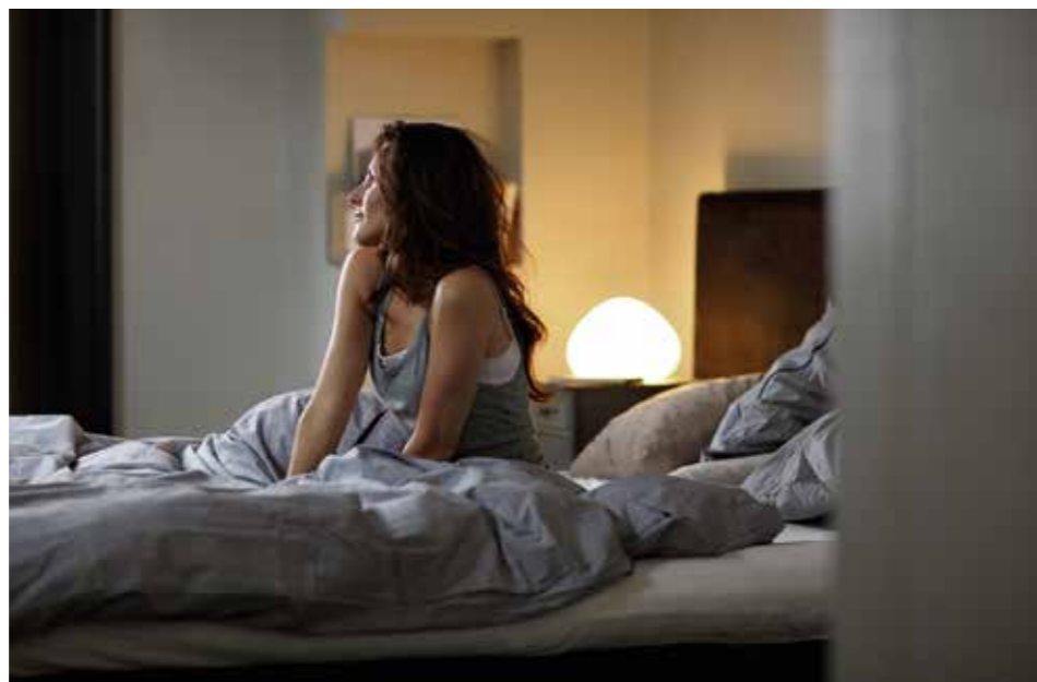
LJUSVAL. Tekniken kring Philips Hue sägs möjliggöra att du kan välja ljus. Välj energiljus när du ska träna och simulerat soluppgångsljus för att vakna.