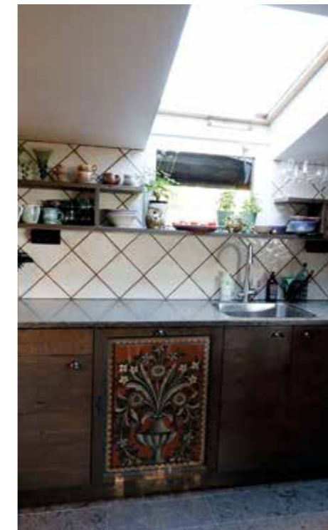
EGENSNICKRAT. Allt i köket är nytt - utom luckan till diskmaskinen som är hämtad från ett gammalt skåp från Dalarna.