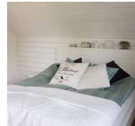
UTOMHUSPANEL. På sovrummets snedtak och fondvägg sitter det vitmålad ohyvlad panel. – Vi testar våra idéer. Blir det fel går det att rätta till. Och så har vi fått mycket hjälp från nära och kära.