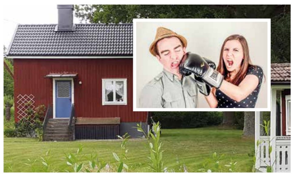
HÅLL SAMS. Ett avtal som reglerar hur husets ska skötas och disponeras underlättar när man är flera ägare.

M ed ett avtal om hur delägarna ska disponera huset kan hela släkten njuta av huset och föregripa ägarkonflikter. Som alltid gäller det att sträva efter samförstånd och smidiga lösningar för alla. Det är rätt vanligt att till exempel en syskonskara som tar över föräldrarnas hus inte skriver något avtal om huset. I så fall gäller samäganderättslagen. Men det skadar aldrig att ha ett avtal som skapar ordning i samägandet.