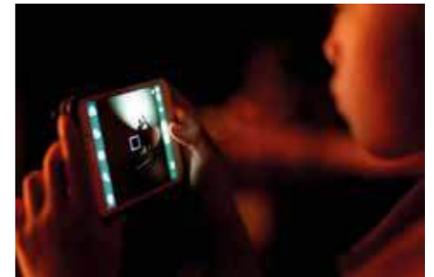
TYSTNAD. Barn berättar inte alltid vad som händer på internet. Samtal och närvaro kan ändra på det.