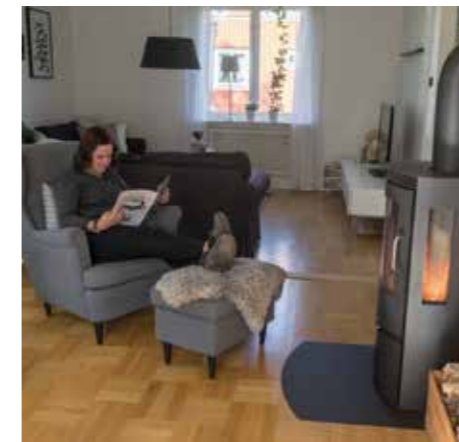
FÄRGSKALA. Nyanserna i vardagsrummet följer linjen med övrig inredning i huset. Svart, grått och vitt. – Kaminen installerade vi när vi bytte ut oljepannan mot bergvärme. Efter renovering av skorstenen.