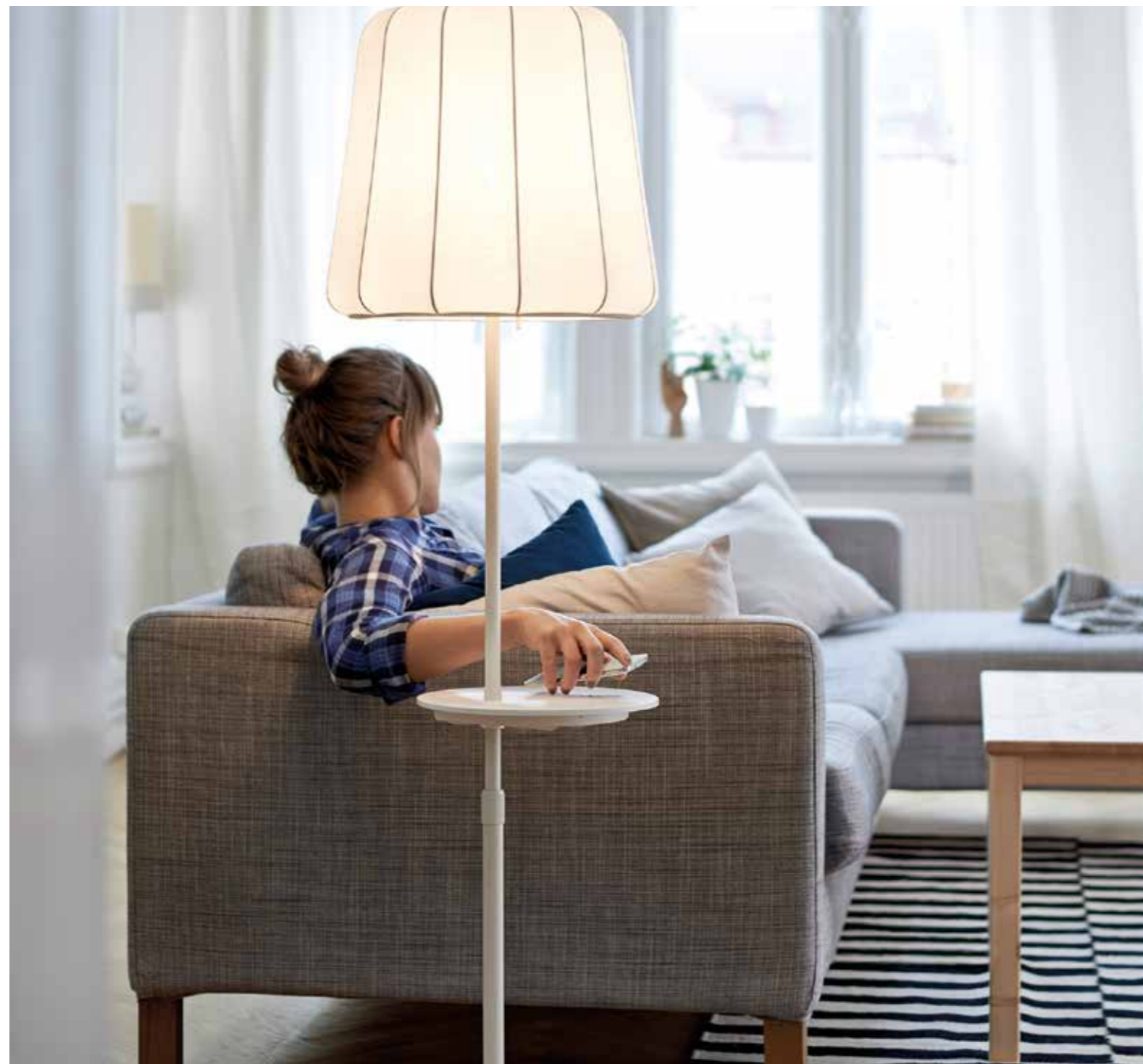
HEMMASMART. Numera kan du styra belysning och annat hemma med mobilen. Den laddar du trådlöst direkt på inredningen. Snart pratar du också med prylarna.

Uppmärksamma Allt fler komponenter styrs smart hemma: Belysning, termostater, dörrlås, sensorer, takfläktar, köksmaskiner, larm, markiser m m. Det kommer ständigt nya lanseringar för att du ska kunna hitta din lösning för ett smart hem. Med det kommer också fler kompatibla komponenter på marknaden. Men än så länge finns inte någon gemensam branschstandard. Alla produkter synkar alltså inte med varandra.