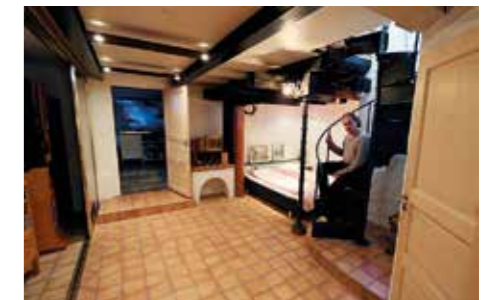
ÖVERRASKANDE. Källaren är större än huset ovan mark och där ryms tvättstuga, badrum, ett extra sovrum, källarutrymmen och snart även en musikstudio.