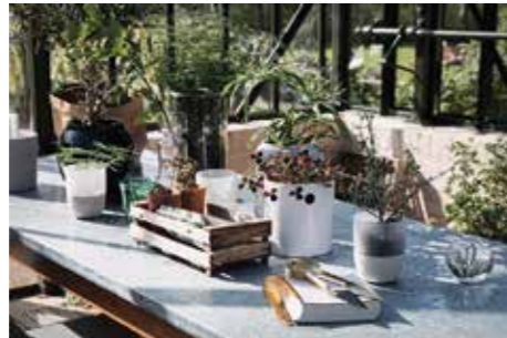
TRENDEDETALJ. Bord som känns utomhus med plats för god mat och goda vänner.

grönsaker och växter, hållbar livsstil, inredning i trädgården med naturmaterial som trä, sten och keramik är faktorer som sätter trenden. Oavsett hur du bor. Och den viktigaste möbelen i utomhuskänslan 2018 är det stora matbordet.