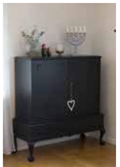
TOKKÄR. – Skänken i teak hittade jag på Blocket. Föll för den direkt och målade den svart. Men den var jättetung att transportera och få på plats.