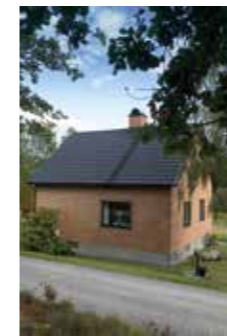
1956. Tegelhus med svart tak och svarta fönster är inte så vanligt. – Beslutet kändes pirrigt men vi gillar husets nya utseende. Vi har skyndat långsamt och renoverat efter vad plånboken erbjudit.