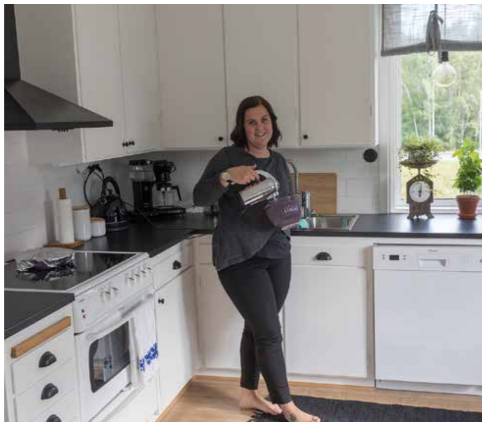
BUDGETRENOVERAT. – Jag är jättenöjd med köket som vi rustat utan att byta allt. Kaklade själv för första gången. Det gick bra. Bokhyllan byggde vi i utrymmet som blev över när vi installerat diskmaskin.

I budgettänket ingår också att bevara så