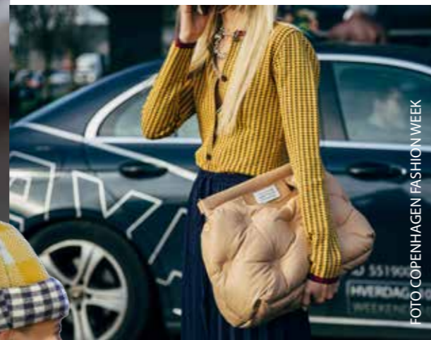
FOTO COPENHAGEN FASHION WEEK

Regnkappan är superhet och den ska helst vara transparent med mönster. Denna ingår i Italienska Anteprimas vårkollektion.