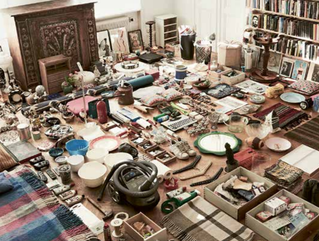
HELENACITAT. "När golvet är fyllt ger det intrycket av en arkeologisk utgrävning, tycks det mig. En iscensättning av en tänkbar framtida situation. Kanske till och med en dystopisk scenografi".