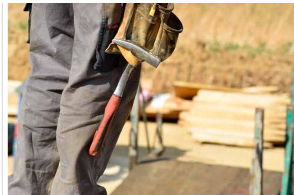
KLARSPRÅK. De flesta tvisterna med hantverkare uppkommer då parterna pratat förbi varandra. Undvik det genom att skriva avtal.

Ett nystartat företag kan vara lika bra som ett med mångårig verksamhet. Men det kan finnas en ekonomisk instabilitet innan företaget blivit väletablerat och byggt upp verksamheten. Tänk på att i handelsbolag, kommanditbolag och enskild firma är ägarna personligen ansvariga för företagets skulder. Kontrollera eventuella skulder i företaget hos Kronofogden. Hos Skatteverket kontrollerar du att företaget är registrerat för F-skatt och är momsregistrerat. Är företagets deklarationer och momsredovisning i sin ordning? Har arbetsgivaravgifter betalats?