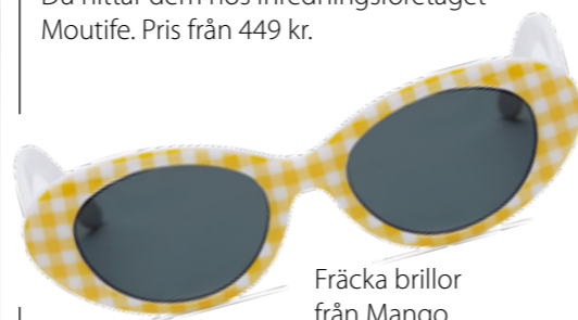
Fräcka briller från Mango.

Kvalitativ fotokonst till överkomliga priser, i begränsade och limiterade upplagor. Du hittar dem hos Inredningsföretaget Moutife. Pris från 449 kr.