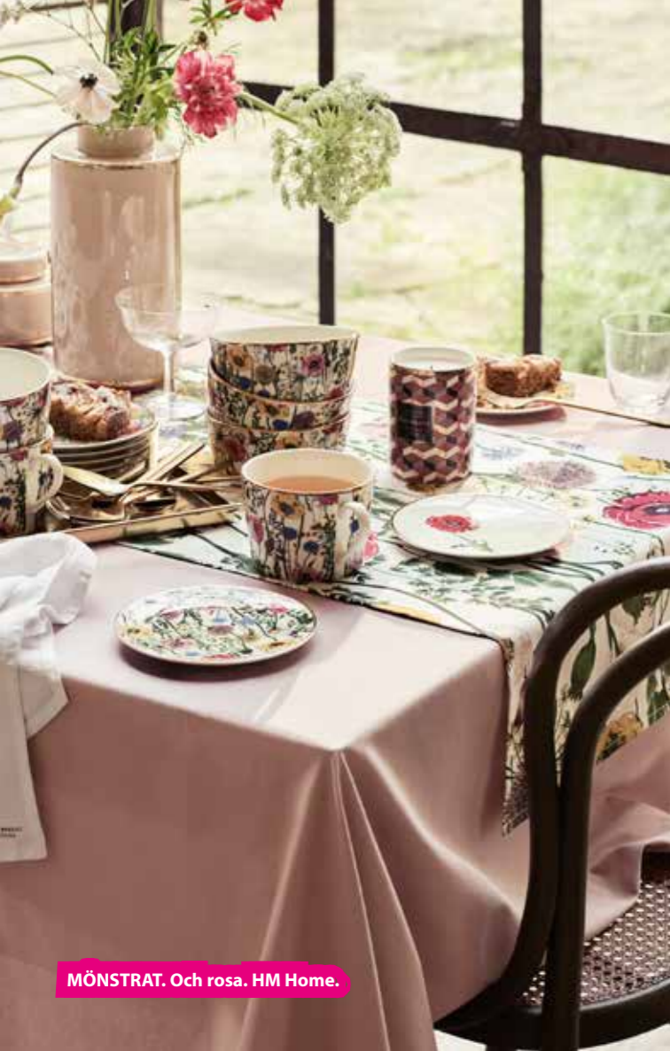
MÖNSTRAT. Och rosa. HM Home.