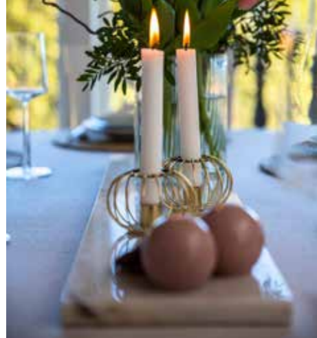
LITE HÅLLBART. Marmorskivan på matbordet är en förtäring som blev över efter badrumsrenoveringen. – Vi återanvände en del när vi renoverade. I köket lackerade vi om luckorna och fixade lådorna.