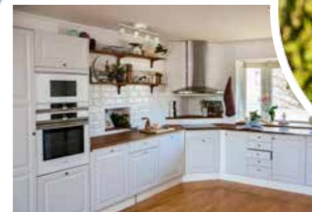
<< GILLAR. – Matlagning. I helgen var grannarna här och vi gjorde hemmagjord pasta. Medan barnen sprang runt.