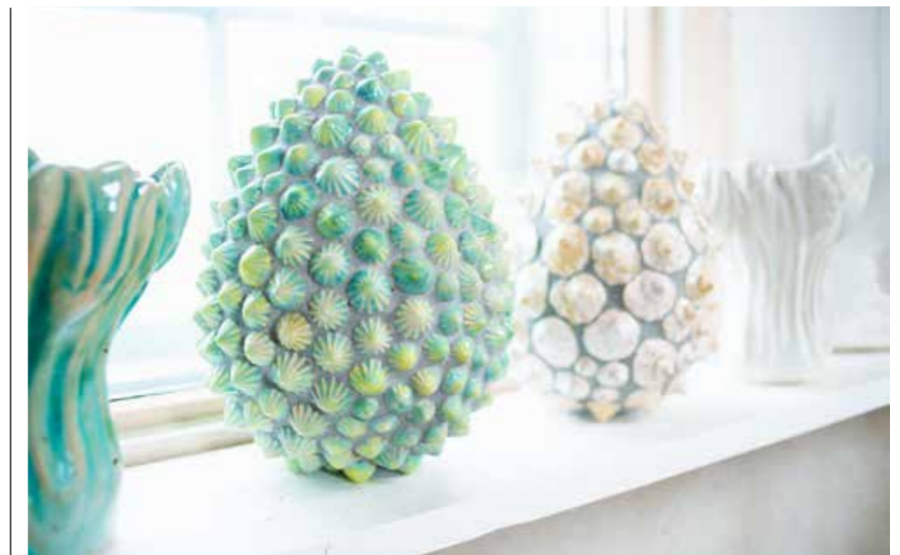
SKULPTURELLT. Är det stora gröna havsabborrar eller något annat? Beträktaren får bestämma.

– Jag har en spännande roll i skolan och känner att jag har något viktigt att förmedla.