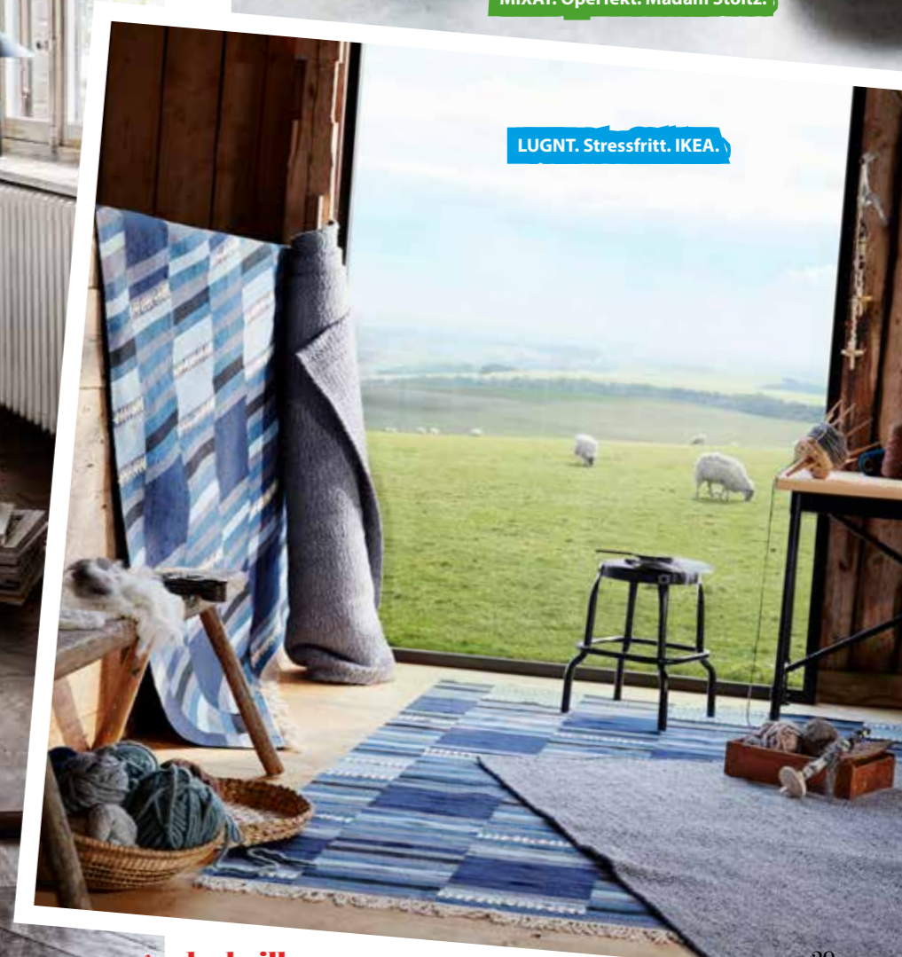
LUGNT. Stressfritt. IKEA.