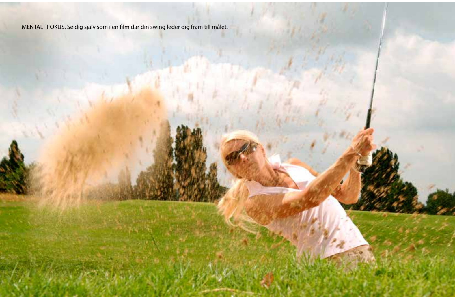
MENTALT FOKUS. Se dig själv som i en film där din swing leder dig fram till målet.