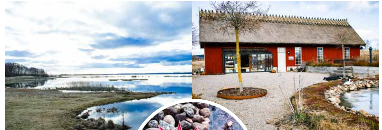
NATUREN. Med en bedövande utsikt över sjön som granne, ligger Annas verkstad som ett rött smycke.