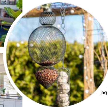
IBLAND. – Är inredningsintresserad och hann lite mer när jag var föräldraledig och hemma. Nu när jag jobbar heltid räcker inte riktigt tiden till.