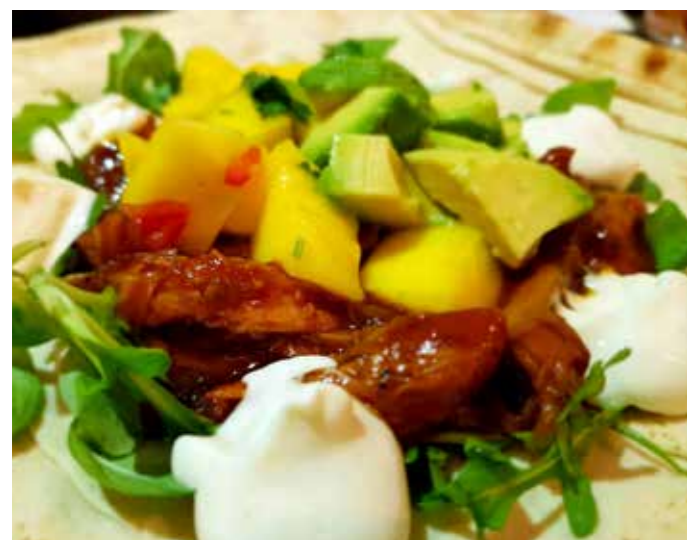
BORTGLÖMT. Med ökad efterfrågan på hönskött kan matsvinnet minska.

på egen hand. Resultatet visade att den andra personen i förhållandet – den som inte aktivt försökte – också gick ner i vikt. Källa: Viktväktarna.