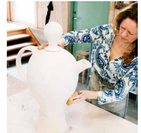
ALICE I UNDERLANDET. Denna gigantiska kannan ska få följa med på utställning till Dalarna i sommar.