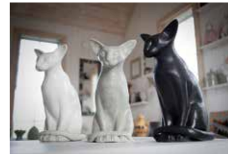
BOLUMS ARISTOCATS. Tre siamesiska katter i naturlig storlek håller ett vaksamt öga över sin omgivning.