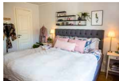
HANTVERKARE. – Vi testar att renovera det mesta själva. Men inte badrum så för tre år sedan fick vi hjälp att kakla om båda badrummen. Ett av badrummen ligger smart placerat i anslutning till tvättstuga och vårt sovrum.