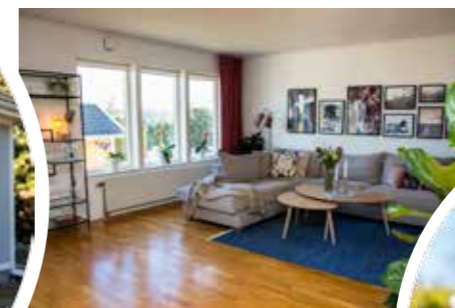
<< INSPIRERAD. – Jag ser många hem i mitt jobb och jag gillar inredning. Grått, vitt och blått är färger jag trivs i. Gärna med textilier i varma röda och rosa toner. Men jag hinner inte hålla på så mycket numera.