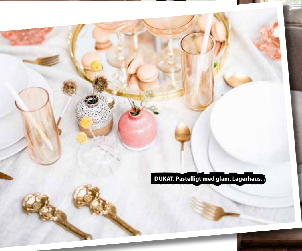
DUKAT. Pastelligt med glam. Lagerhaus.