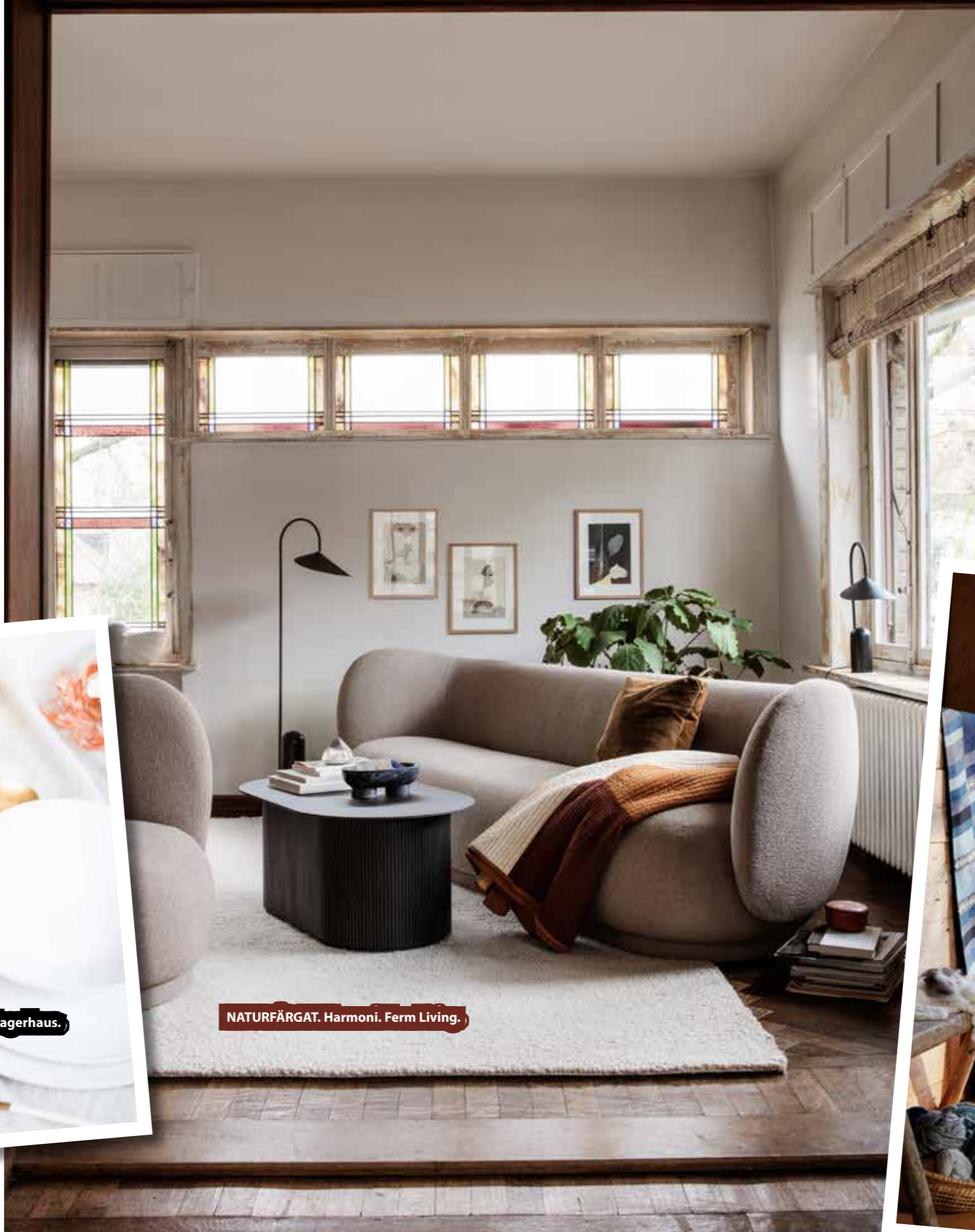
NATURFÄRGAT. Harmoni. Ferm Living.

Miljöer att inspireras av som följer säsongens inredningstrender.