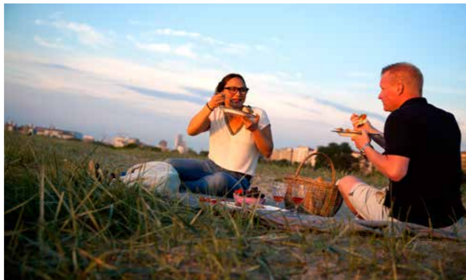
I PAR. Viktminskning för båda trots att bara den ena aktivt försöker.

■ Har din partner nyligen påbörjat en resa mot en hälsosammare livsstil? Det kan mycket möjligt leda till att även dina vanor påverkas positivt. En klinisk studie genomförd på uppdrag av internationella WW visar nämligen att viktminskning "smittar" av sig mellan par som bor tillsammans.