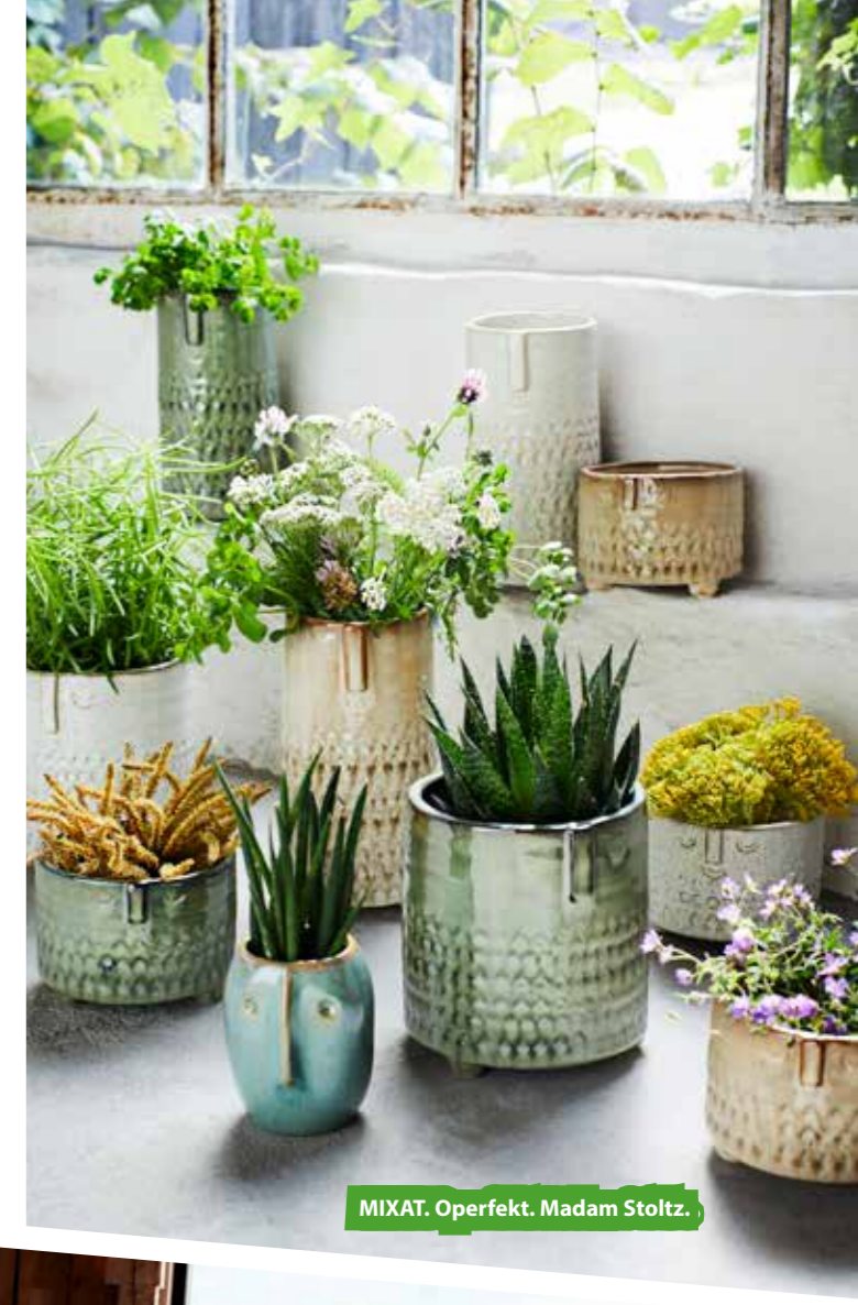
MIXAT. Operfekt. Madam Stoltz.