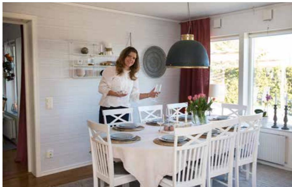
35 KVADRATMETER. Vardagsrummet är stort och det är där familjen hänger. Matsalsbordet är stort med plats för 10-12 personer. Och det är bra för vi gillar att umgås över mat med släkt och goda vänner.