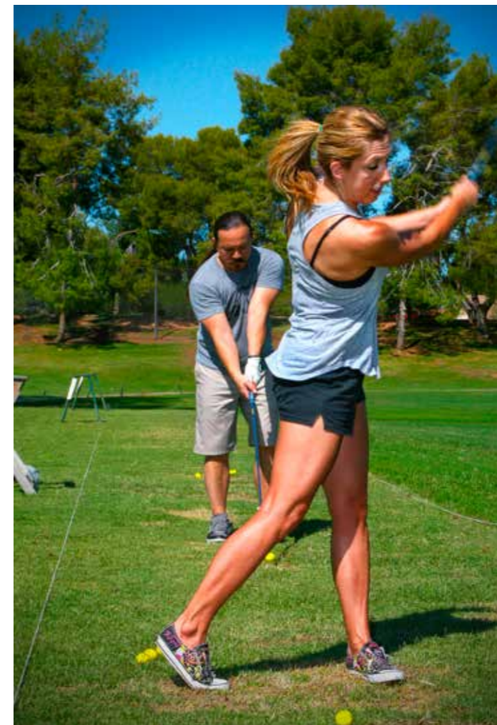
SYSTEMATISKT. Träna mentalt också på rangen.

– Kroppen registrerar den segervissa känslan och så småningom kommer du att kunna använda kombinationen för att utlösa reaktionen redan före ett slag, exempelvis strax innan du genomför en sving.