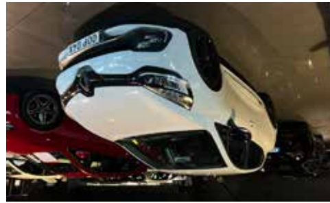
Renault Clio RS 220 Trophy Akrapovic 260 Hk se mer på www.hrmbl.se