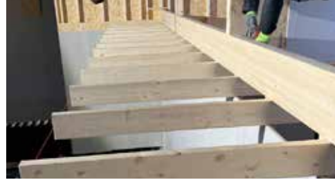
Väggar och tak för kontor byggs av Lids Bygg i December. Snickerier klart.