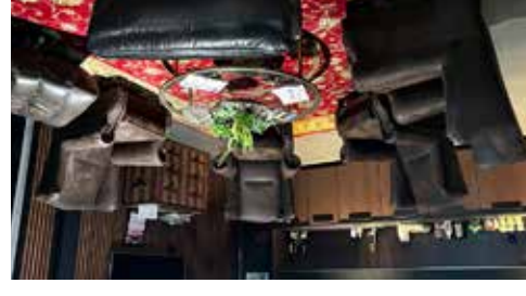
Kund lounge med möbler från EM Möbler. Klart för att ta emot kunder i Mars 2023.