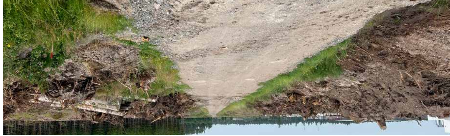
Det startade med en grusväg och en stubb åker O vad har man gett sig in på, vi är redan 3-4 månader försenade på grund av kriget i Ukraina. Men man har väl varit med om värre, vi bestämde oss att köra igång bygget i Juni 2022.