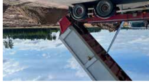
Här kommer grus och massor från Grusfix AB Juni 2022.