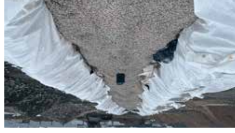
Vatten magasin anläggs för att ta hand om allt regnvatten.