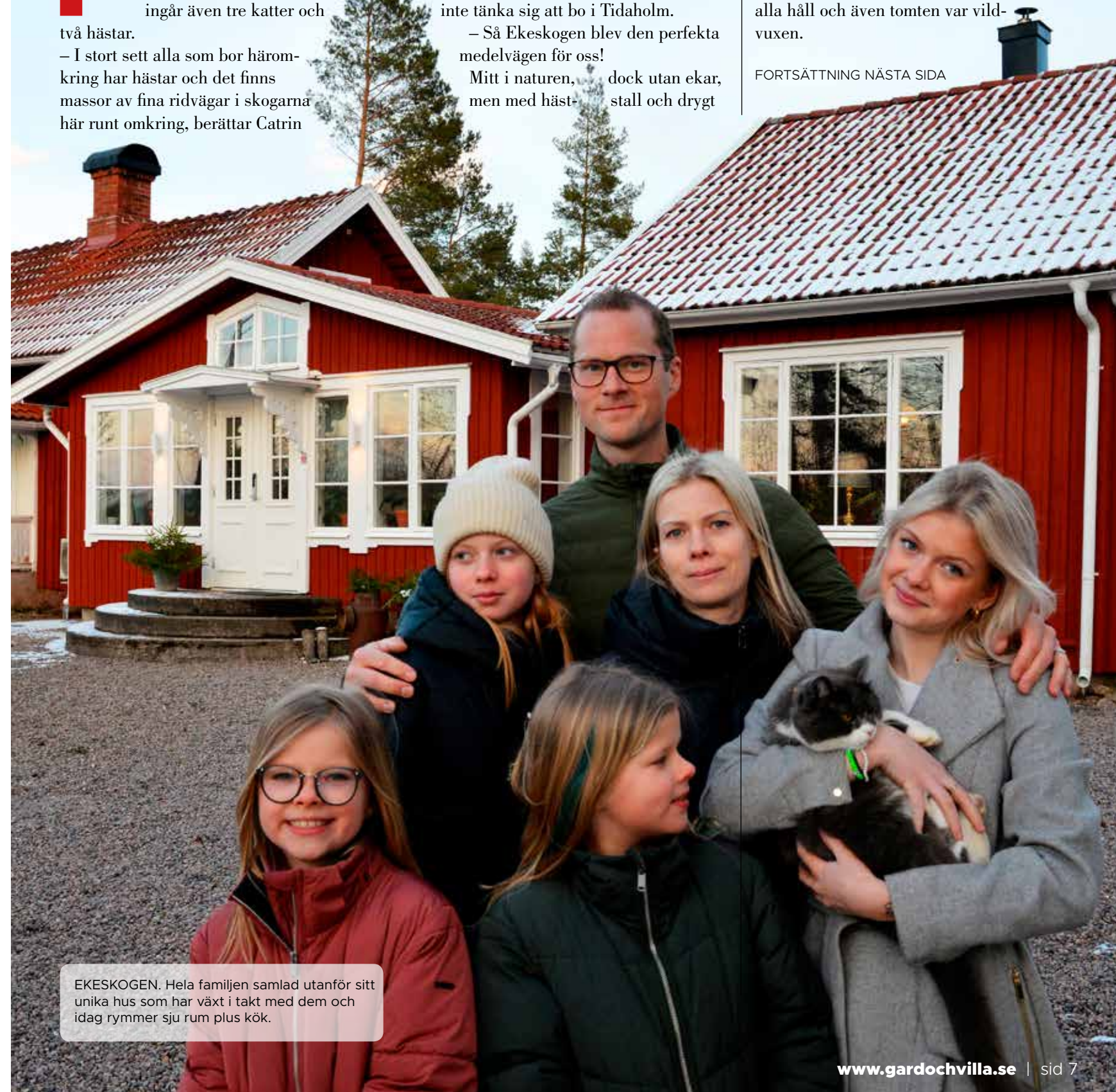
EKESKOGEN. Hela familjen samlad utanför sitt unika hus som har växt i takt med dem och idag rymmer sju rum plus kök.