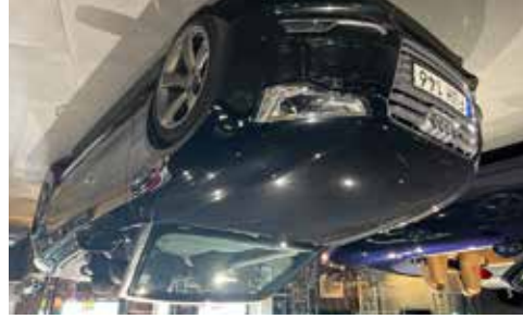
Audi S5 Quattro 3,0 V6 333HK 11700 mil, läder/alcantara, se mer på www.hrmbl.se