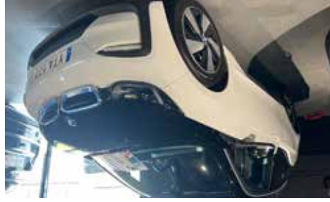
BMW i3 94 Ah Comfort 170hk 4800 mil, sommar och vinterhjul, se mer på www.hrmbl.se