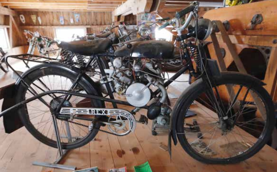
Rex från 1936 var speciell med sin separata treväxlade låda. Men framförallt känd för sitt mycket speciella avgasrör som stack ut som ett spröt i bak.

och starta. Ambitionen är att alla ska vara körbara framöver. Vi får se hur det blir med det.