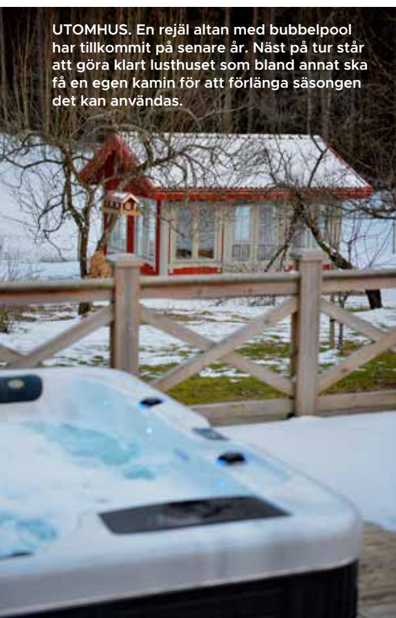
UTOMHUS. En rejäl altan med bubbelpool har tillkommit på senare år. Näst på tur står att göra klart lusthuset som bland annat ska få en egen kamin för att förlänga säsongen det kan användas.