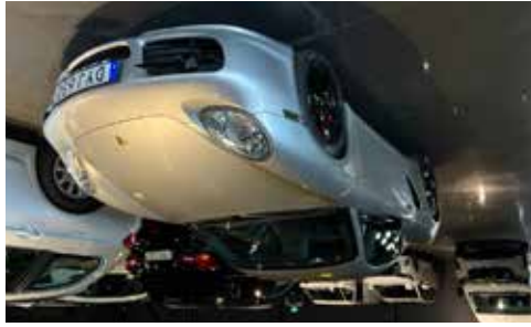
Porsche Cayman S 296 hk Nyservad, manuell läda, 9900 mil, se mer på www.hrmbl.se