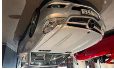
Mercedes 350 sl 2009 facelift Superfin SL med bara 7900 mil, AMG, se mer på www.hrmbl.se