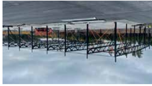
Stålstommen klar i slutet på Oktober. Och NCC har lagt asfalt.