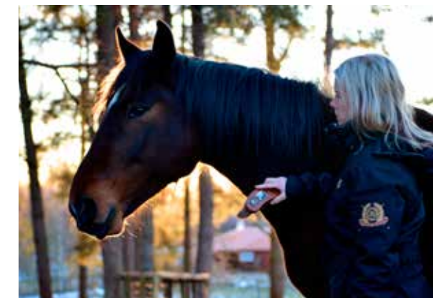
HÄSTFOLK. Två egna hästar hör till de boende här såklart. Trakten är ju ett hästparadis.