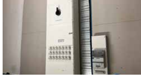
Reinestedts el drar all el till maskiner, värmepump och belysning. El klar Februari 2023.