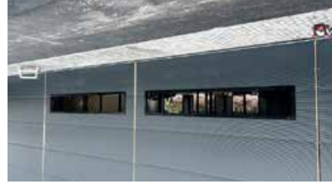
Fönster, dörrar och portar från Prido monterar. Tätt hus December 2022.