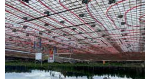
Armering av bottenplatta klar utom Klomater av golvvärme-slang monterad av Assemblin.