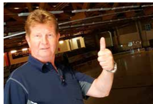
Uno Hufvudsson Gård & Villa.