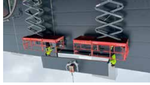
Lyftar från Renta används vid monteringen av sista panelerna.