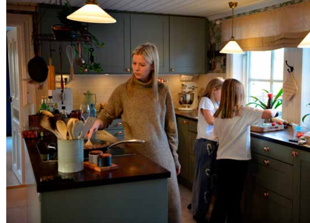
HEMMAKOCKAR. Ungefär där köksön med induktionshäll är placerad idag gick den gamla ytterväggen på 1700-talshuset. Förstoringen här hörde till den första omgången utbyggnad.