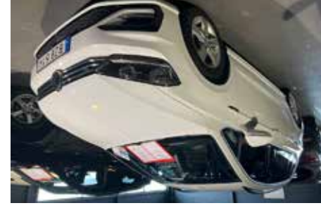
VW Golf Sportsvan 1.4 TSI R-Line Värmare, sommar och vinterhjul, 8500 mil, se mer på www.hrmbl.se