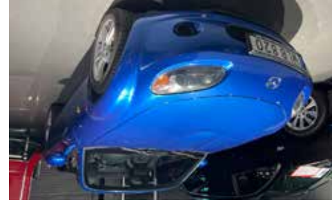
Mazda MX-5 1.8 MZR 126HK En kul sommar cab till ett lågt pris, se mer på www.hrmbl.se