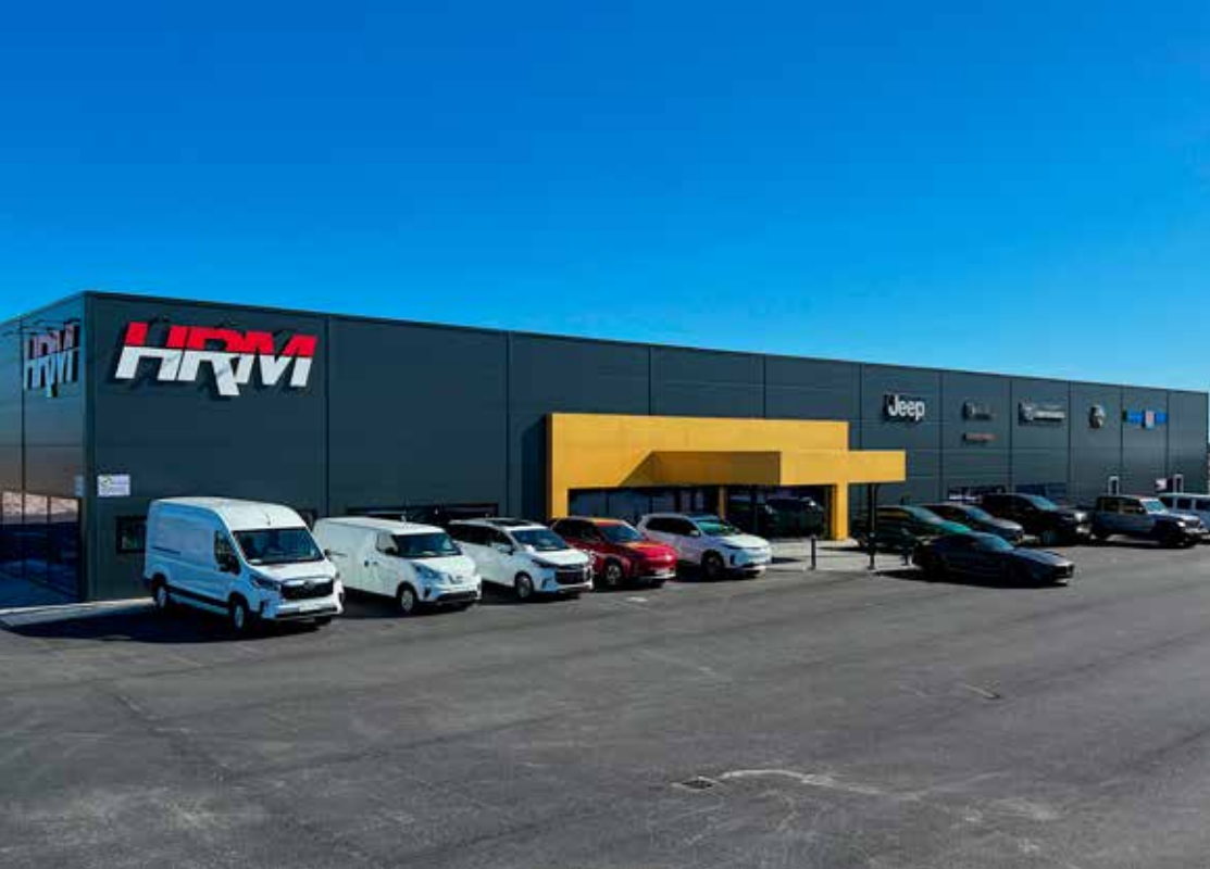
MÄSSDAGS. Gård & Villa-mässan Bygg och Fix äger rum i och utanför HRM Bil på nya Kartåsen i Lidköping. Öppettider fredag 21 april kl 12-17 och lördag 22 april kl 10-14. Fri entré.