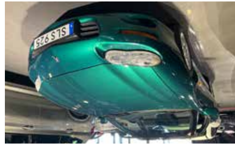
Camaro z28 1st, 320 hk Manuell läda och bara 5000 mil, se mer på www.hrmbl.se