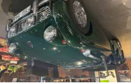
Triumph TR3 1956 En mycket fin TR3, krom ekerfälg, se mer på www.hrmbl.se