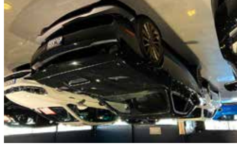
Dodge challenger hellcat Vossen 22 tums fälgar, 717 hk 7000 mil, se mer på www.hrmbl.se