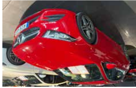
Mercedes-Benz A 200 aut AMG 163 hk, 5300 mil, se mer på www.hrmbl.se