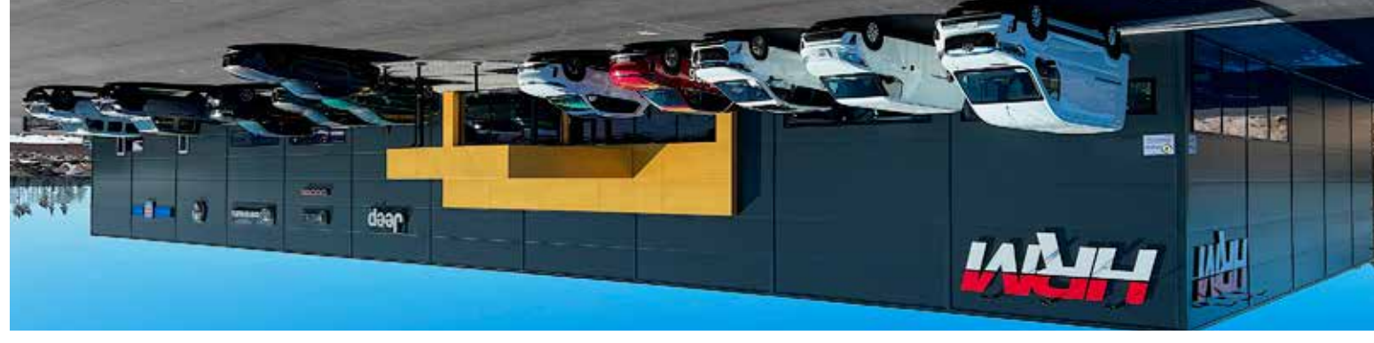
Den 1:e Mars får vi öppna lokalerna för våra kunder och vi är klara till 98% med bygget. Invi gnings helg blir när solen skiner 5-6-7 Maj 2023. Då blir det stort kalas på HRM Bill AB