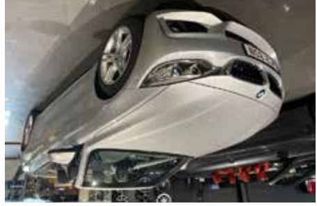
BMW 420 Cabriolet M-Sport 4700 mil, svart skin M-Sport, se mer på www.hrmbl.se