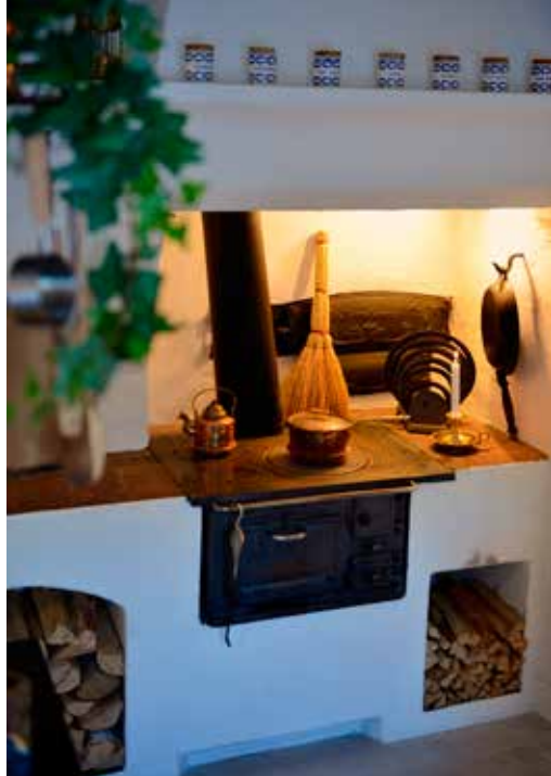
BEVARAT. Den gamla vedspisen är lika vacker som funktionell.

Köket blev ett eget projekt. Där det gamla torpets yttervägg tidigare funnits står nu en köksö. Hela köket hade förstörats av tidigare ägare, men inredningen var 70-tal. Där blev valet nytt och modernt.