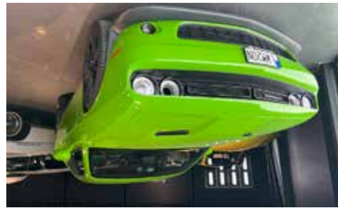
Dodge Challenger 6,4 486 hk Vossen 22 tum en bil i riktigt fint skick se mer på www.hrmbl.se