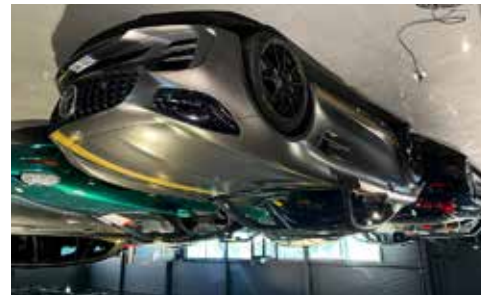
Mercedes GT-R 2018 585 hk Trackpack, koffiber paket bara 1100 mil, se mer på www.hrmbl.se