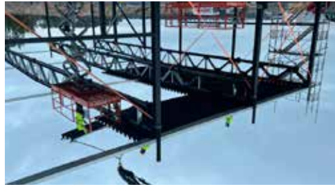
Oktober och Borja plåt börjar bygga stålstommen.