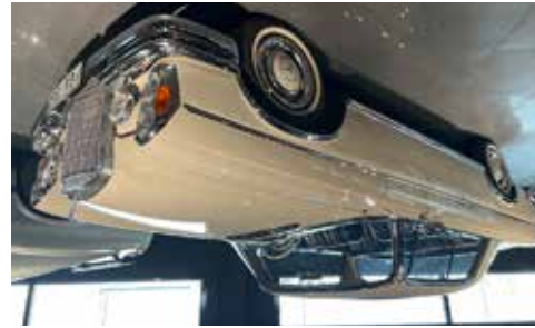
Mercedes 300 se coupe 1968 En otroligt fin bil måste ses, se mer på www.hrmbl.se