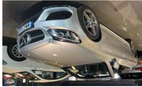
Mercedes c 250 amg cab 2017 4900 mil, svart skin, Navigation, se mer på www.hrmbl.se