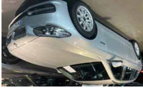
Alfa Romeo giulia veloce 2022 14500 mil, dragkrok, sommar och vinterhjul, se mer på www.hrmbl.se