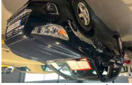
Mitsubishi 4WD 150HK Automat 2015, Diesel, Automat, 1 ägare, se mer på www.hrmbl.se