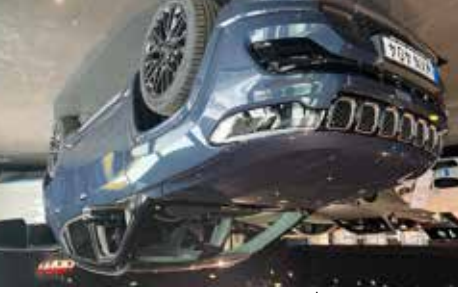
Jeep S Compass PHEV 1.3 AT Nya Jeep Compass, se mer på www.hrmbl.se