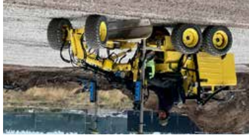
Justering av hårdgjorda ytor med en GPS styrd hyvel. Nu är det Augusti 2022.