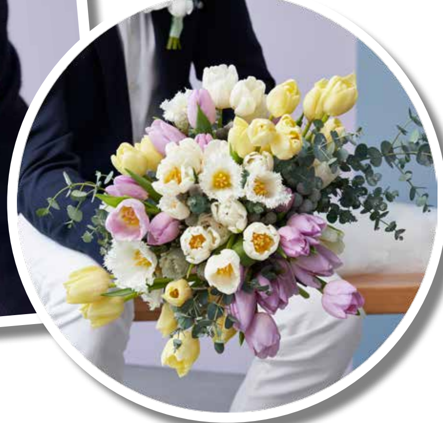
LÖST BUNDEN. Lösare bindning ger buketten ett busigare och luftigare intryck.