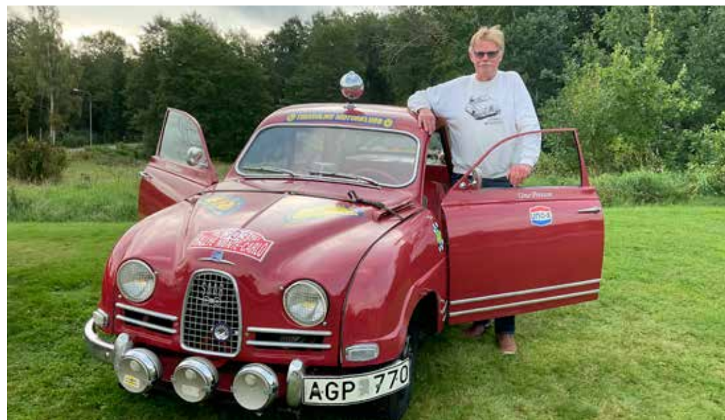
LJUDET. Rally-Saabens tvåtaktsmotor har ett eget ljud. Den brukade kallas Djungeltrumman när det begav sig, så grannarna har inga problem att konstatera när Uno ger sig ut med bilen.