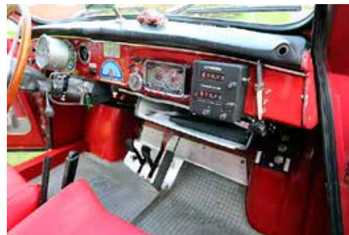
RALLYMEKANIK. En färddator är standard idag, men redan innan datorns intåg fanns mekaniska varianter. Givetvis är en äkta rally-Saab utrustad med en sådan!