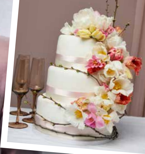
SÅ KLART. Tulpaner också som dekoration på bröllopstårtan.