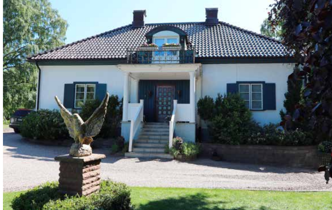
NYRAPPAD. Den gamla disponentvillan är sig lik - med ny rappning på fasaden visserligen, men det glaserade tegeltaket är sannolikt original.