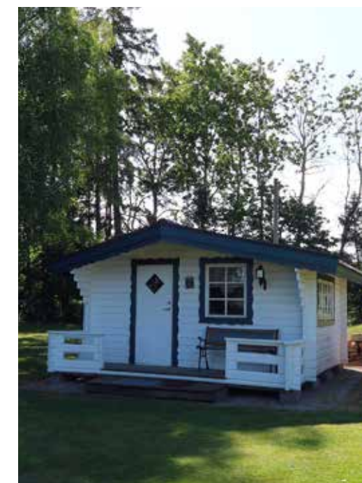
FESTLOKAL. Lite udda är att gäststugan i parken egentligen bara används en gång om året: – Där har vi våra surströmmingsfester!

alla fönster med isolerglaskassetter på insidan, men de handblåsta glasen i ytterfönstren bevarades.