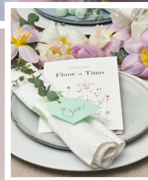
<< PÅ BORDET. Dukningen matchar självklart brudbukettens blommor och nyanser.