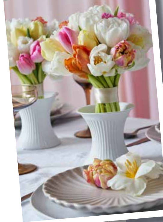
ROSA BRÖLLOP. Pastelliga nyanser i rosa, vitt och gult.