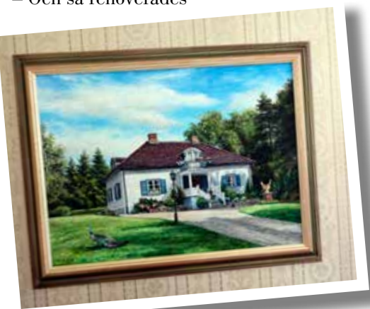
FRÅN FÖRR. En schweizisk konstnär porträtterade huset får många år sedan - och allt är sig likt än idag.

PAVILJONGEN. Här spenderas mycket tid större delen av året. Luftvärmepumpen fixar behaglig temperatur oavsett om det är varmt eller kallt ute.