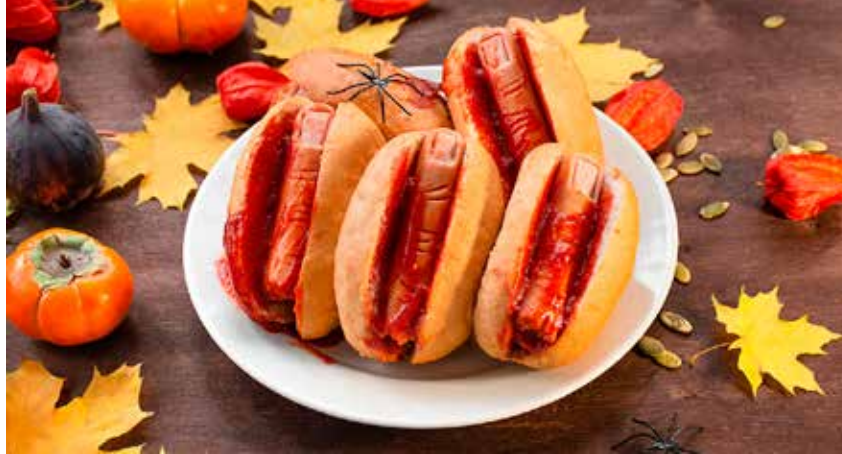
KORVFINGRAR. Läskiga och vrålgoda!