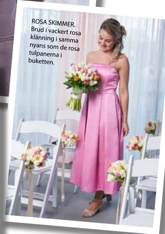
ROSA SKIMMER. Brud i vackert rosa klänning i samma nyanser som de rosa tulpanerna i buketten.