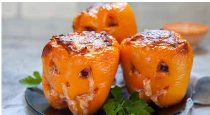
PUMPAPAPRIKOR. Hjälp, vad gott!