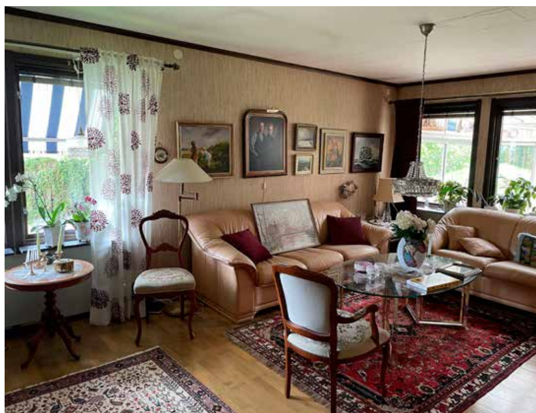
FÖR MÅNGA. "Finrummet" används inte längre så ofta, men det står redo vid behov.

för varje år. Lika mycket uppmärksamhet väcker idag parets andra bil - en tvåtakts rally-Saab av 1964 års modell. Sedan är det fullt i garaget, så "finbilen" en Saab Sport av 1965 års modell står uppstallad på annan plats.