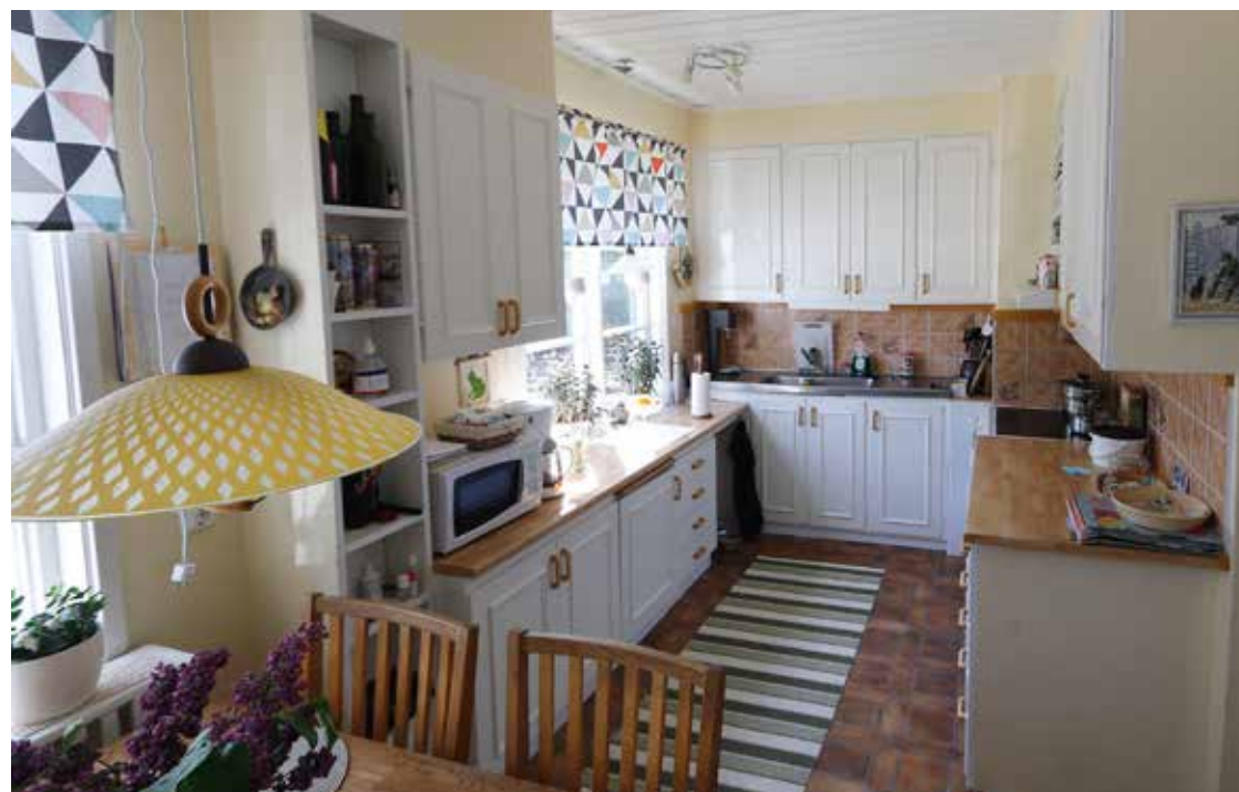
KÖKET. Vitvarorna är förstås utbytta med åren, men själva köket har fått behålla sin ursprungliga prägel.