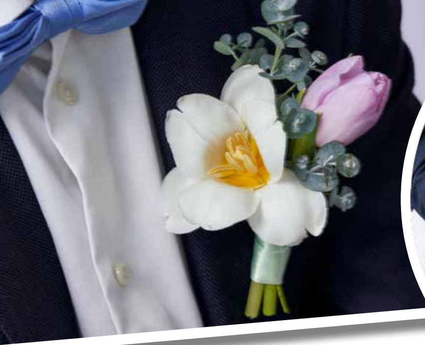
MINIBUKETT. De vita kronbladen har försiktigt vikts ut för ett lätt överblommat uttryck.