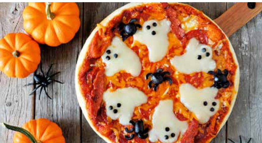
SPÖKPIZZA. Busenkel att göra, voilå!