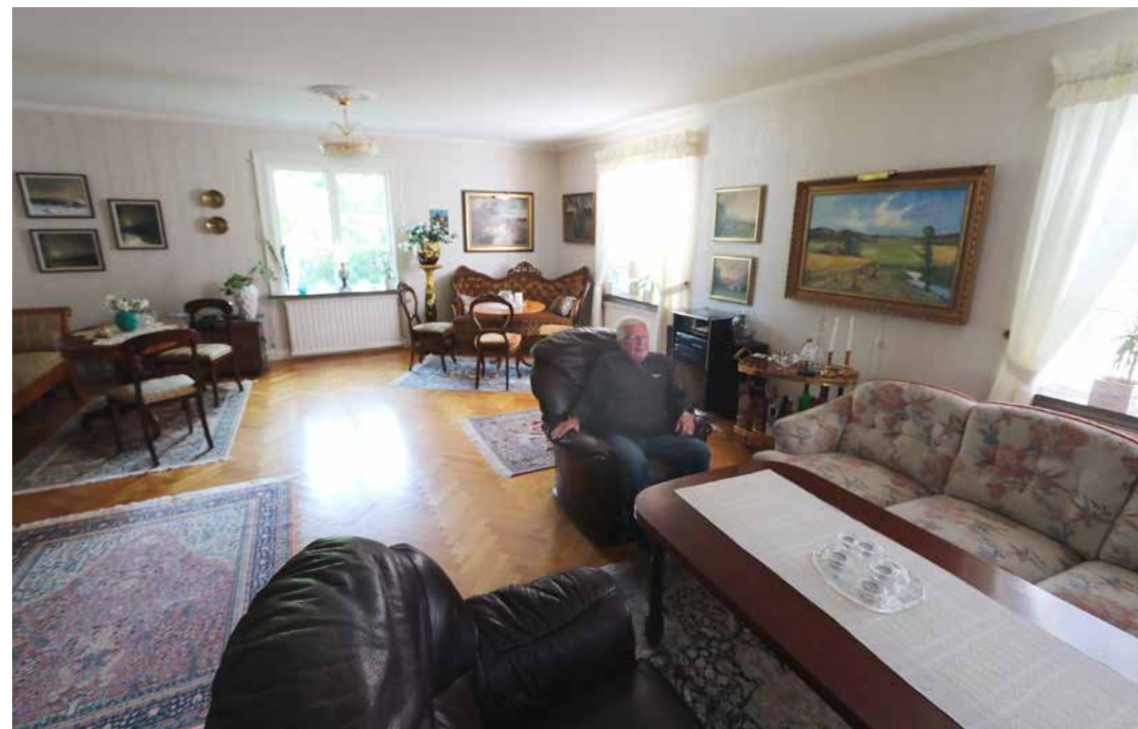
RYMLIGT. Vardagsrummet är jättelikt. Det gällde ju för disponenten på Katrinefors Bruk att kunna representera, även om gästerna blev många.

PAVILJONGEN. Här spenderas mycket tid större delen av året. Luftvärmepumpen fixar behaglig temperatur oavsett om det är varmt eller kallt ute.