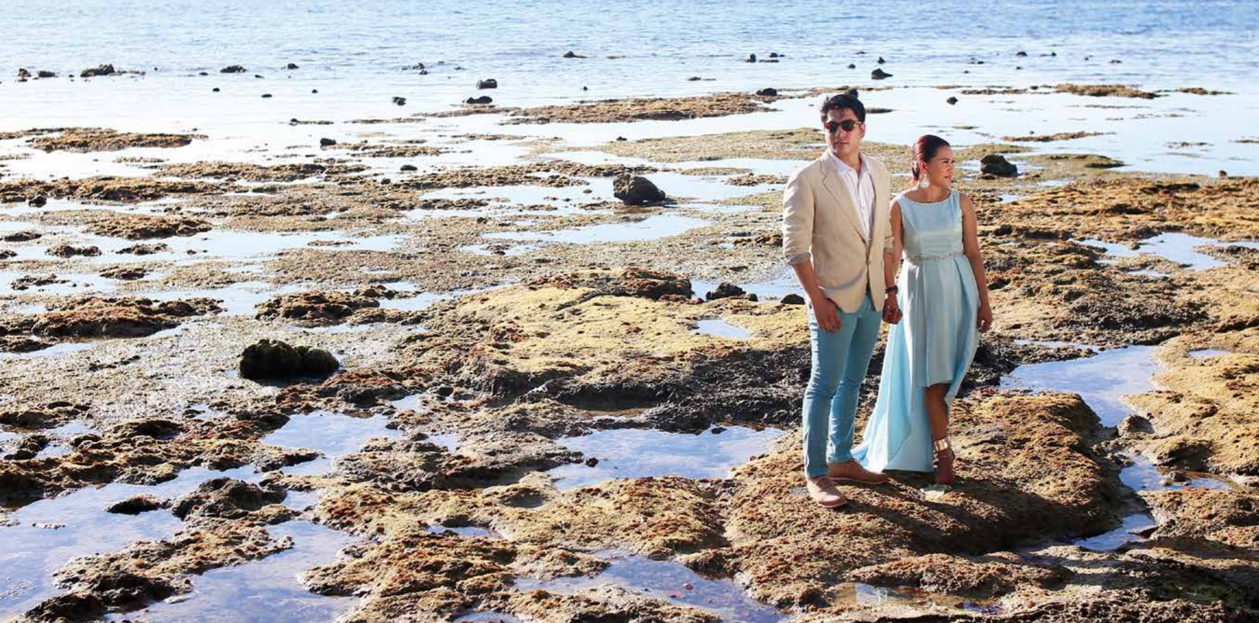
VÅGA. Ingen mår bra av eviga gräl. Stäm av förhållandet regelbundet för att undvika dåligt grälmönster.