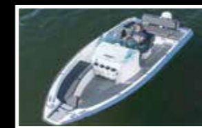
Sting 530 S

Båtar motorer tillbehör, Auktoriserad verkstad