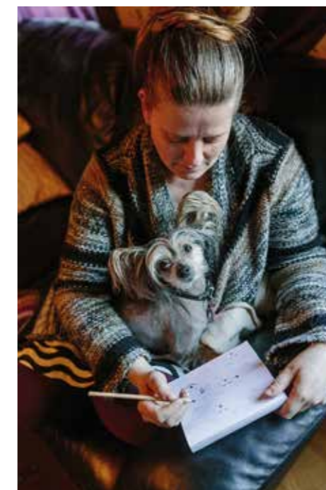
MIN BORG. – Hemma kopplar jag av i soffan med brasan tänd. Spelar ett spel på mobilen, stickar raggsockor eller målar med färger i en målarbok för vuxna.

– På köksbordet ligger tången vi nyss använt tillsammans med dagens post, magnetkulor och en fruktskål. Precis som vi vill ha det.