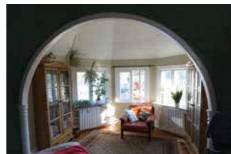
VACKER VY. En härlig syn att vakna till. Sovrummet ansluter direkt till hörntornet och har en fin utsikt över sjön och Göta Kanals inlopp.