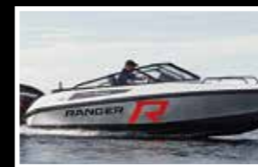
Nordkapp 605 Avant Ranger