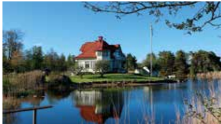
KÄR GÅVA. Precis vid infarten till Göta Kanal i Forsvik ligger den här mycket speciella villan. Den byggdes som morgongåva till en rysk oljemagnats fru.

- Tydligt fick ritningen ytterligare spridning, för det finns en likadan till i Ockelbo