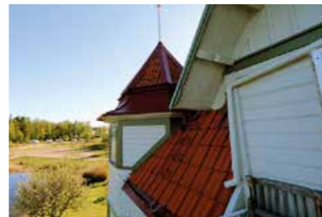
ARBETAT. Plåtslageriet fick en utmaning vid bygget, för konstruktionen är rena pusslet. Den speciella fiskfjällpanelen har hållit sig frisk i alla år.