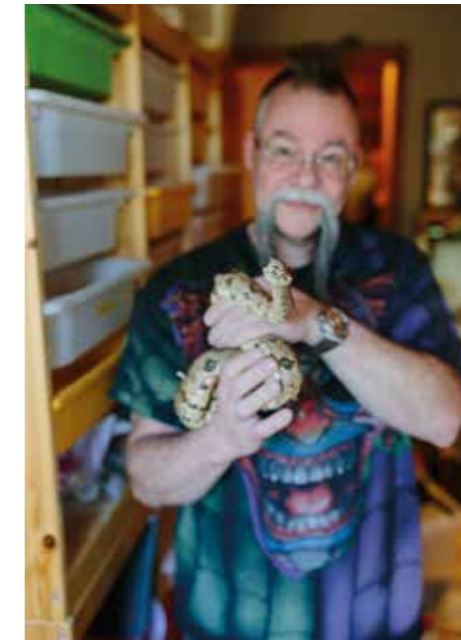
PÄLSDJURALLERGISK. – Reptiler är intressanta. Och de påverkar inte min allergi. Som hundarna gör.