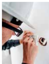
REGISTRERAD. Alla som utför eljobb på annans anläggning ska finnas med.

Elsäkerhetsverket. Nu gäller det att också konsumenterna använder möjligheten att kolla elföretagen. De nya reglerna omfattar krav på hur arbetet utförs, krav på kompetens, krav på egenkontrollprogram samt registrering hos Elsäkerhetsverket.