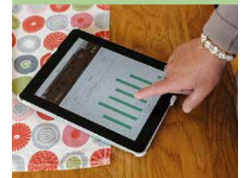
SJUNKANDE PRIS. Priset på solcellssystem har minskat och idag kan en solcellsanläggning för ett villatak vara en god investering också i Sverige.

"Sverige har lika stor solinstrålning på sommaren som länderna runt Medelhavet har"