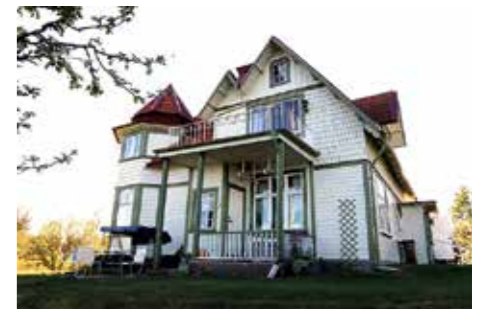
UTMANING. Ritningarna till huset var komplicerade, men lockande. Så byggmästaren byggde ett likadant åt sig själv i Töreboda. Två till finns i Sverige.