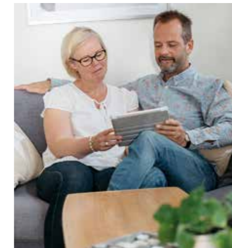
ÖVER FÖRVÄNTAN. – Solpaneler är ett sätt för oss att kunna påverka miljön och se ett resultat av. Sol-el är också en investering som ger pengar tillbaka.