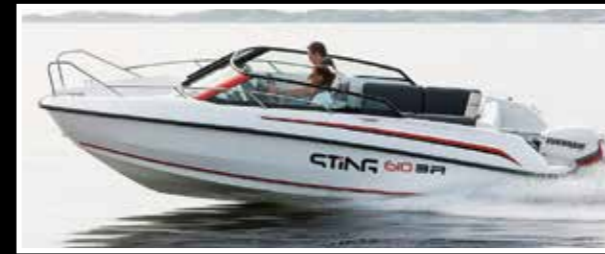
Sting 610 BR