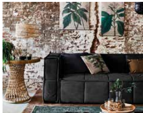
HÖSTTREND. Saker du blir kär i skapar din stil. I ny eller återbrukad inredning. Utöver det syns bland annat nyanser som dovt grått, blått och grönt, inbjudande textilier, naturmaterial och gröna växter.

Ytterligare trendspaning visar att flera varumärken satsar på dova nyanser av blått, grönt och grått. Hos H&M Home gäller färgerna grått, vitt och svart med senap som accentfärg. Medan man hos House Doctor ser en hel del blått mot grått. Och hos Ellos Home är favoriten dovt grön. Detaljer i svart, mörkt trä eller läder är