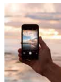
UTOMLANDS. 8 av 10 anser att deras sociala liv på semestern ändrats.

■ De slojade roamingavgifterna inom EU för alla svenska mobilkunder underlättar och förenklar utlandsvistelsen för många. En undersökning bland svenskar som haft fri roaming under drygt 1 år visar att 94 procent anser att det har påverkat kvaliteten på semestern. Nästan varannan person uppger känna sig mer avkopplad med vetskapen om att alltid kunna vara uppkopplad. Sex av tio svarar att de nu har mer kontakt med sina nära. Endast 3 % känner sig mer stressade av att alltid vara uppkopplade. Drygt 4 % anser att uppkopplingen gjort det svårare att få kvalitetstid med medresenärerna. Källa Telenor.