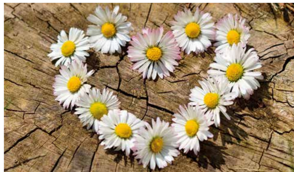
TÄNK EFTER. Handlar konflikten om det som är viktigt mellan er? Kan ni lösa det och komma ur grälet?

de inte kunde säga någonting utan att det blev en konflikt av det. Det var inga allvarliga frågor men de hade fastnat. Grälet hade blivit en livsstil.