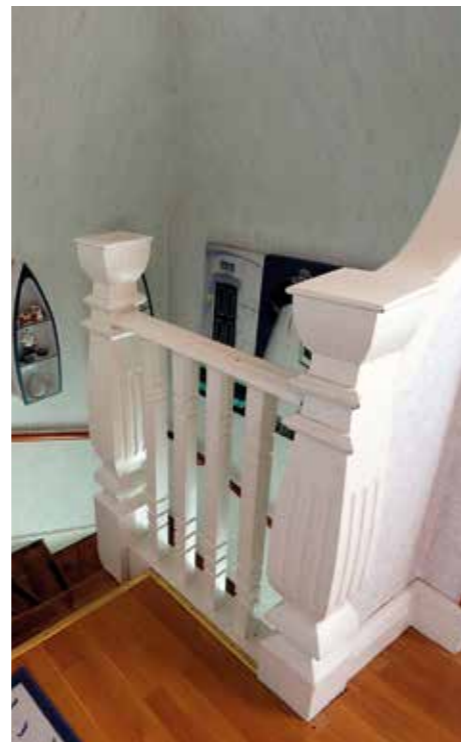
DETALJARBETEN. Det sparades inte på kvalitet när "Rysshuset" byggdes. Så har det också stått intakt i över 100 år.