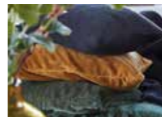
GEMENSKAP. Inbjudande inredning i materialvalen. Gärna med botaniska inslag.

närvarande. I IB Laursens höstkollektion syns den svarta skärbrådan och den trendar troligen hos fler varumärken framöver. I övrigt fokuserar IB Laursens kollektion på naturliga toner med inslag av trädetaljer och växter vilket de inte är ensamma om i höst. Jordnära, inbjudande färger och en större satsning på personliga detaljer märks också tydligt hos HK Living.