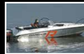
Nordkapp 605 Ranger