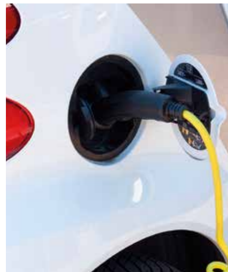
SÖKBART. Det finns ekonomiskt stöd för att installera laddstationer.

Hon menar att det är viktigt med ömsesidig respekt och förståelse. – Har din granne småbarn? Då kanske du får räkna med lite gråt och dunsar på dagtid.