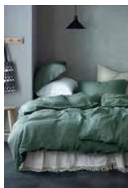
DÄMPADE FÄRGER. Sommarens gröna och blå övergår i mer dova nyanser nu när hösten kommer. Ute som inne. En mix av stilar är hösttend nu när hjärtat väljer mer än trenderna. i färg, form och material.