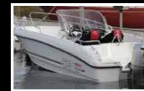
Micore 570 CC