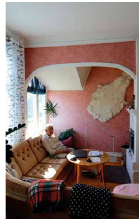
MYSALKOV. Sedan den gamla vedpannan plockats bort blev den här alkoven ett nytt rum - Här sitter jag ofta och myser framför den öppna brasan, berättar Sture.