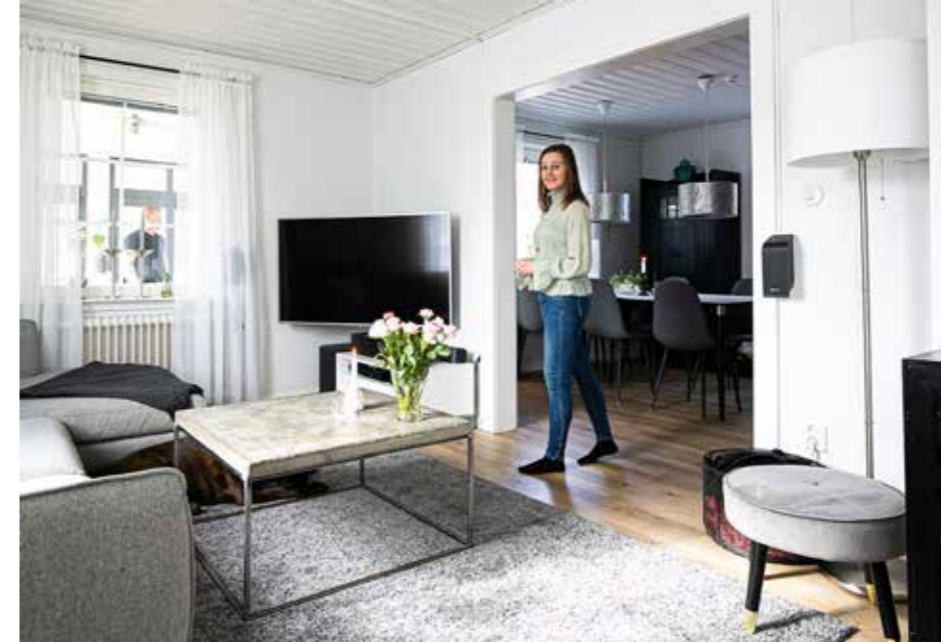
ÖPPEN PLANLÖSNIG. Det ljusa ombonade TV-rummet förenar matsal och kök. Ljusa luftiga gardiner ger ett maximalt ljusinsläpp.

kan ingen ta miste på. I stort sett har hela huset genomgått en omfattande renovering under årens lopp. Inredningen går i den svala gråvita stilen med inslag av natur och betong. På övervåningen har väggar tagits bort för att skapa en smartare lösning med sovrum för alla i familjen. Även på nedre plan ses idag en öppen planlösning med braskamin i centrum.