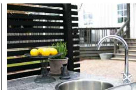
ÄTA UTE. Familjen älskar att umgås i trädgården som också kompletterats med ett robust kök. Här samlas alla för att få sig en matbit och njuta av utelivet.