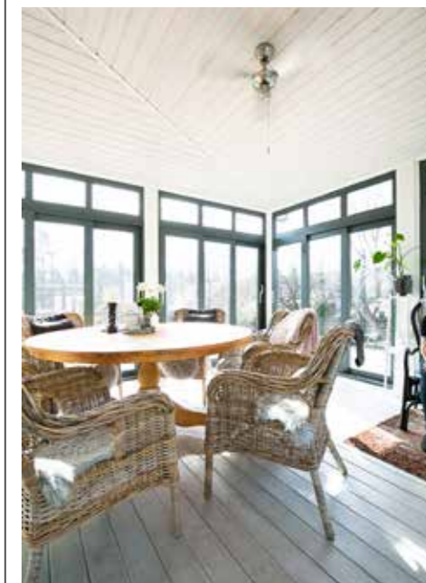
I SOLEN. Det var givet att glasverandan skulle ligga i söderläge. Här kan familjen njuta av solens värme hela dagen.