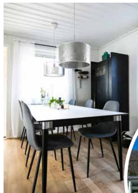
UTGÅNG. När en dörr behövdes till den nya glasverandan blev lösningen en utgång med smalare dörr så att matgruppen ändå fick plats.