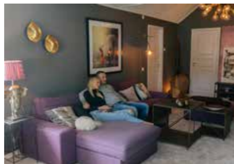
OMBONAT. – Jag inreder ombonat och med färg. Grundbelysningen hos oss tänds med ett knapptryck. Flera lampor har skymningsrelä. Tända lampor när man kommer hem är så välkomnande i höstmörkret.

– Nyligen gjorde vi om gästtoaletten. Jag ville ha lite fransk boudoirkänsla med