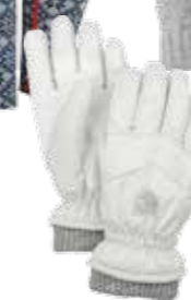
Skidhandskar/ Hestra/650 kr.