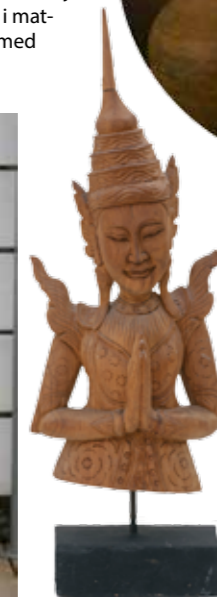
MJUKT LJUS. Ljussättning bygger mycket på skuggorna ljuset ger. Genom att jobba med indirekt ljus vars ljuskälla inte syns blir skuggorna djupare och därmed framträder accenterna ännu tydligare.

MED SJÄL. Reseminne med livsstilsvisbar från mannen som täljde den.