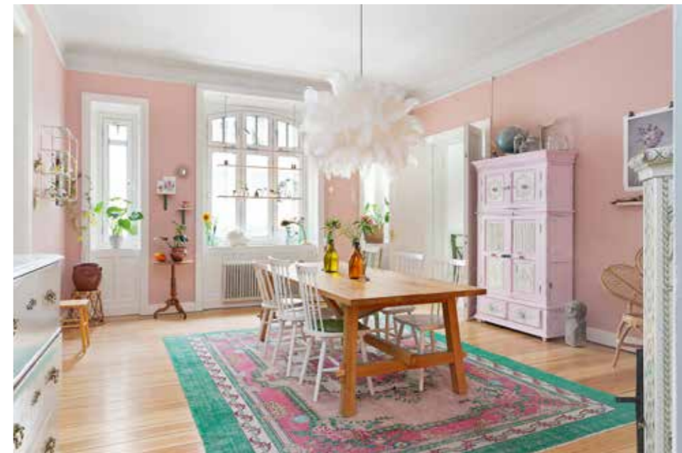
DIGITALT. Visit Sweden vill sprida inspiration om design, mode och arkitektur i Sverige internationellt, speciellt i Tyskland, Storbritannien, Frankrike och USA och gör det på swedishdesignmuseum.com . Här en inredning från Södertälje.