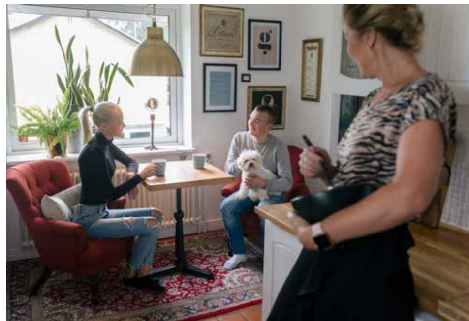
HÄNGHÖRNAN. Mässingspendeln är medvetet överdimensionerad för att ge köket balans. – Här i Emmafåtöljerna är det alltid någon som hänger. Ofta på morgonen, vid en fika eller när någon lagar mat.