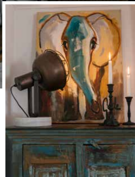
ACCENT. Små och stora accenter måste synka utan konkurrens i en inredning.