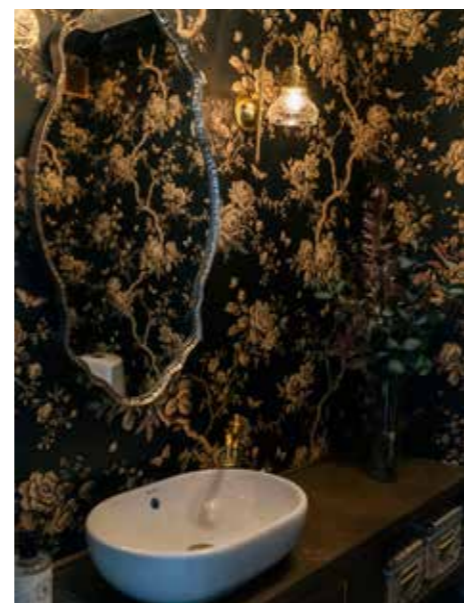
BLICKFÅNG. Lamporna sätter stilen. – Jag får ibland frågan om man får ha icke badrumsgodkända lampor exempelvis på gästtoaletter: Det får man så länge det inte finns någon golvbrunn i rummet.