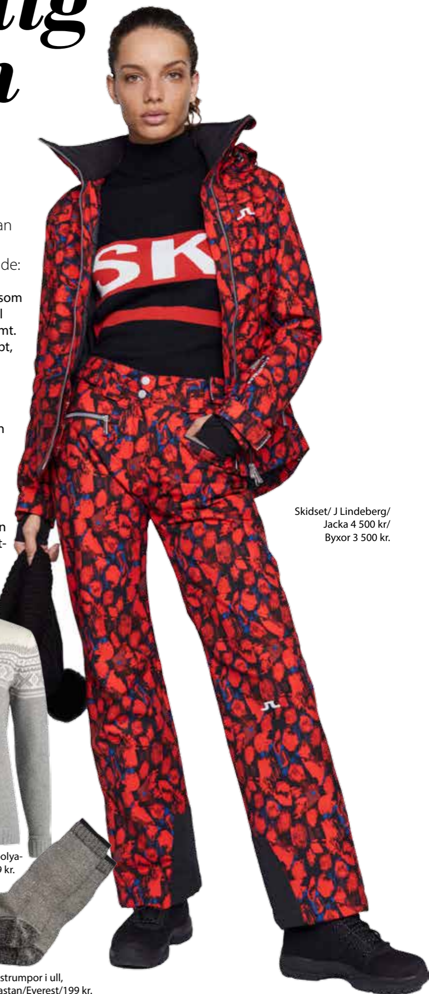
Skidset/ J Lindeberg/ Jacka 4 500 kr/ Byxor 3 500 kr.

Lager 3 är det skikt som ska vara vind- och vattenavvisande. Det bör samtidigt vara i material som andas och har förmågan att släppa ut fukt inifrån, som tex Gore Tex och Hydratic. Fuktutsläppet kan även här ske genom ventilationsöppningar som dragkedjor. Plagg i bomulls- och syntetblandning