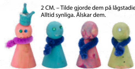
2 CM. – Tilde gjorde dem på lågstadiet. Alltid synliga. Älskar dem.