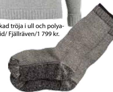
Tjocka funktionsstrumpor i ull, polyamid och elastan/Everest/199 kr.