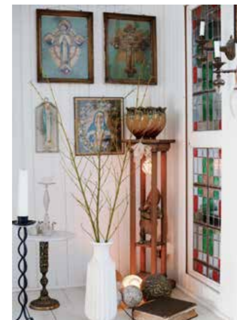
SPÖKBOSTAD. Den sakrala hörnan kom till för att blicka husets alla spöken som sen dess lugnat sig betydligt.