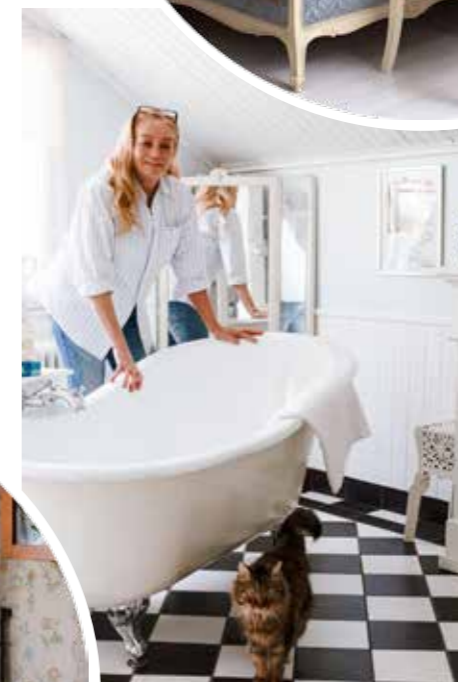
PÅ ÖNSKELISTAN. Ett stort badkar med lejon tassar inhandlades hos ett lokalt byggnadsvårdföretag.