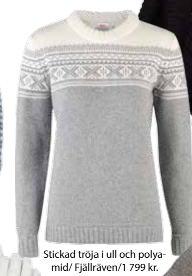
Stickad tröja i ull och polyamid/ Fjällräven/1 799 kr.