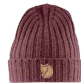
Dubbelstickad ullmössa/ Fjällräven/399 kr.