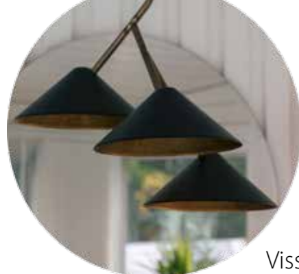
GRENVERK. - Älskar det guldiga ljuset. Konsthantverk Tyringe.