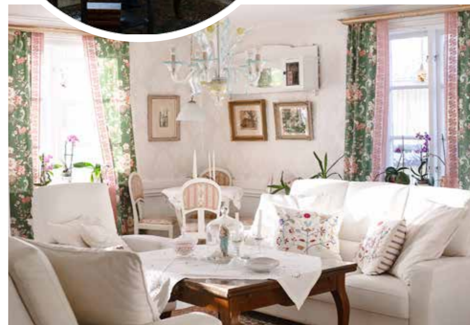
LUGN & RO. I kaffesalongen är tystnaden påtaglig. Här avnjuts det kaffe och spelas spel. Och orkidéerna trivs och blommar flitigt året om.