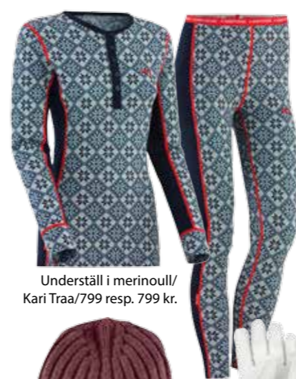
Underställ i merinoull/ Kari Traa/799 resp. 799 kr.