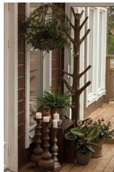
YTA. För att möblera med matmöbel bör rummets bredd inte understiga 3 meter. – Vårt uterum är 3,70 x 6,5 m. Vi har också plats för en mjuk sittgrupp.

PROCESS. – Låt det ta lite tid att bli med uterum, säger Kerstin Nilsson på Skånska Byggvaror. Resultatet brukar bli bättre med genomtänkta val.