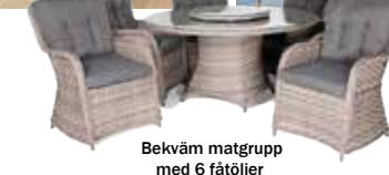
Bekväm matgrupp med 6 fätöljer