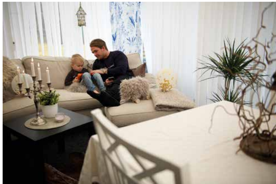
GILLA LÄGET. – Man får släppa en del krav för att få vardagen att gå ihop. Lägga av att överprestera och låta det vara stökigt ibland. Inte träffa så många vänner som man vill. Det är bara så just nu.

Som vid amningen exempelvis. Och den närhet som skapas där.