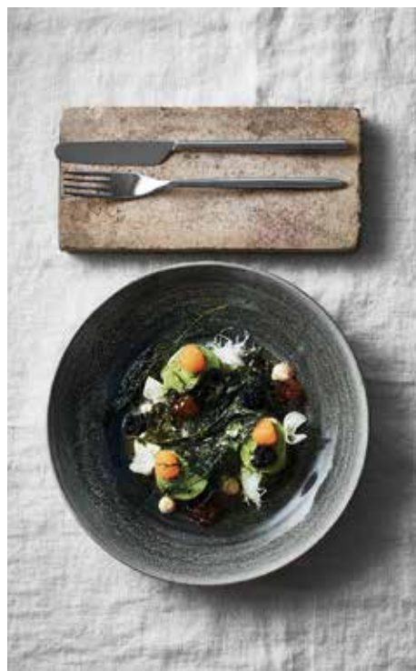
ÅRETS KOCKTRENDER. Den övergripande trenden på restaurangerna framöver spås bli multimat. Den sammanfattas i fyra undertrender: svinnovation, rätt utan etikett, själ-sosam kost och matmakeovers.