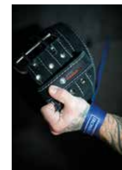
NYA MÅL. – Jag rensar huvudet genom träning. Har alltid gjort det. Då släpper allt. Otroligt skönt. Nu kör jag CrossFit tre gånger i veckan ungefär 1½ timma. Skön egentid som är viktigt att ge varandra.

På G: Det är kul med rörliga bilder. Och foto. Verkar bli mer framöver.