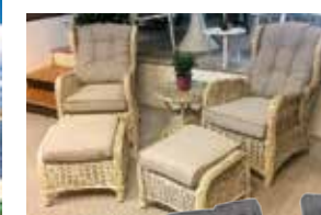
Bekvämt reclinerset i konstrotting