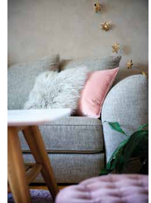
PUTSAT. En rå betongvägg i vardagsrummet sätter industrikänslan. – Det är snyggt att mixa stilen med skandinaviskt, aningen sobra inslag i inredningen.

– Det fordras planering. Och det är jag inte bra på. En katastrof egentligen. Ska