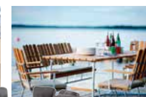
Tidlösa möbler från Grythyttan