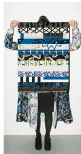
10-GRUPPEN. Ten Swedish Designers var verksamma under åren 1970-2015.