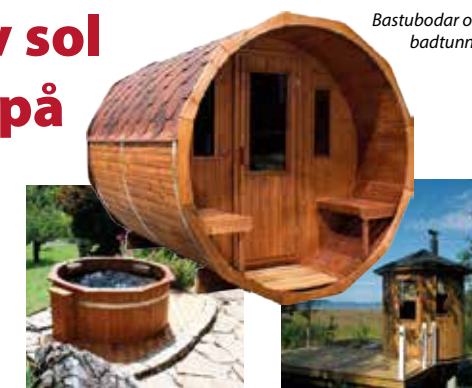
Bastubodar och badtunnor

Vi har ett stort utbud av markiser badtunnor och bastubodar. Vi kan lösa allt från idé till färdigt resultat.