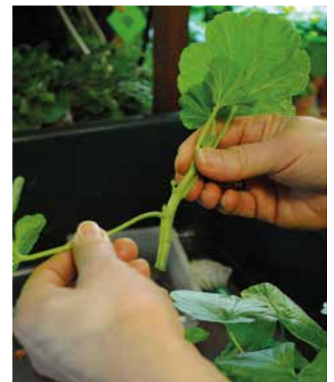
AKTUELLT. Snitta pelargonsticklingen och behåll 4-5 blad. Nyp bort de nedre bladen. Placera i kruka med blomjord. Ställ ljust men skydda mot sol.

– Speciellt den sistnämnda är en lätt nybörjarsort som växer bra bara den får vatten. Bönor bör däremot sås inne först. Alla kommer inte upp och sätter man ut dem när de är plantor får man täta och fina rader.