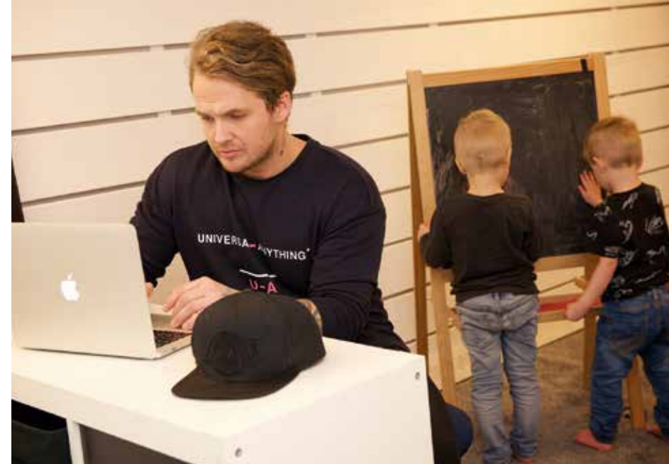
HEMMAJOB. Arbetsrummet är också lekrum. – Bloggandet på pappalivet.com är ganska nytt. Men väldigt kul. Skriver ärligt om mitt pappaliv. Har öppnat upp nya sidor i mig. Som t ex foto och film.