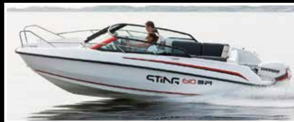
Sting 610 BR