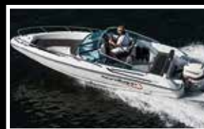
Nordkapp 605 Avant