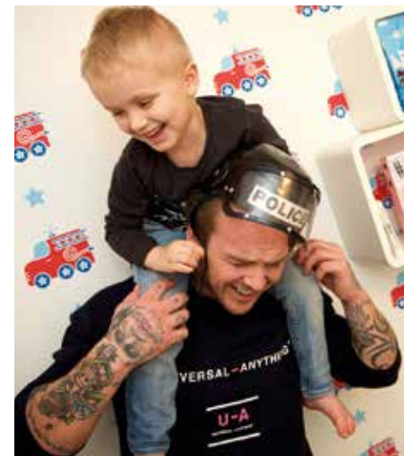
STATUSFRITT. – Under tiden med Vilde på sjukhuset Ronald Macdonald möttes människor i samma situation. Ingen pratade jobb. Vi hade bara fokus på det viktiga i livet: Att våra barn skulle bli bra.

– Vi valde att flaskmata barnen. Just för att jag tidigt skulle kunna bygga närhet till dem.