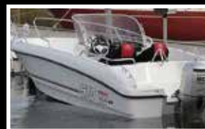
Micore 570 CC