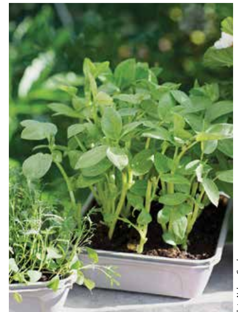
ÅRET RUNT. – Enklast att lyckas med är ärtskott. Bladsallad och spenat fungerar också.