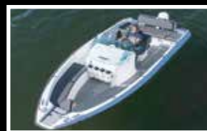
Sting 530 S