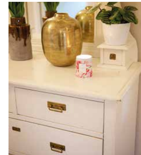
HALLBYRÅ. – Den har farfar snickrat. Jag är också praktisk. Som ung nästan bara. Nu vet jag att jag är mer. Ångrar idag att jag inte satte skolan först.

– För ett par år sedan drabbades vår största son av en cysta mellan hjärnhalvorna. Det har medfört många turer på sjukhus och han behöver fortfarande extra stöd. Samtidigt har vi ytterligare 3 små barn