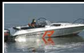
Nordkapp 605 Ranger