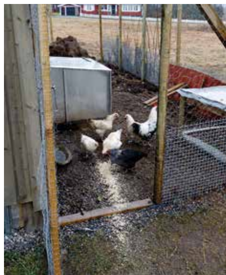
VÄXELVERKAN. Hönorna håller efter skadeinsekter och gillar småpotatisar, blast och överbliven sallad. Belöningen är ägg.

– Jag gick med för att jag ville lära mig mer om trädgårdsodling. Då hyrde vi ett hus och började med ett litet trädgårdsland.