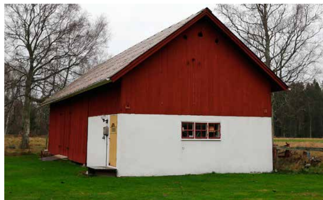
NYA LADUGÅRDEN. Idag är ytorna här mer funktionella.

Vi köper stål och metallskrot, alltid till högsta dagspris!