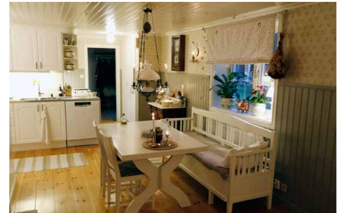
INRETT MED SJÄL. Loppisfynd och antikviteter som harmonierar med huset finns lite överallt i Åkes och Pias hem.