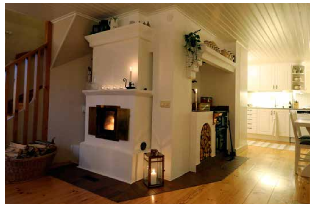
CENTRAL VÄRME. Den gamla rörspisen värmer upp hela huset när den är igång - och det är den för det mesta när kylan ute kryper på. Frisen i ovankanten visar var innertaket fanns innan Åke höjde alltihop.

valde de att göra om alltihop och dessutom addera en våning ovanpå så att huset fick två rum till. Tvättmaskinen flyttades ur badrummet till en egen miniavdelning och då blev det plats för rena spa-avdelningen med bastu, badkar och dusch.