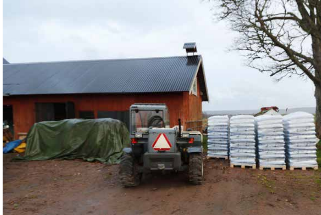
MINSKAT LAGER. Trots dubblerat pris är suget efter pellets stort idag. Agronola brukar ha hela gårdsplanen full så här års, men nu finns bara den här lilla samlingen - och den är i första hand vikt åt gamla trogna kunder.

– Jag får prioritera och fördela ut små poster till gamla trogna kunder i första hand. För min del går det bara att beställa mindre