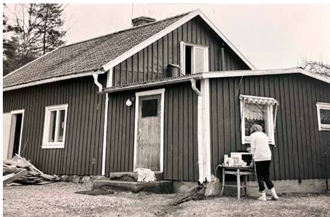
FLEXIBILITET. Ombyggnadstiden var en tuff period. Här fixar Pia dagens lunch i "köket" och barnen fick sängplatser i det som skulle bli bastu.

Så där höll det på under ett intensivt halvår 1986 och när allt, inklusive vitvaror i kök och tvättstuga, summerades stannade kostnaden på 150 000 kr. För ett helt hus. Dyraste posten var takpannorna.