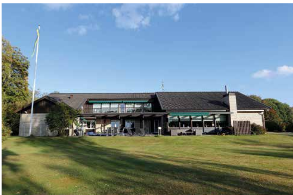
ARKITEKTRITAT. Huset i Källby är i välbevarad typisk 60-talsstil i vitt tegel. Fronten är vänd ut mot Vänern. Och här bor familjen Korduner.

– Men skicket gav förstås mycket övrigt att