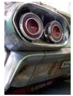
HUVUDBRY. Kännarna lär klia sig i huvudet. Bakrampen är ju från 1960 års modell och dessutom modifierad. Men bilen är ju en 61:a.