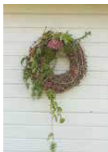
ENKELT. Färdig kransstomme underlättar. Häng upp eller lägg på bord ute.