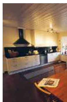
RYMLIGT. I köket har den gamla utrustningen bytts ut mot modern. Redan från början var köket härligt stort.