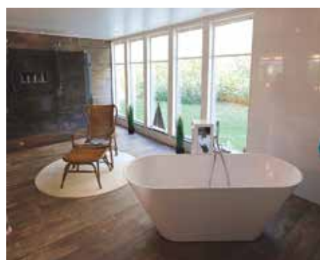
MODERNT. När det kom till badrumsrenoveringen sparades inte på någonting. Förutom ny inredning togs även nya fönster upp. Tidigare fanns bara små ljusinsläpp uppe vid taket.