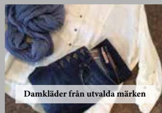
Damkläder från utvalda märken