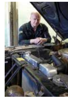
MOTOR. Kraftkällan är originalmotorn, en 390 som dock fått vassare kamaxlar och Tripower-förgasare. – Men ventilhuskåporna från en 429:a kommer nog att förbrylla en del!