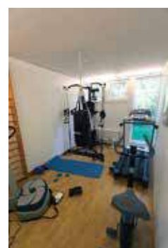
VÄLTRÄNAT. Intill spa-avdelningen finns ett välutrustat gym som används flitigt av alla familjemedlemmarna.