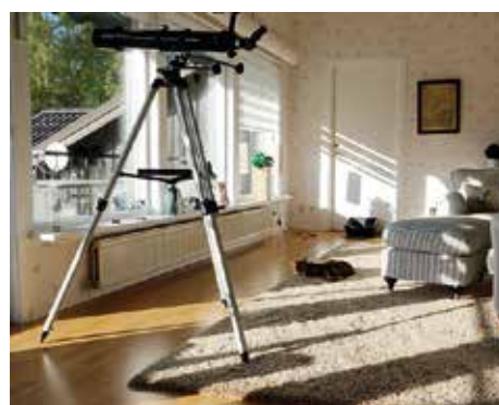
LIVLIGT. På båda våningarna står rejäla kikare redo för snabba insatser. Fågelskådning är en hobby som ger utdelning här, för fågellivet är rikt vid Vänerns strand.