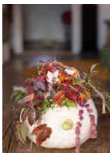
I PUMPAN. Gräv ur och sätt i en oasis. Blanda snittblommor och vildvuxet.