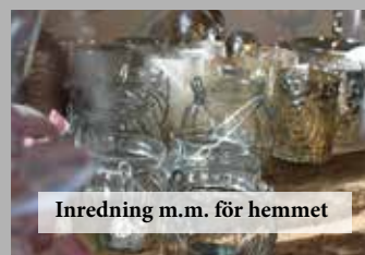
Inredning m.m. för hemmet

I den gamla mjölkadugården på Bro Gård i Istrum, mitt i vackra Vallebygden, hittar Ni oss! Hos oss på Smakfullt kan Ni handla vårt egenproducerade nötkött över disk. Alltid färskt och alltid hängmörat. I vår butik finner Ni kläder, inredning, trädgårdsartiklar, delikatesser samt lokalproducerade grönsaker i mån av tillgång och årstid. Våra öppettider: Onsdag-Fredag: 13-18, Lördag: 11-14 Välkomna till oss på Smakfullt!