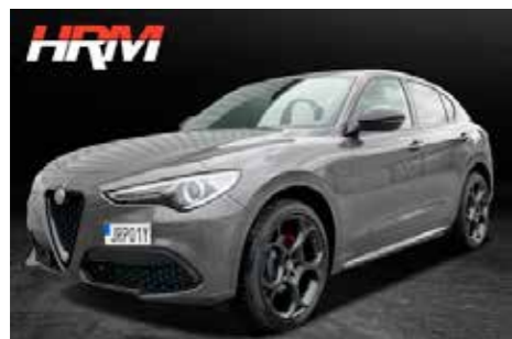
Alfa Romeo Stelvio 2022 539.900:- | 0 mil