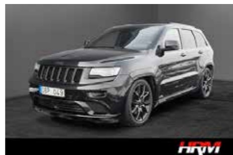
Jeep Grand Cherokee 2014 279.000:- | 12 050 mil