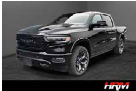
Dodge Ram 2023 919.900:- ex.moms | 0 mil