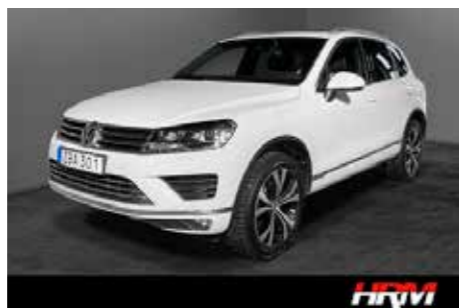
Volkswagen Touareg 2018 289.900:- | 10 000 mil