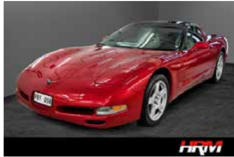
Chevrolet Corvette 1999 219.000:- | 10 142 mil