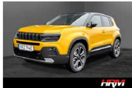
Jeep Avenger 2023 484.800:- | 499 mil