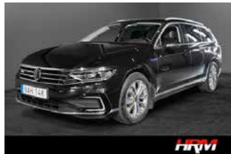
Volkswagen Passat 2023 429.900:- | 3 237 mil