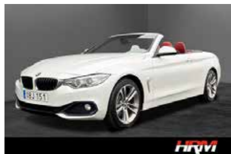
BMW 430i Cab 2016 329.900:- | 8 925 mil