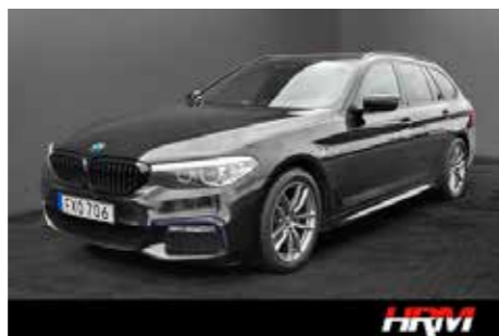
BMW 520d 2018 299.000:- | 12 710 mil