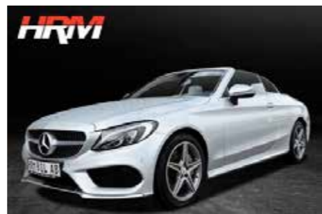
Mercedes-Benz C250 2017 389.900:- | 4 950 mil