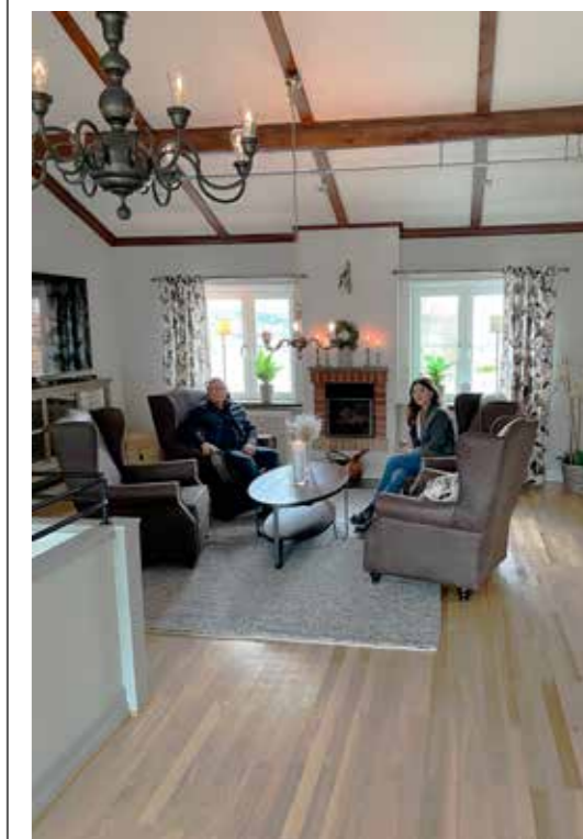
Sällsapsrummet på övervåningen är stort och luftigt med högt i tak. Lamporna är original som följt med huset.