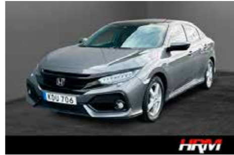
Honda Civic 2018 189.900:- | 8 110 mil