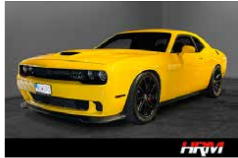
Dodge Challenger 2017 689.00:- | 4 175 mil